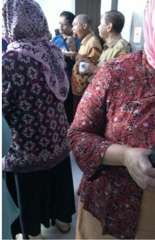
Praktik Standing Party di Aston Villa