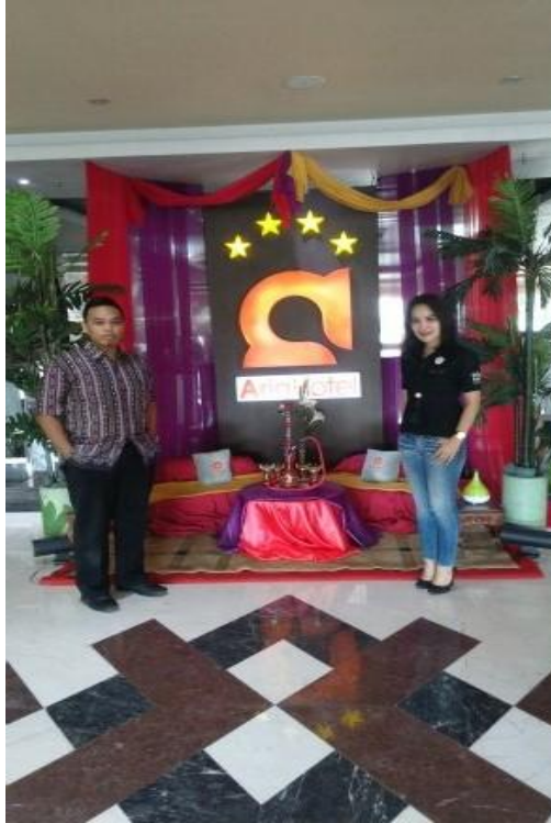
Wawancara di Aria Hotel Barito