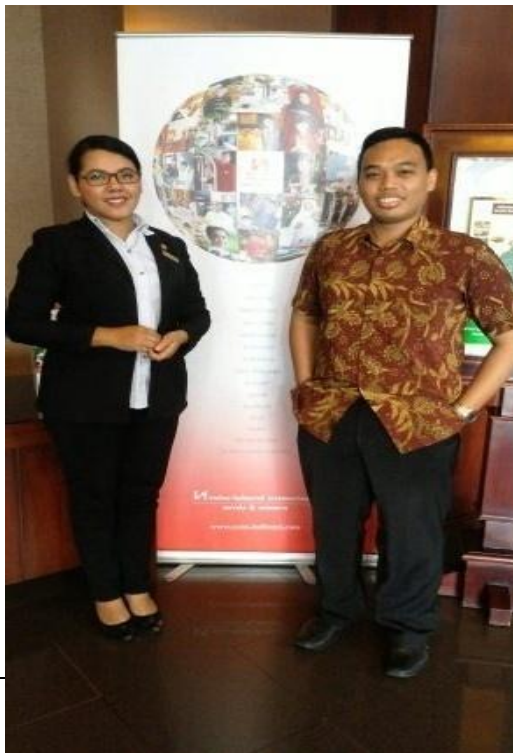
Wawancara di Swiss-Belhotel International