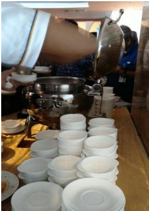
Konsep Standing Party di Hotel Golden Tulip