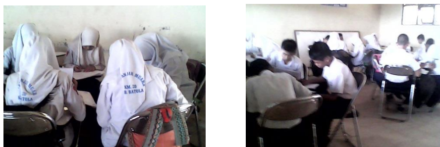
Gambar 4.4 Aktivitas siswa pada diskusi kelompok asal