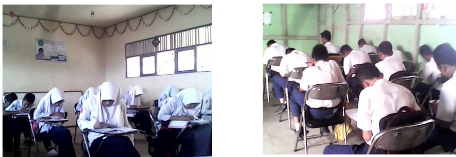
Gambar 4.6 Aktivitas siswa ketika mengerjakan kuis individu

Aktivitas siswa ketika mengerjakan kuis individu dapat dilihat pada gambar 4.6