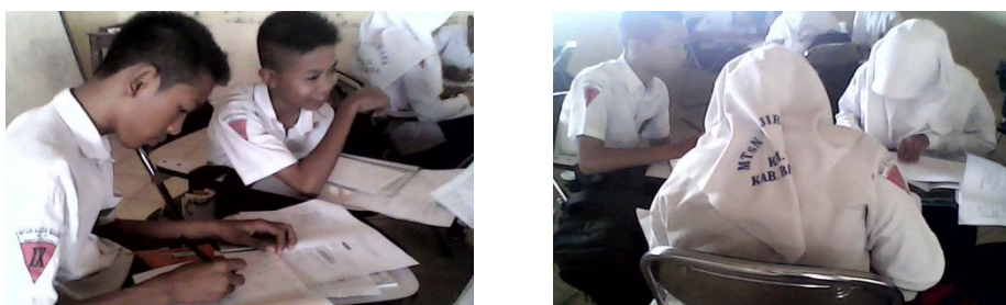
Gambar 4.3 Aktivitas siswa pada diskusi kelompok ahli

Aktivitas siswa ketika melakukan diskusi kelompok ahli dapat dilihat pada gambar 4.3