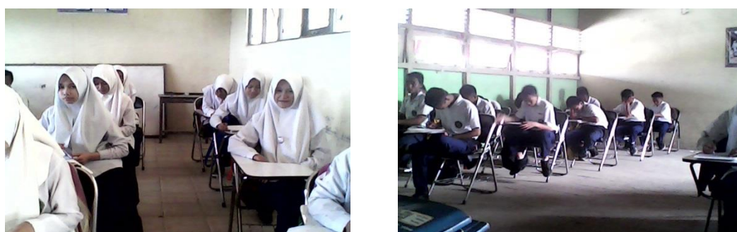
Gambar 4.1. Suasana Belajar di Kelas Kontrol

Suasana belajar di kelas kontrol dapat dilihat pada gambar berikut.