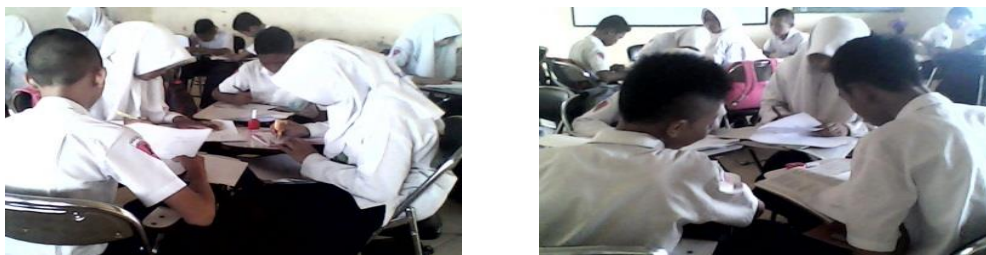
Gambar 4.2 Suasana Belajar di Kelas Eksperimen

Suasana belajar di kelas eksperimen dapat dilihat pada gambar berikut.