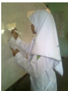
Gambar 4.5 Aktivitas siswa pada presentasi hasil diskusi

Aktivitas siswa ketika melakukan presentasi hasil diskusi dapat dilihat pada Gambar 4.5