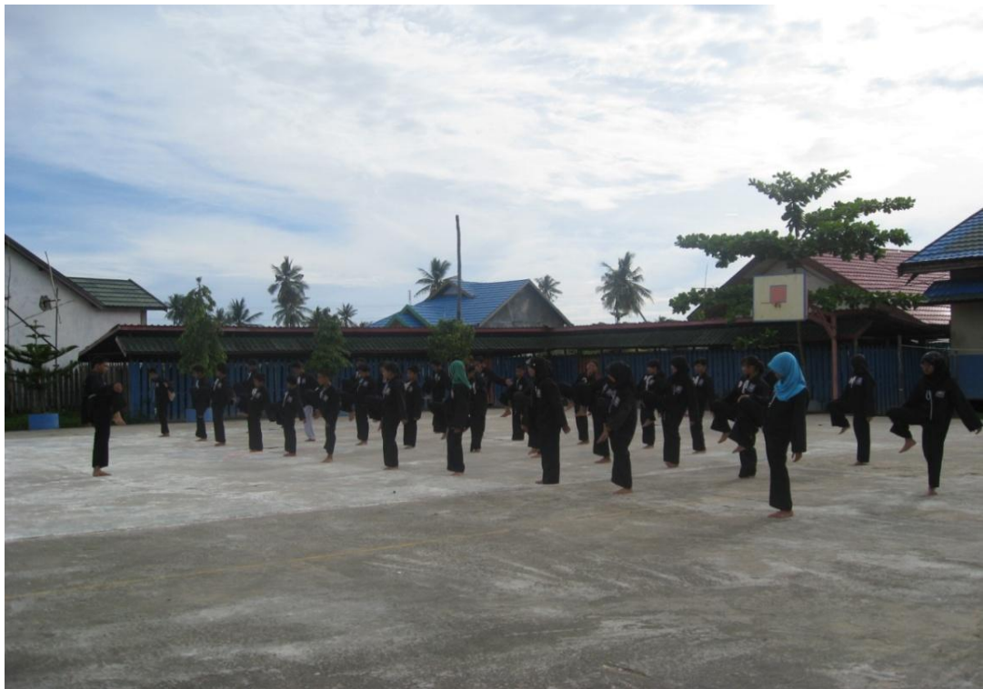
Futsal, volly dan basket