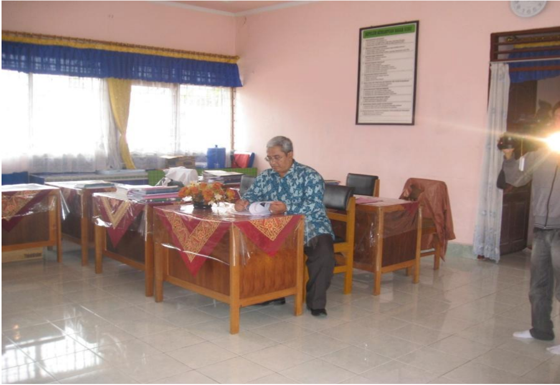
Salah satutamane sekolah