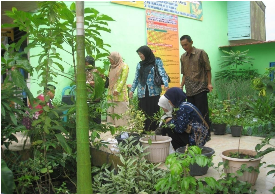
Kegiatan penanaman pepohonan dari guru-guru Dan penanaman pepohonan yang dilakukan oleh siswa