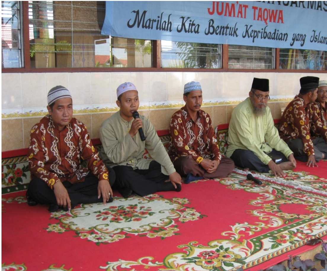
Pemberian materi keagamaan sehingga membuat anak sehat secara rohani