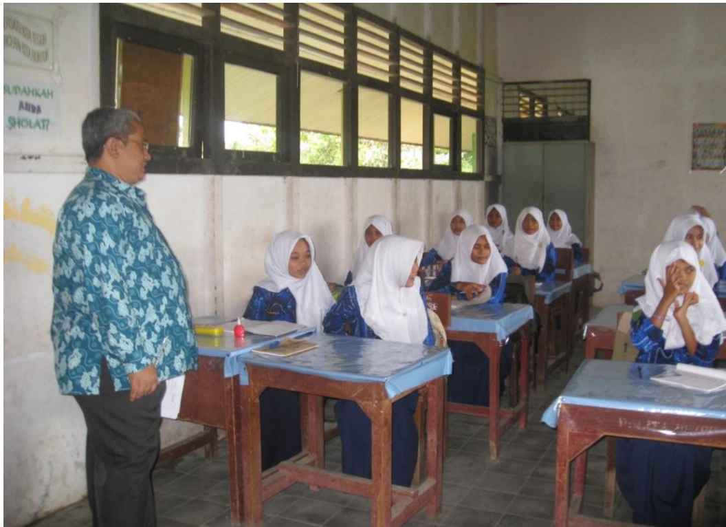
Kondisi kelas yang selalu dijaga kebersihannya