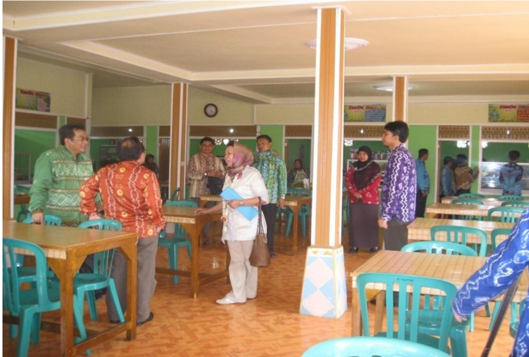
Kantin sehat dengan kondisi ruang yang bersih dan menyediakan bahan makanan yang sehat