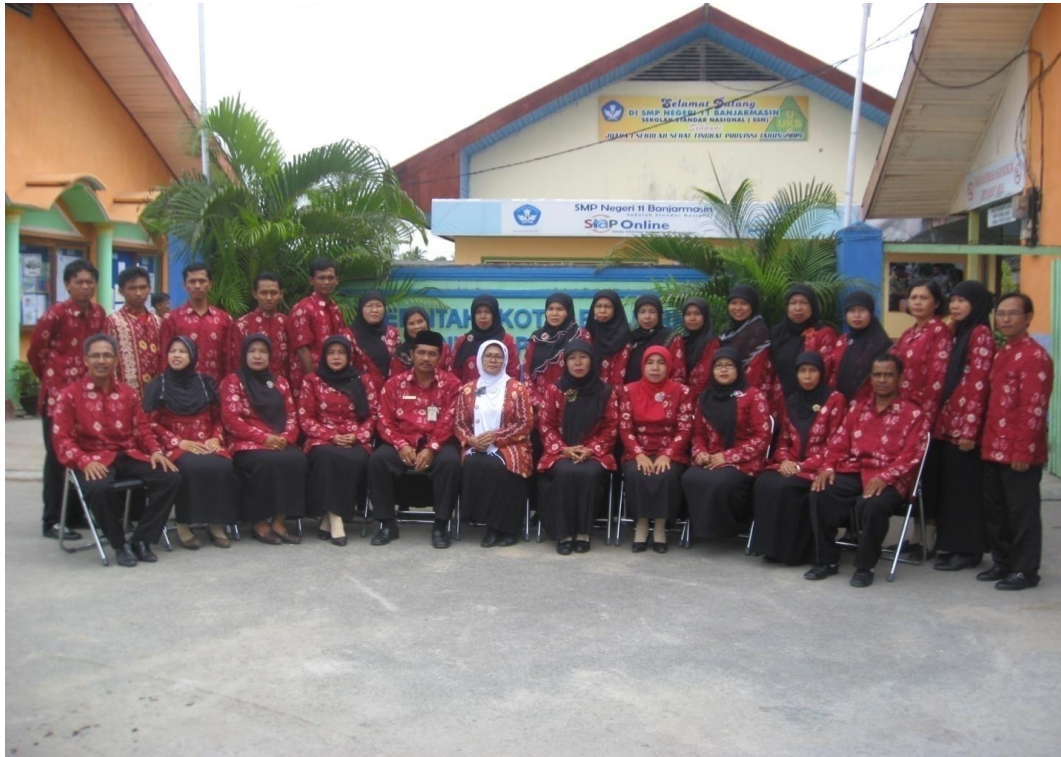
Foto guru-guru smpnegeri 11 Banjarmasin Silaturahmi dan wawancara dengan pendidik dan kependidikan di SMP Negeri 11