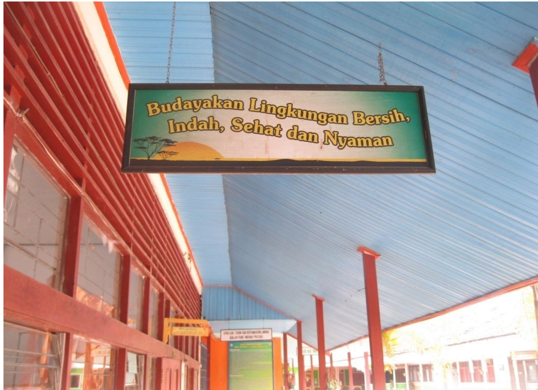
Acara Penghargaan yang diberikan untuk sekolah yang membudayakan hidup sehat dan bersih