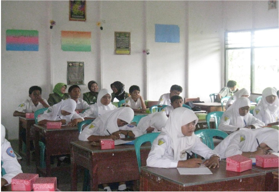
F. Bebas dari asap rokok, dan udara terasas dengan adanya penghijauan