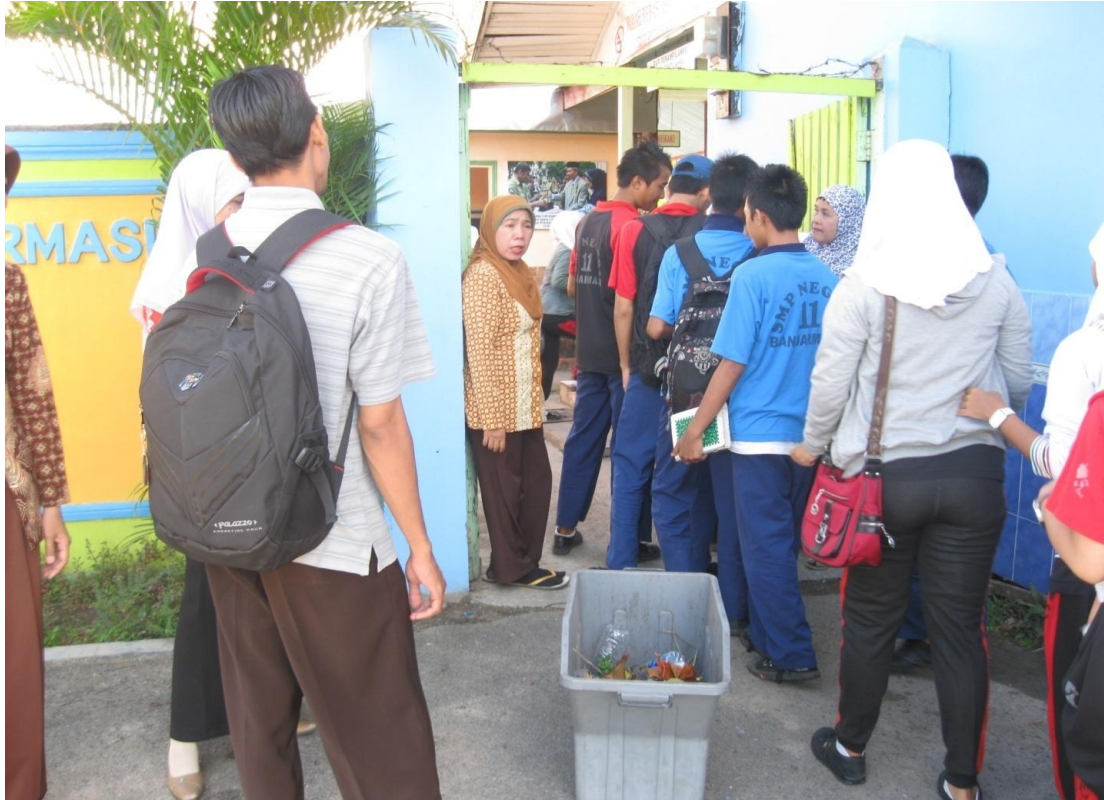
d. Mengikuti Kegiatan Olah raga dan Ektrakurikuler