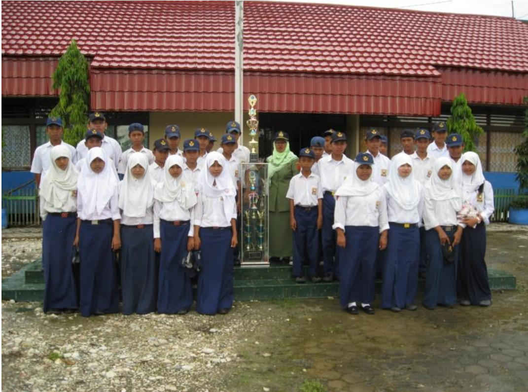
Berfoto bersama setelah mendapatkan juara atas penghargaan Sekolah Sehat