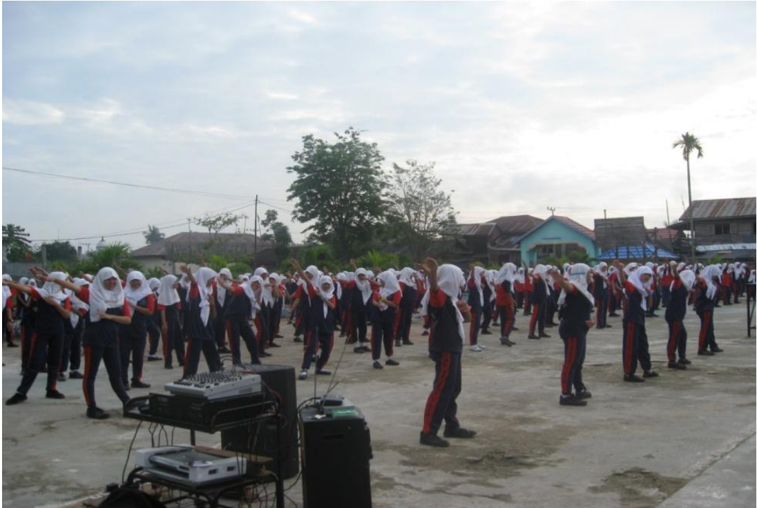
Kegiatan senam kesehatan jasmani yang diikuti oleh semua siswa dan warga sekolah