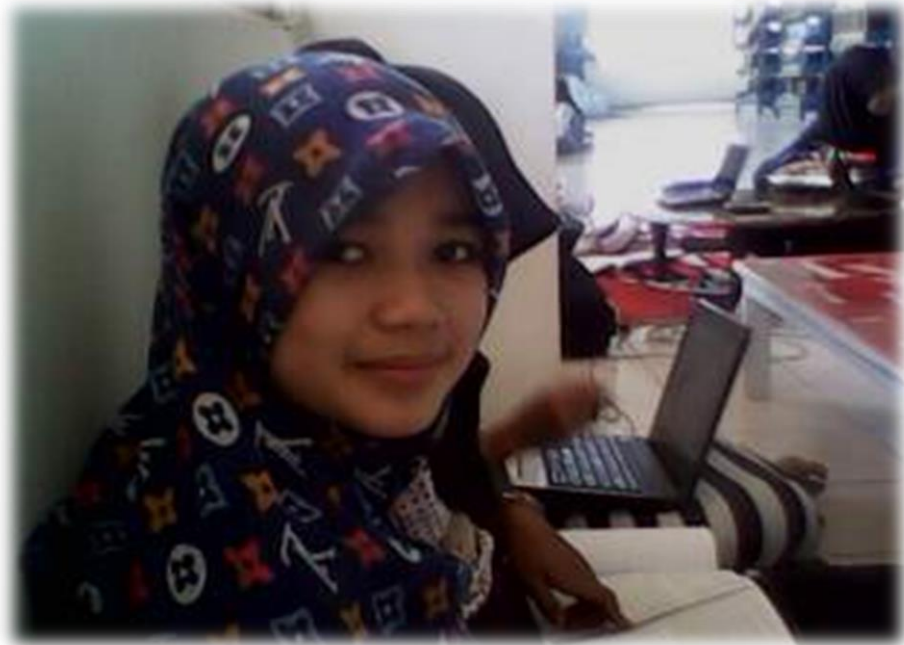
FOTO-FOTO SEBAGIAN INFORMAN