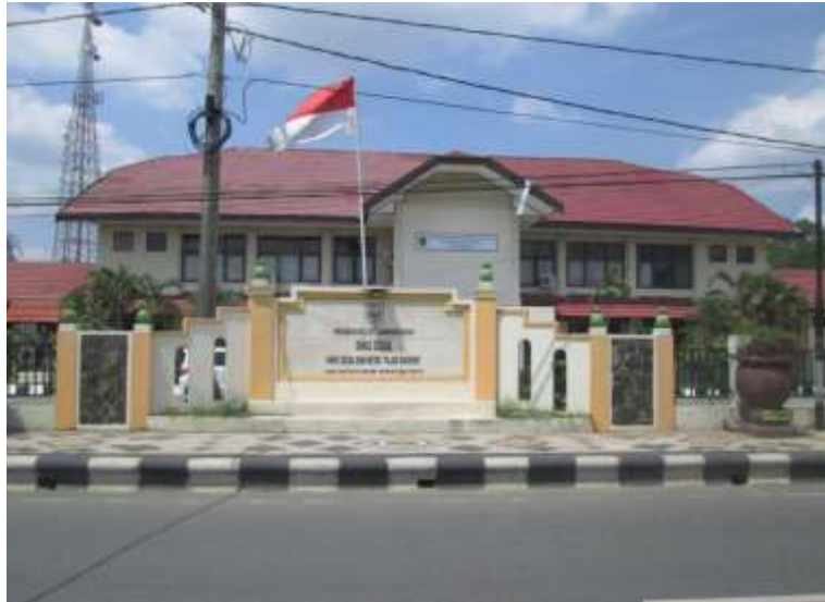
Foto lokasi penelitian