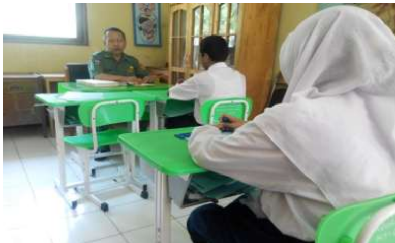
Foto pelaksanaan pembelajaran