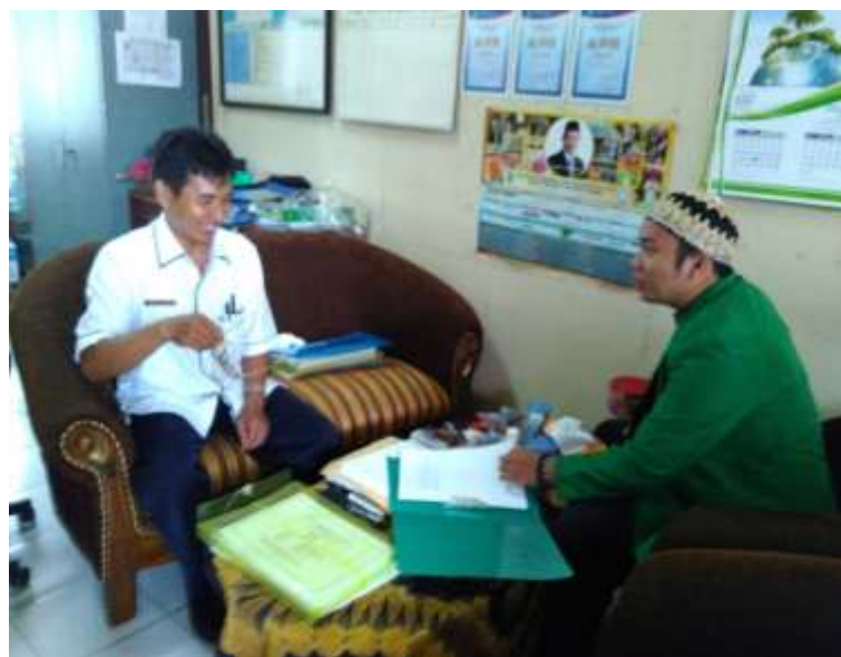
Foto wawancara dengan kepala sekolah