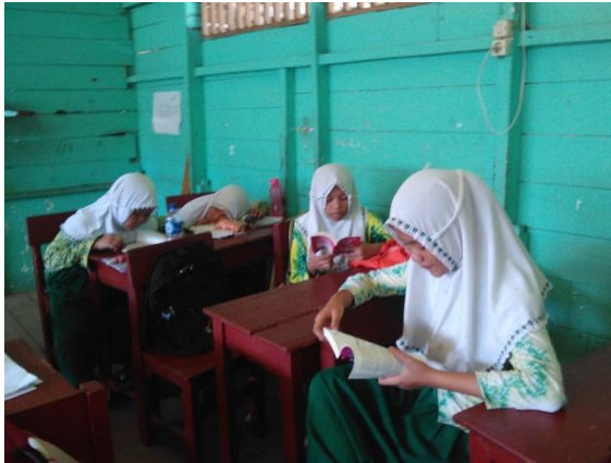
Gambar 4.7. Aktivitas membaca siswa ketika istirahat di kelas eksperimen