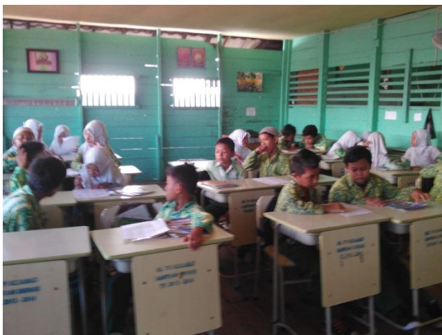
Gambar 4.2. Aktivitas siswa menjawab soal latihan yang diberikan oleh guru