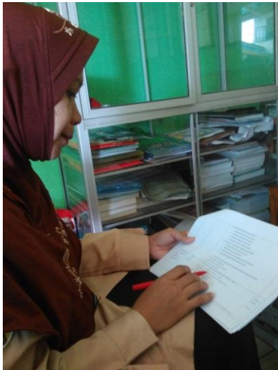
Gambar 4.1 Foto Guru Pengampu Mata Pelajaran Bahasa Indonesia memberikan validasi soal