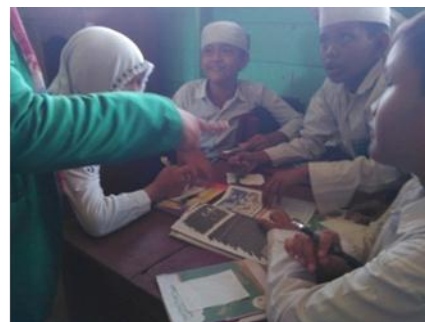
Gambar 4.9. Aktivitas kerja kelompok siswa kelas eksperimen