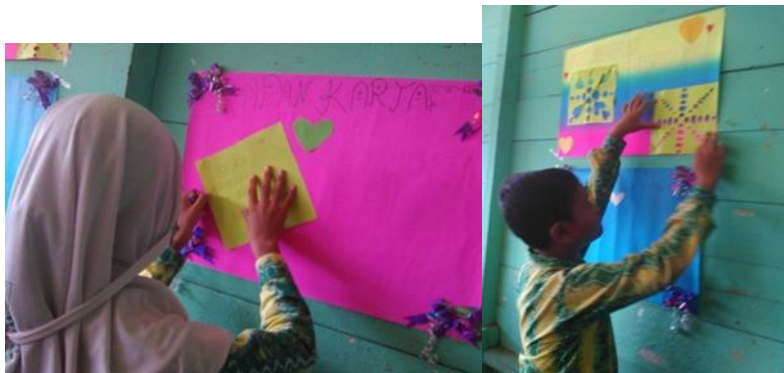
Gambar 4.5. Aktivitas siswa membuat majalah dinding dan karya tulisan di kelas eksperimen