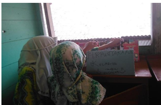
Gambar 4.6. Aktivitas siswa membuat dan menjaga perpustakaan kelas eksperimen