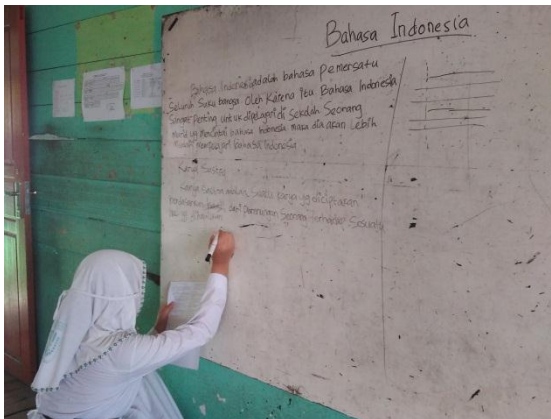
Gambar 4.3. Aktivitas pembelajaran dengan metode mencatat.