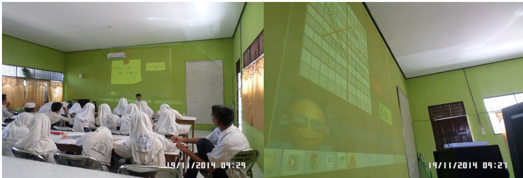
Gambar 4.1 Penyampaian materi dengan video pembelajaran

dibuat disertai dengan contoh-contoh soal dan cara menyelesaikannya. Siswa diminta untuk memperhatikan tayangan yang ada pada video pembelajaran. Setelah menyaksikan tayangan pada video pembelajaran, guru membagi siswa menjadi beberapa kelompok. Guru memberikan tugas terkait dengan tayangan video pembelajaran tersebut. Setelah itu guru mengadakan tanya jawab dengan siswa untuk mengetahui pemahaman terhadap materi yang diberikan, dan memberikan kesempatan yang sama kepada setiap siswa untuk bertanya