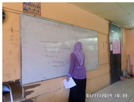
Gambar 4.2 Guru menyampaikan materi

Guru menyajikan informasi tentang materi persamaan garis lurus sesuai dengan Rencana Pelaksanaan Pembelajaran (RPP) yang telah dibuat disertai dengan memberikan contoh-contoh soal dan cara penyelesaiannya. Setelah selesai menyajikan informasi, guru mengadakan tanya jawab dengan siswa untuk mengetahui pemahaman terhadap materi yang diberikan, dan memberikan kesempatan yang sama kepada setiap siswa untuk bertanya.