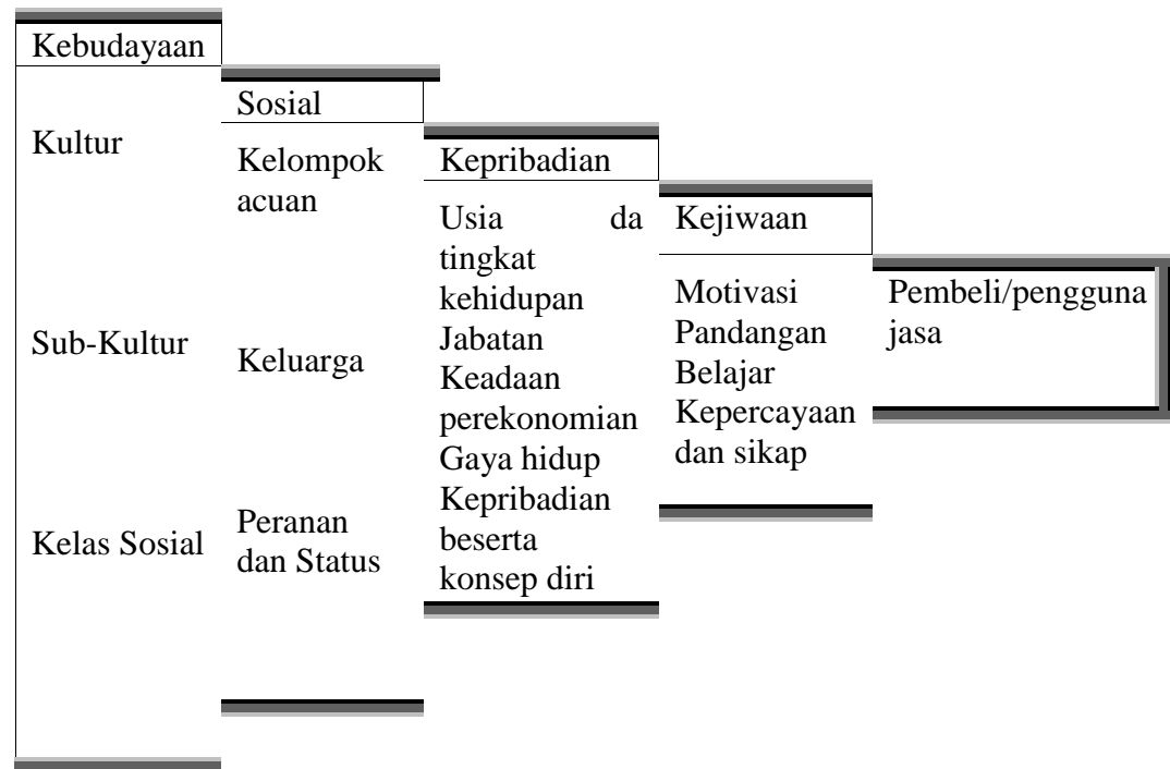
Gambar 2.1 Faktor-faktor Perilaku Konsumen 43