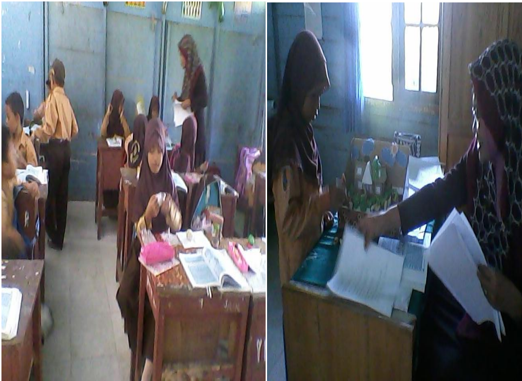
Gambar hasil karya clay dari siswa