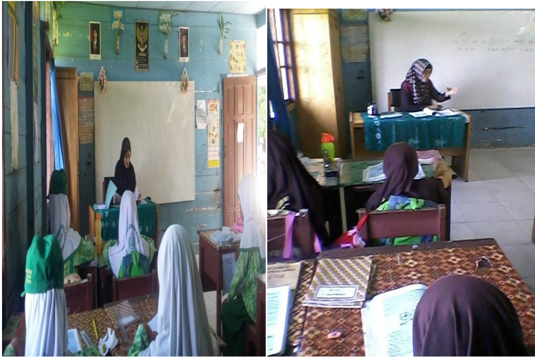
Gambar guru mengawasi siswa dalam pembuatan tokoh menggunakan clay