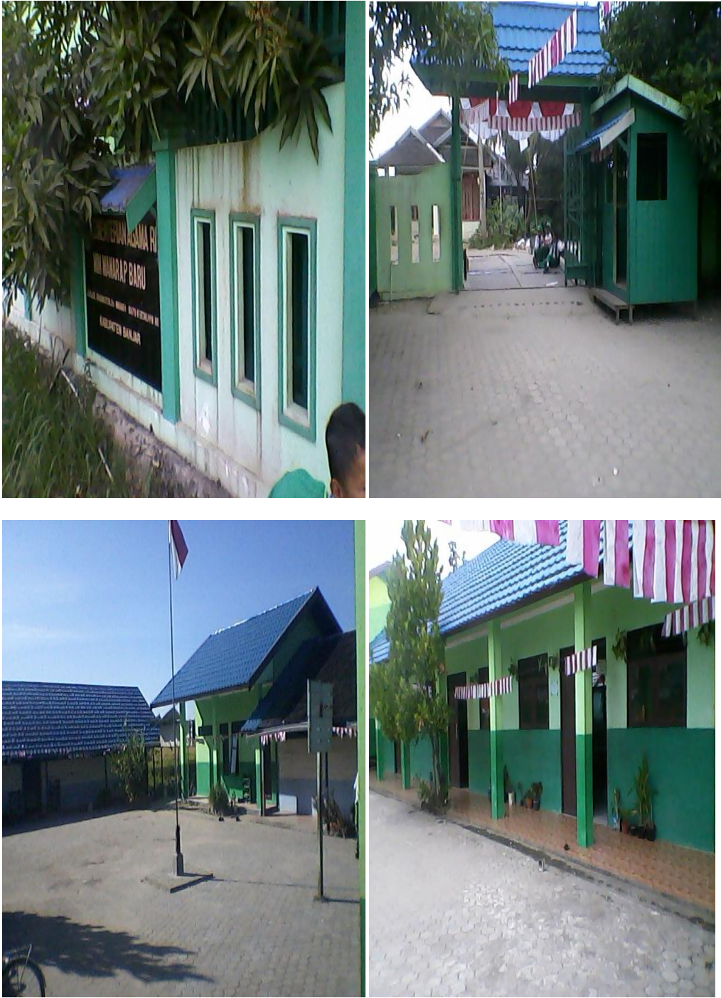
Gambar Sekolah MIN Manarap Baru