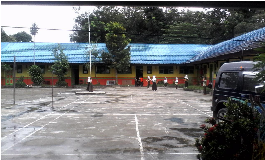
Bangunan MIN Anduhum Kec. Batang Alai Selatan