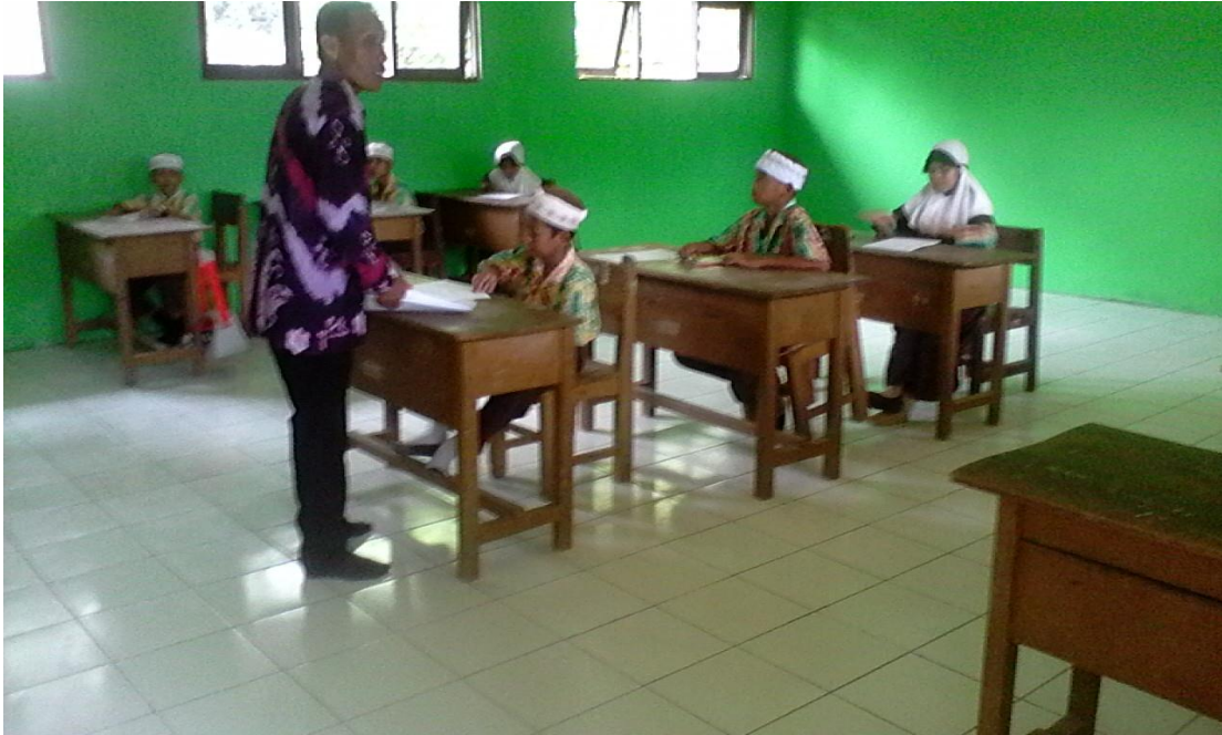
Guru menjelaskan pelajaran kepada semua siswa