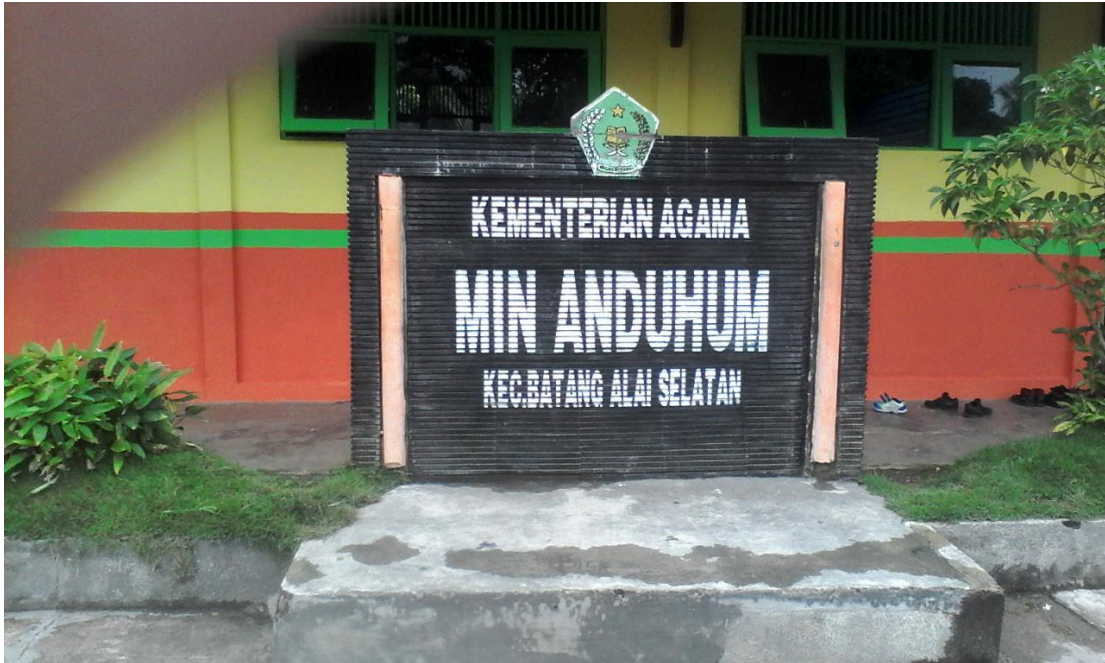
Papan Nama Sekolah MIN Anduhum Kec. Batang Alai Selatan