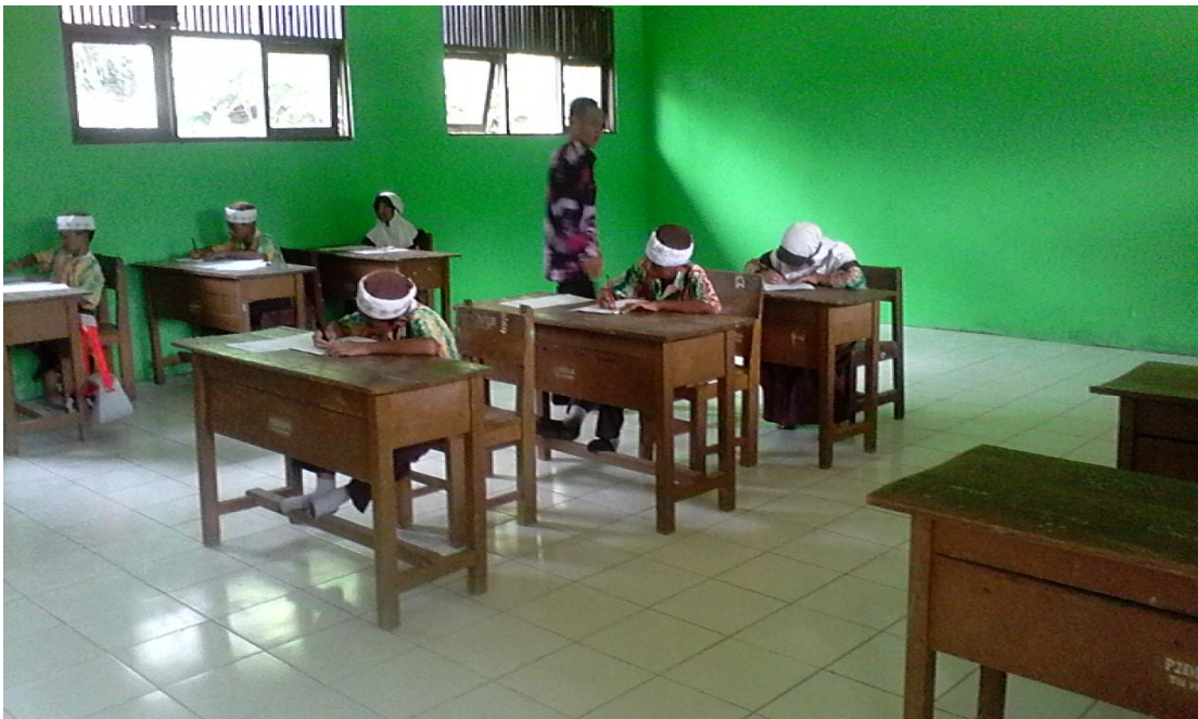
Guru mengucapkan kosakata dengan penerapan metode imla' dan semua siswa disuruh menyalin ke buku catatan