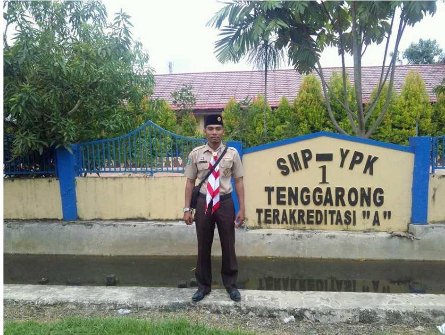
Bersama Kepala sekolah SMP YPK 1