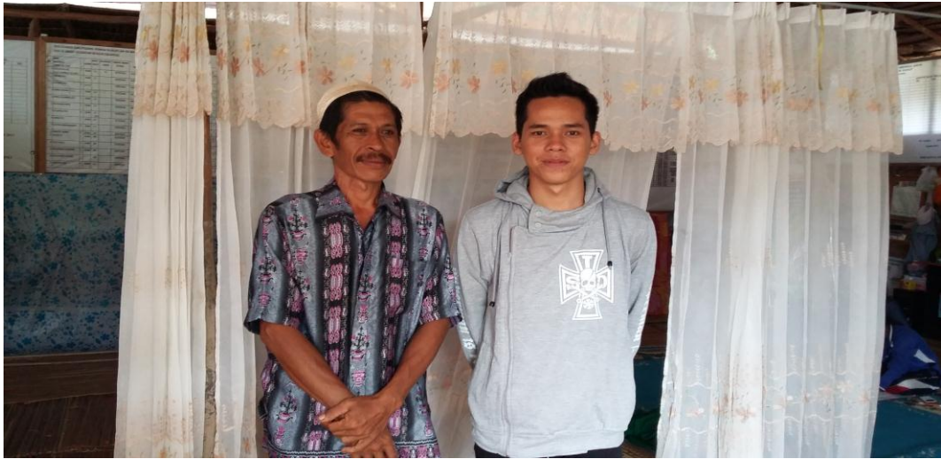
Bersama kepala sekolah MI Abi Manap