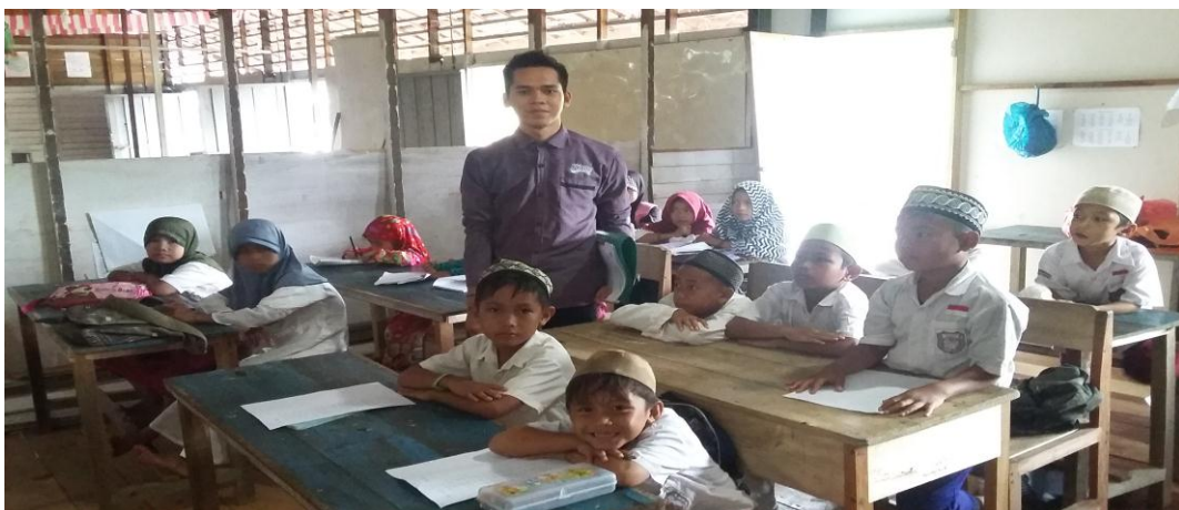
Bersama Guru Matematika dan S iswa-siswi kelas III MI Abi Manap