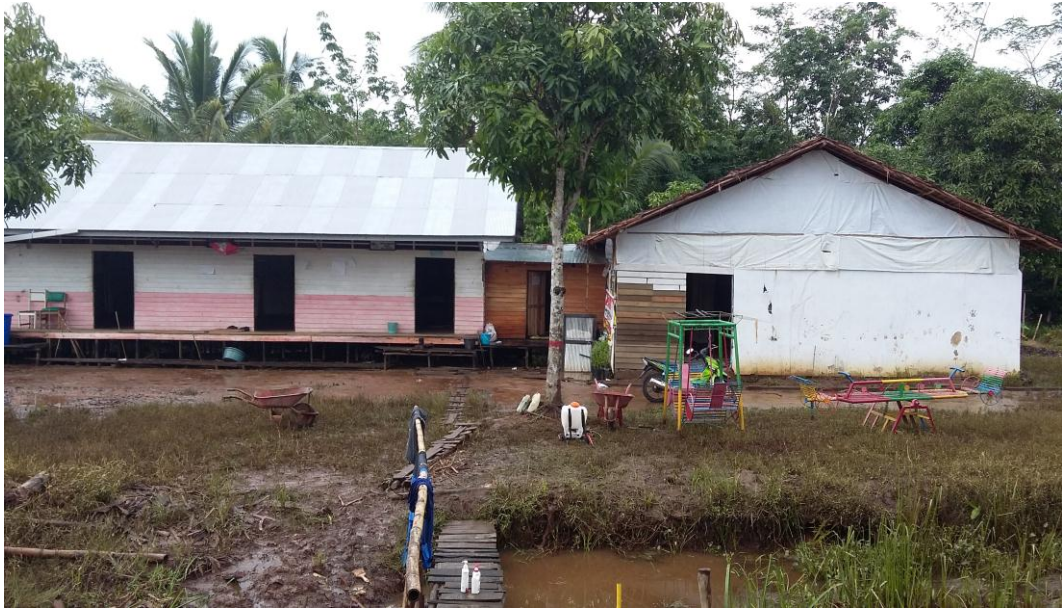
Lokasi penelitian di Yayasan Abi Manap