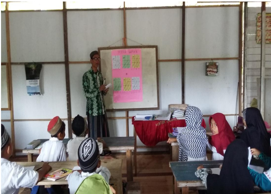
Observasi penggunaan media napier