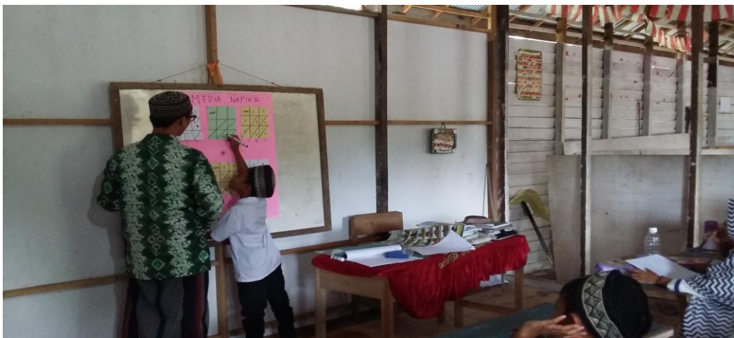
Observasi penggunaan media napier