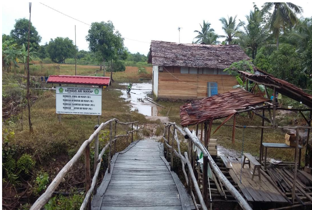
Lokasi penelitian di Yayasan Abi Manap