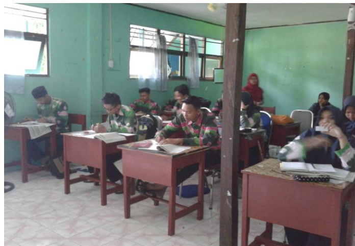
4.4. Siswa menemukan sendiri masalah dari persoalan materi

melaksanakan proses pembelajaran. Kemudian guru menjelaskan topik pembelajaran tentang integral dan siswa diminta untuk menyimak penjelasan dengan baik. Setelah itu, guru menyampaikan tujuan pembelajaran, siswa mendengar tujuan pembelajaran yang disampaikan oleh guru.