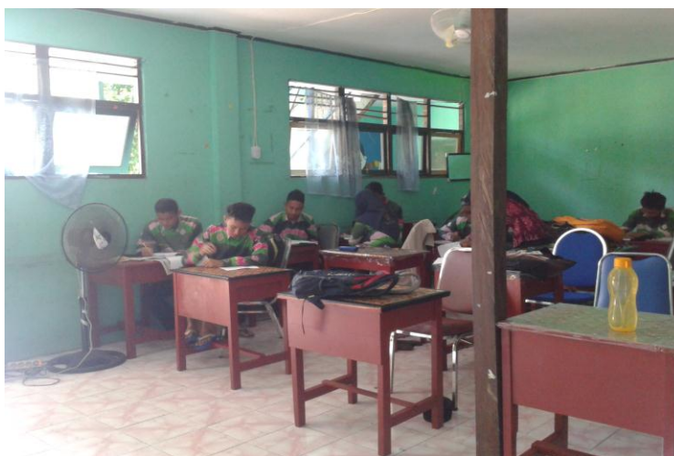
4.6. Siswa mengerjakan soal tes angket

Lalu siswa mengerjakan soal latihan dan mengumpulkan jawaban soal latihan tersebut kepada guru. Setelah itu, guru menutup pelajaran dan mengucapkan salam. Kemudian siswa menutup buku pelajaran dan menjawab salam.