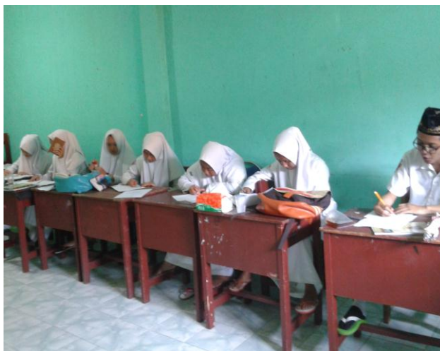
4.3. Siswa mengerjakan soal tes akhir

Pertemuan ketiga dilaksanakan pada hari Jum'at tanggal 5 Agustus 2016 pada jam ke 1 dan 2.