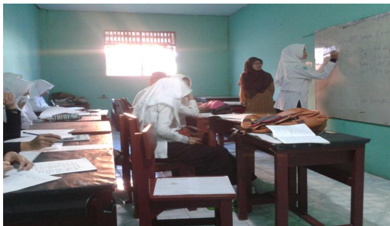
4.2. Siswa menulis jawaban di papan tulis