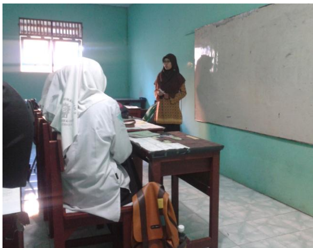
4.1. Guru mengajukan pertanyaan kepada siswa

Pada bagian ini guru meminta jawaban sementara dari siswa tentang hubungan integral dengan fungsi turunan dan siswa memberikan jawaban sementara tentang hubungan integral dengan fungsi turunan.