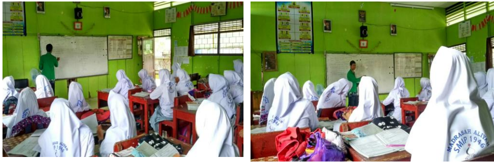
Gambar 4.2 Penyajian Informasi atau Materi oleh Guru

yang disajikan memerlukan waktu yang cukup lama sehingga memakan waktu untuk mengerjakan latihan.