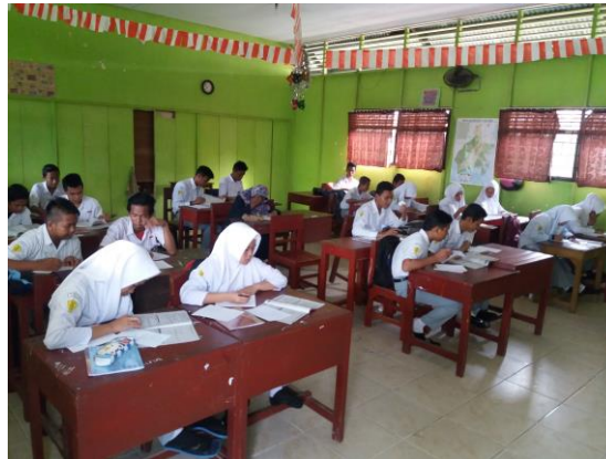
Gambar 4.5 Keadaan Siswa Saat Mengerjakan Soal Latihan

Setelah soal-soal selesai di jawab oleh para siswa, guru dan siswa membahas bersama-sama soal-soal latihan tersebut agar siswa mengetahui jawaban yang benar.