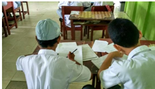
Gambar 4.3 Siswa Mengerjakan Soal Latihan Superitem

Selanjutnya, guru memberikan latihan soal-soal bertingkat atau superitem tentang materi pada hari ini. Kemudian siswa menjawab soal-soal tersebut dan guru berkeliling untuk mengawasi siswa, pada saat berkeliling guru menemukan beberapa siswa yang masih kesulitan menjawab soal, untuk itu guru memberikan bimbingan/penjelasan tambahan kepada siswa-siswa yang kesulitan menjawab soal. Pada pertemuan ketiga ini siswa sudah mulai terbiasa dengan soal-soal yang diberikan oleh guru.