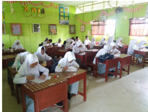
Gambar 4.1 Keadaan Siswa saat Tes Awal

Pada pertemuan pertama ini dilakukan tes awal dengan tujuan untuk mengetahui sejauh manakah materi yang akan diajarkan telah dapat dikuasai oleh siswa. Sedangkan jumlah butir soal yang diberikan sebanyak 6 buah soal yang telah di uji di sekolah MAN 1 Banjarmasin.