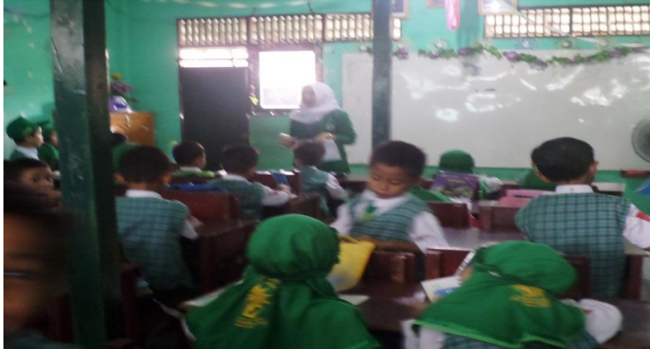
Foto Proses belajar mengajar di kelas