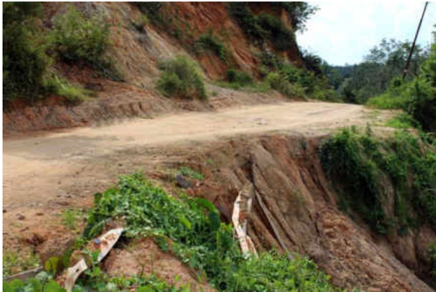
Gambar 1 Jalan menuju lokasi penelitian