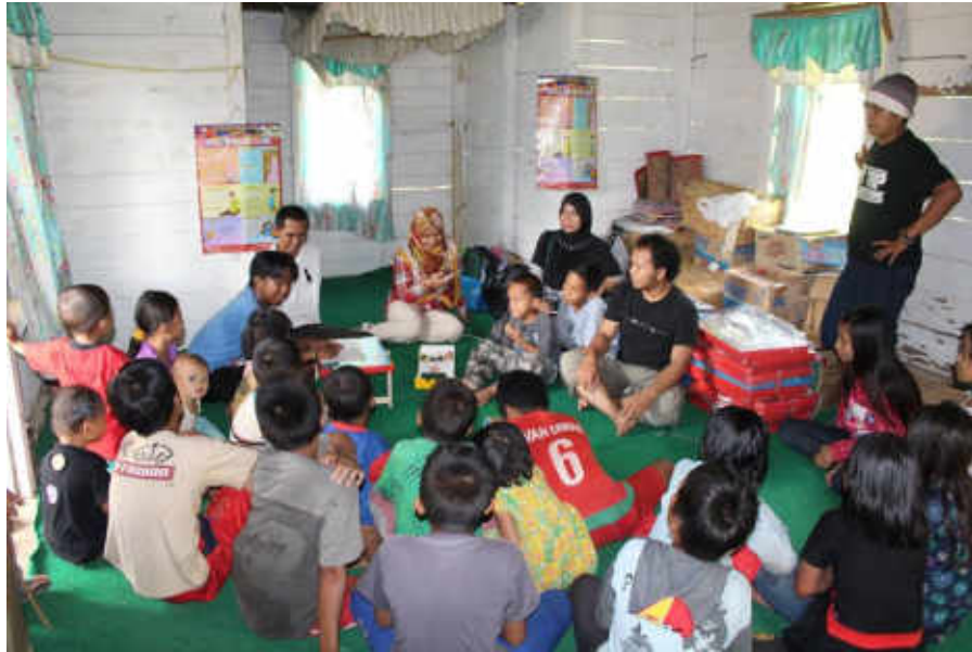
Gambar 18 Kegiatan belajar mengajar PAI metode ceramah