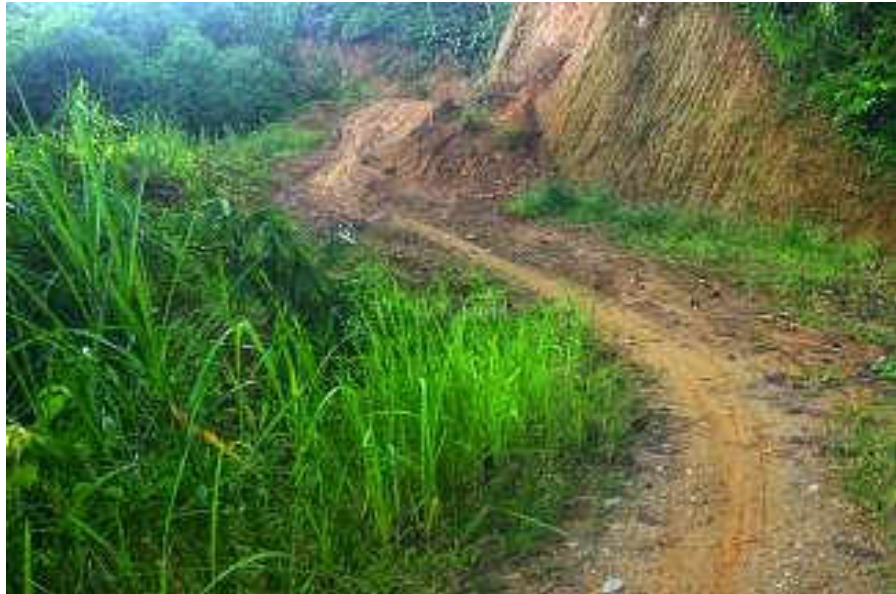
Gambar 3 Jalan perbukitan menuju tempat penelitian