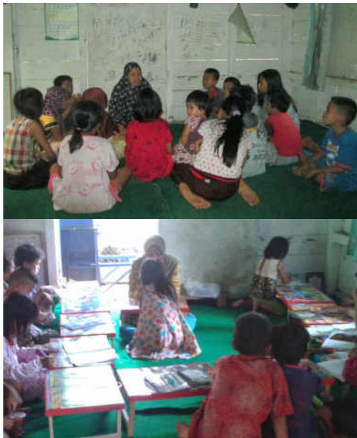
Gambar 19 Kegiatan menghafal surah-surah pendek