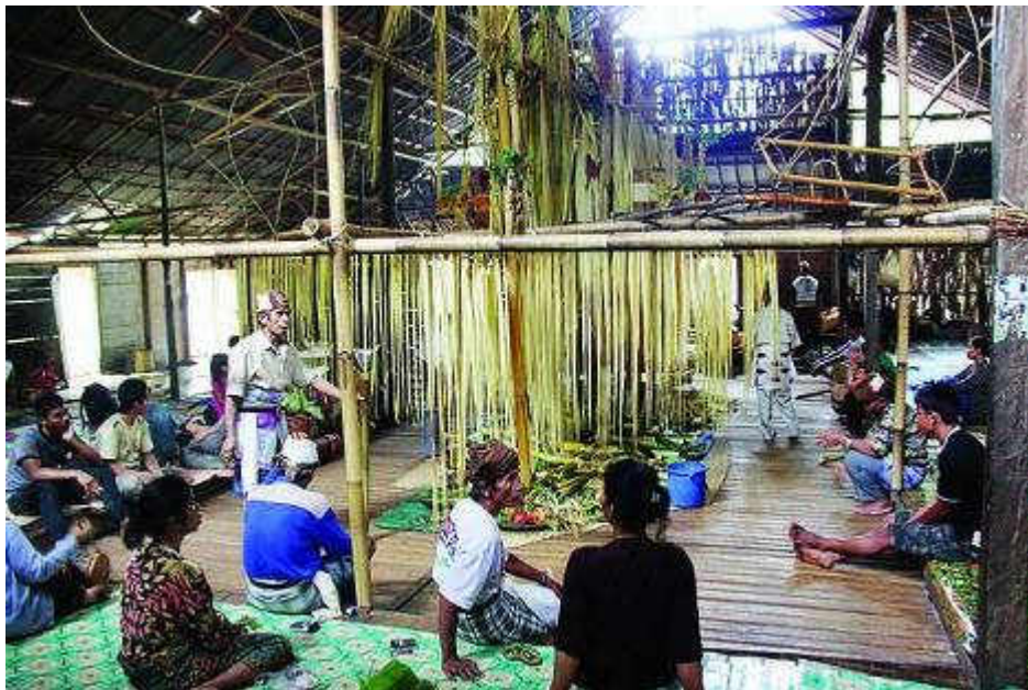
Gambar 21 Upacara Aruh Ganal Dayak Meratus