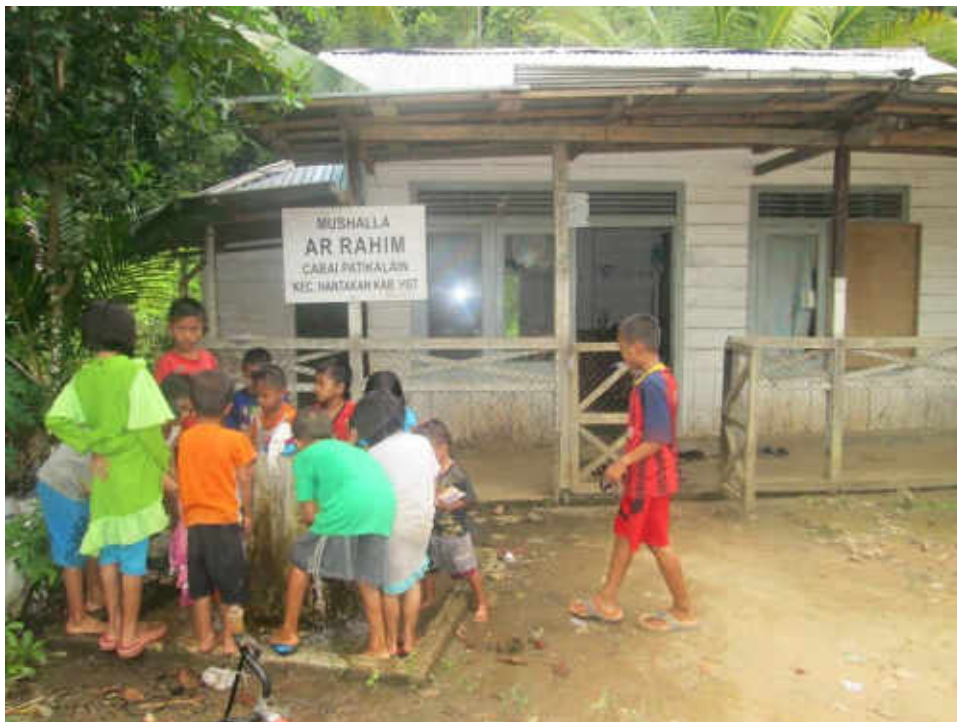
Gambar 13 Praktek tatacara berwudhu peserta didik