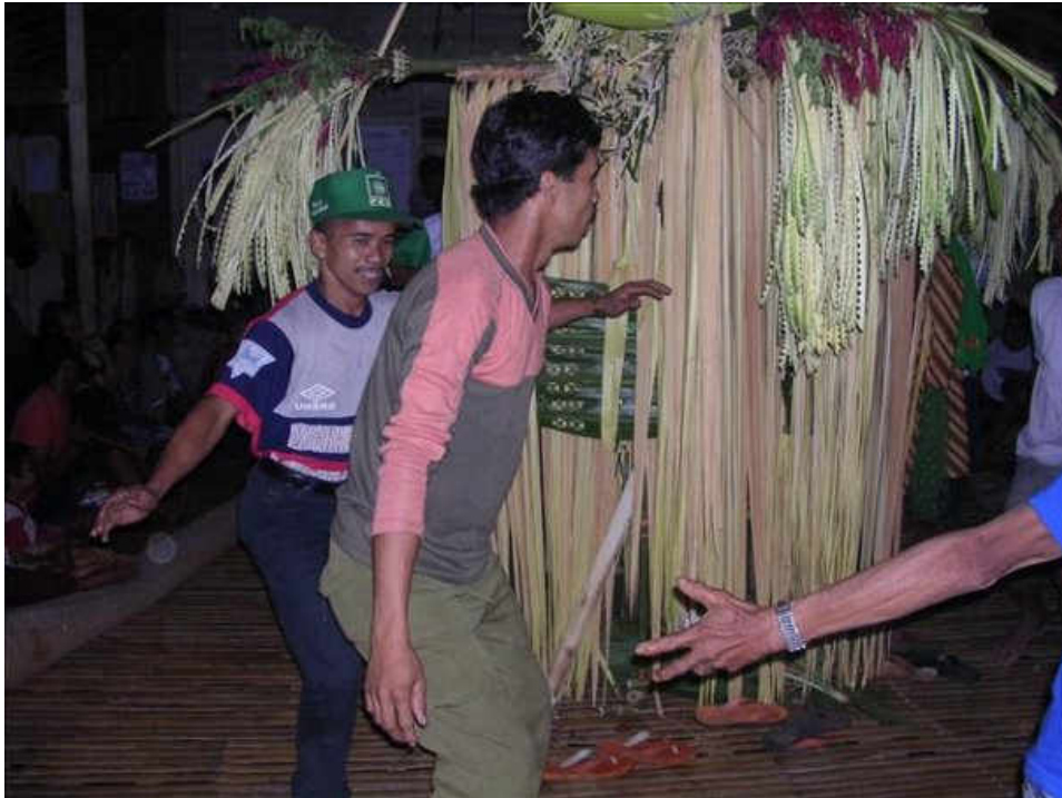
Gambar 23 Tradisi dan budaya Dayak Meratus Masyarakat Dayak ikut menari mengelilingi altar ( Batandik )