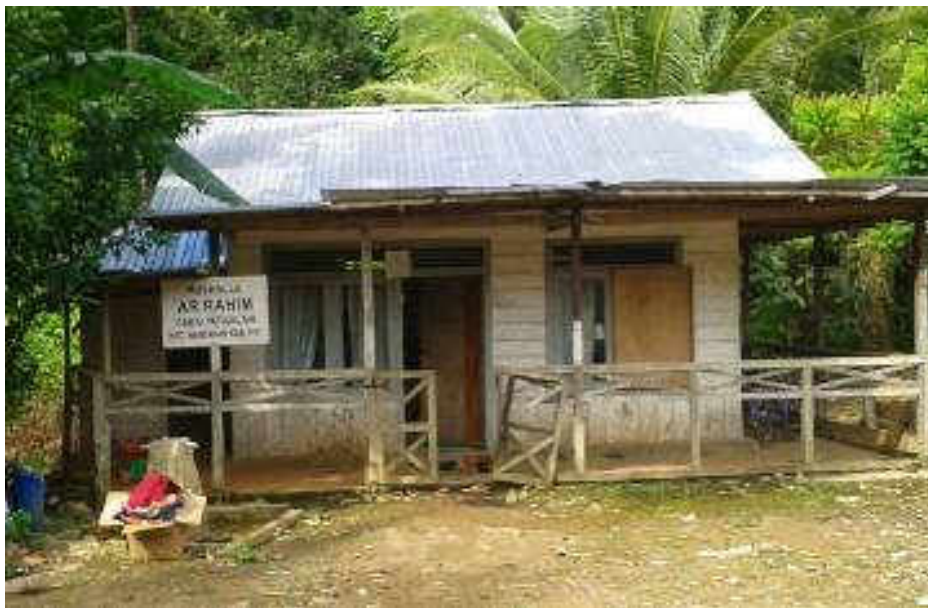
Gambar 4 Lokasi penelitian, tempat ibadah (langgar ar-Rahim) yang dijadikan sebagai tempat belajar ( Basecamp ) bagi mualaf di pegunungan Meratus