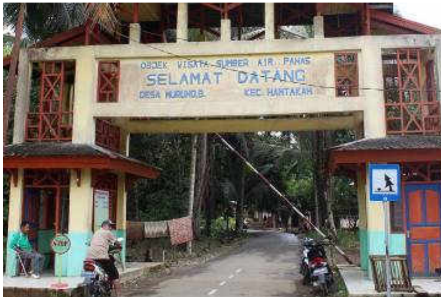
Gambar 2 Ojek wisata sumber air panas Hantakan