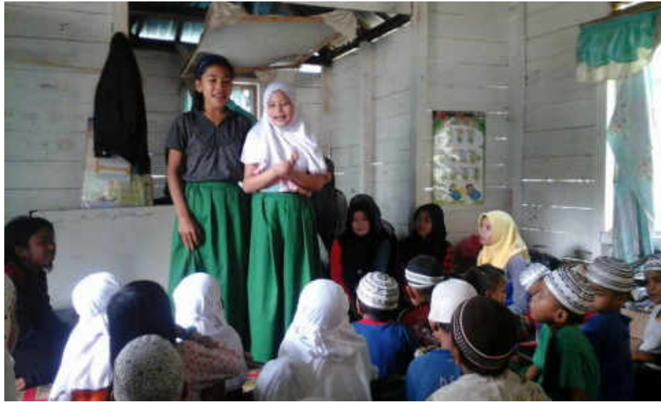
Gambar 20 Kegiatan menghafal surah-surah pendek