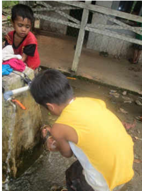
Gambar 12 Praktek tatacara berwudhu peserta didik