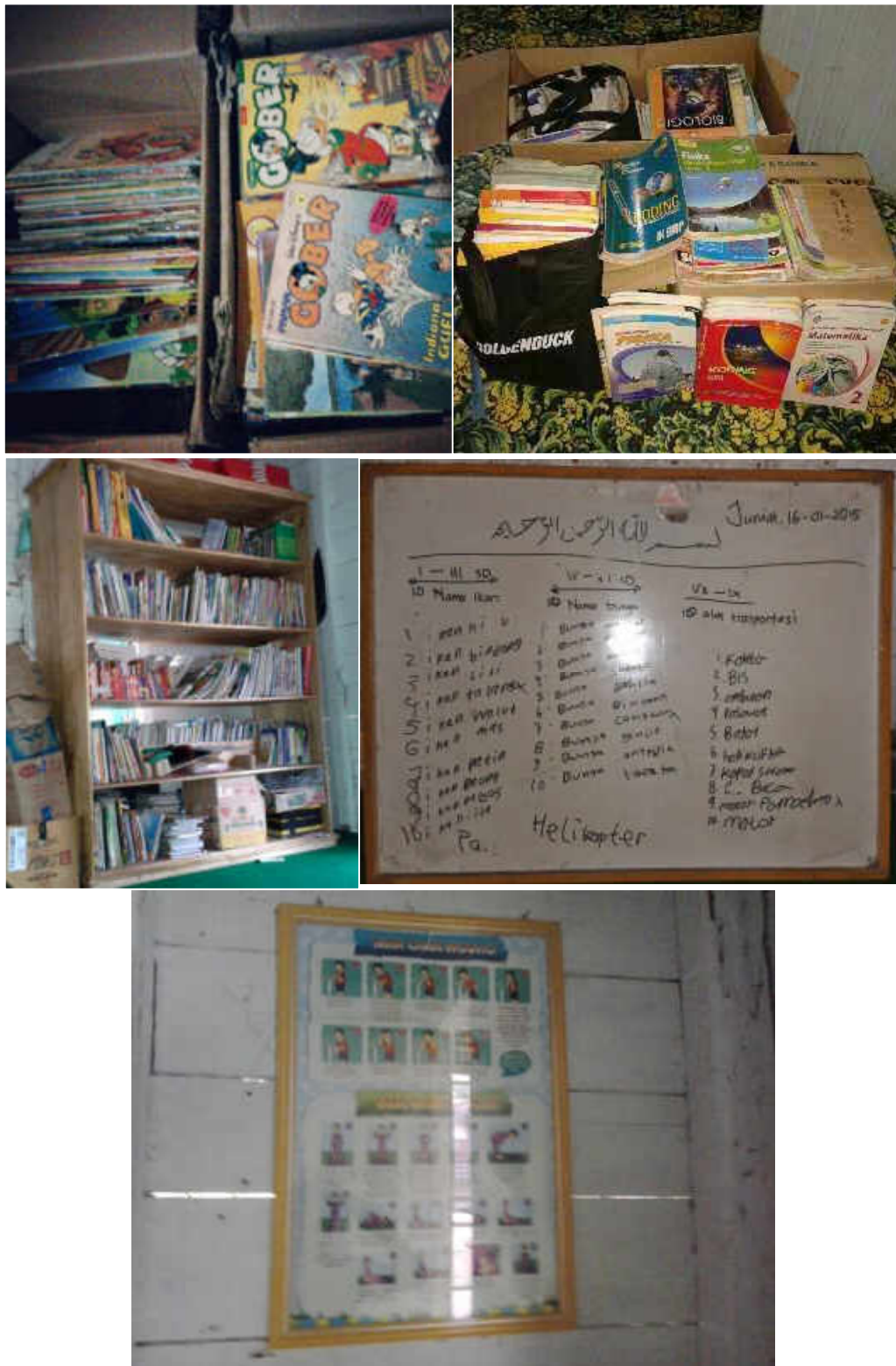
Gambar 5 Sarana dan prasarana yang dimiliki Basecamp Buku Meratus