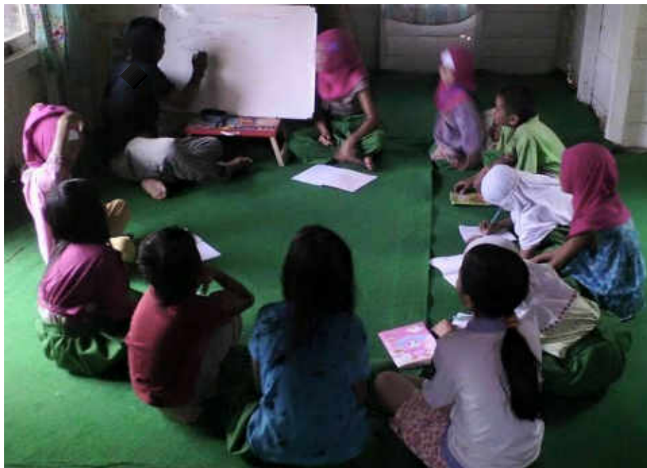
Gambar 17 Metode ceramah menggunakan alat bantu oleh Ahmad Gajali (Koordinator di Basecamp Buku Meratus)