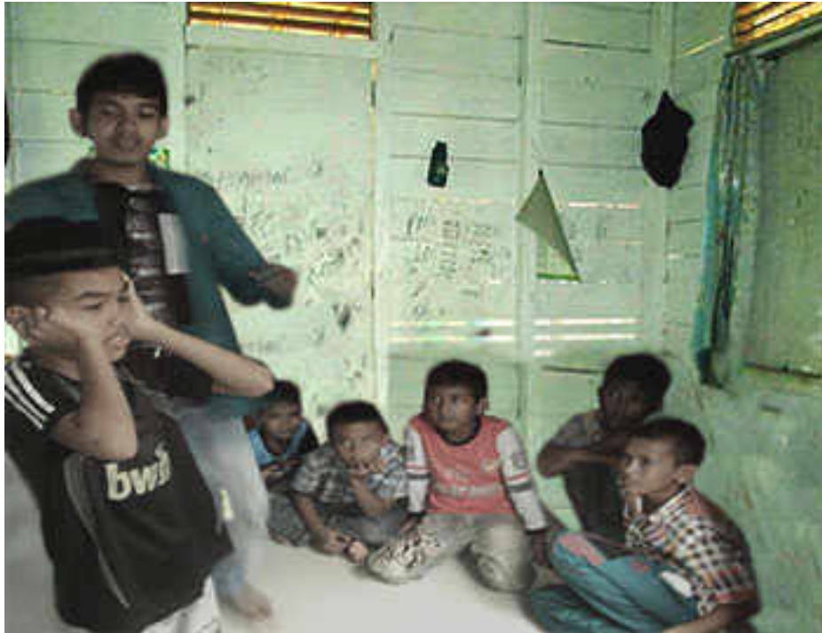
Gambar 16 Praktek azan dan iqamah