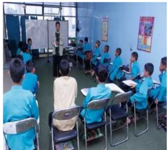
G. 13, Foto Santri di Ruang Belajar Pondok Pesantren Tahfizhul Qur'an Ahlu Shuffah

Pondok Pesantren Tahfizhul Qur'an Ahlu Shuffah Putra seluruh tenaga yang terlibat baik pendidik, tenaga kependidikan dan santrinya adalah laki-laki, begitu juga di Tahfizhul Qur'an Ahlu Shuffah Putri seluruh tenaga yang terlibat baik pendidik, tenaga kependidikan dan santrinya adalah perempuan. Program pembinaan diarahkan pada kemandirian dan tanggung jawab terhadap pengembangan kepribadian, kecerdasan, minat dan bakat. 8