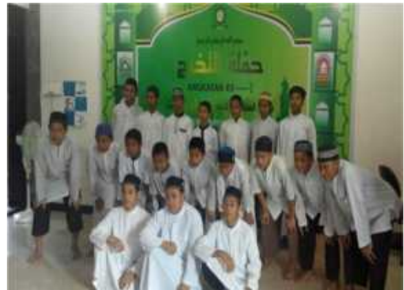
G. 29, Foto Acara Haflah At-Takhrir Ponpes Al-Mukhlisin (Acara Pelepasan Santri Tahfizh Yang Lulus)

Dampak atau hasil dari proses kegiatan pembelajaran yang diselenggarakan oleh Pondok Pesantren Tahfizhul Qur'an dan Hadits Al-Mukhlisin Balikpapan diharapkan tidak hanya membawa perubahan pada para santri atau peserta didik, melainkan lebih jauh dari pada itu. Keberadaan pondok pesantren dan para santrinya dapat memberikan pengaruh positif pada kehidupan sosial kemasyarakatan pada lingkungan dimana pondok pesantren dan para santrinya mendedikasikan keilmuannya. Dengan demikian diharapkan keberadaan pondok pesantren dan para santri maupun alumninya mampu menjadi penyeimbang antara pola kehidupan duniawi dan ukhrawi.