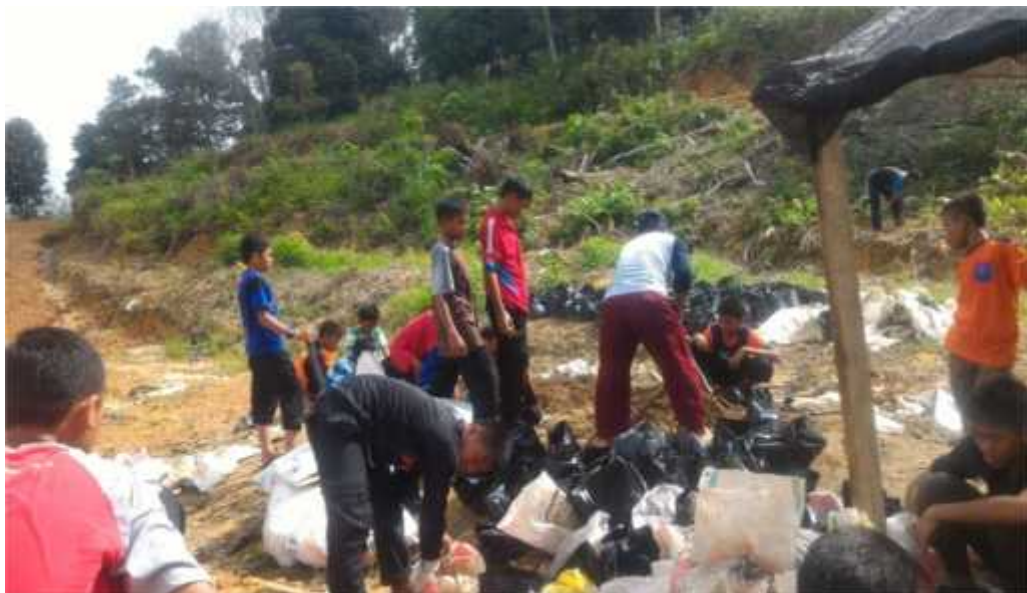
G.14, Foto Santri Tahfizhul Qur'an Ahlu Shuffah sedang Kerja Bakti di Sekitar Asrama Bersama Mudir

Tugas terakhir di asrama adalah piket konsumsi. Piket konsumsi bertugas menyiapkan makan santri di ruang makan santri. Setiap santri mendapat giliran piket konsumsi. Tugas piket dijalankan pada waktu pagi jam 6.30, pada waktu siang, ba'da shalat duhur sekitar jam 13.00 dan pada malam hari sekitar jam 20.30. Tugas-tugas yang dilakukan oleh siswa merupakan bagian dari proses pembinaan kepemimpinan siswa. Leader skill ditumbuhkan dengan membentuk kepemimpinan di setiap kamar.