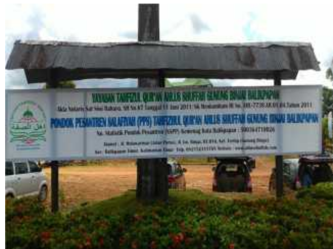
G.9, Foto Papan Nama Pondok Pesantren Tahfizhul Qur'an Ahlus Shuffah Balikpapan

Pondok Pesantren Tahfizhul Qur`an Ahlus Shuffah berada di jalur yang kurang strategis dari jalan provinsi yang menghubungkan Kota Balikpapan dengan Kota Samarinda (Ibu kota Provinsi Kalimantan Timur) dan Kutai Kartanegara. Jarak dari