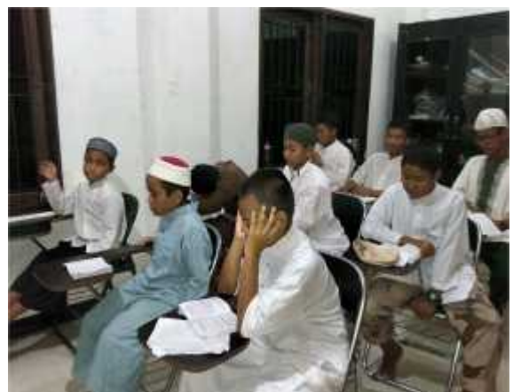
G. 30, Foto Pembinaan Santri Tahfizh Ponpes Al-Mukhlisin di Ruang Kelas

Pembinaan santri sebelum masuk ruang kelas adalah melaksanakan rutinitas apel pagi terlebih dahulu. Pembinaan dilakukan Mudîr dalam bentuk pengarahan. Materi yang disampaikan oleh mudîr adalah penguatan ulang visi dan misi pondok pesantren dan program-program