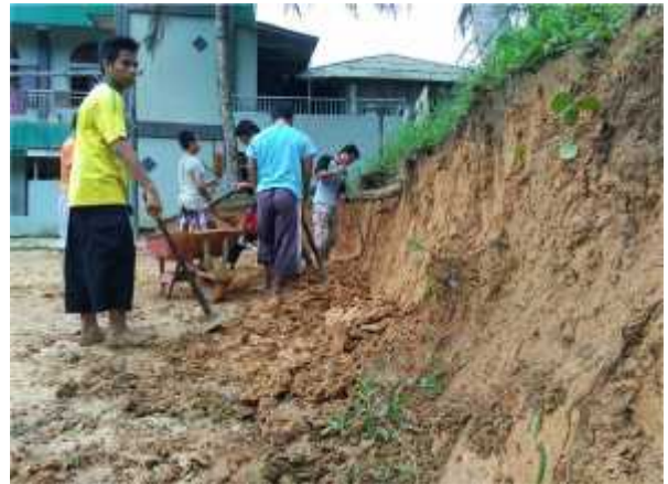
G.32, Foto Santri Tahfizh Al-Mukhlisin Sedang Kerja Bakti di Sekitar Lingkungan Asrama

Adapun kegiatan dan penjadwalan piket kebersihan kamar, pembersihan MCK dan konsumsi di kawal langsung oleh pengasuh asrama dan tentunya di bawah kepengawasan mudîr pondok pesantren. Hal ini berkaitan dengan pola kepengasuhan berdasarkan prinsip 24 jam