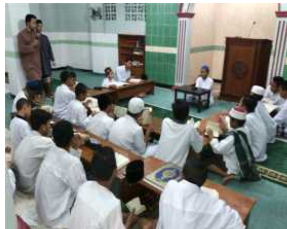
G. 33, Foto Santri Tahfizh Al-Mukhlisin Sedang Halaqah G. 34, Foto Santri Al-Mukhlisin Menyetor Hafalan Baru

Murabbi (pembimbing) halaqah yang sudah di amanahkan bertugas untuk berada di setiap halaqoh guna menemani santri murâja’ah (mengulang-ulang) hafalan Al-Qur’an dan Hadits sembari memberikan nasehat-nasehat kepada santri.