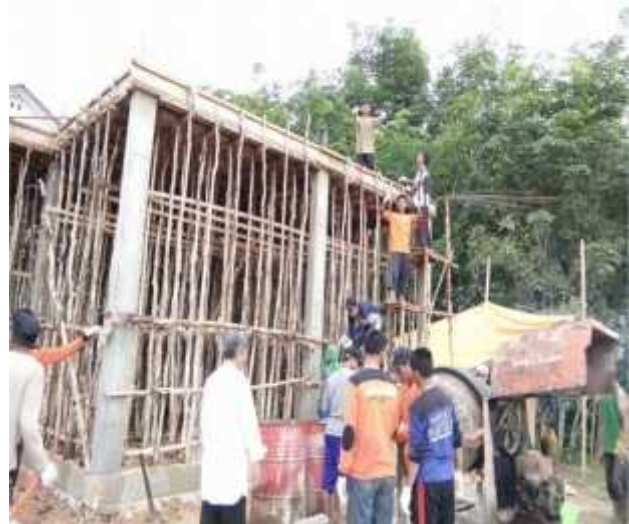
G. 18, Foto Santri Sedang Kerja Bakti Bersama Guru, Pengasuh & Pimpinan Ponpes Tahfizhul Qur'an Ahlus Shuffah .

Sedangkan kerja fisik pada hari Ahad pagi diikuti seluruh civitas pondok pesantren. Bentuk kerja bakti bermacam-macam seperti merintis kebun karet milik pesantren, mengecor bangunan, memungut sampah, membersihkan lokasi pesantren dan membersihkan