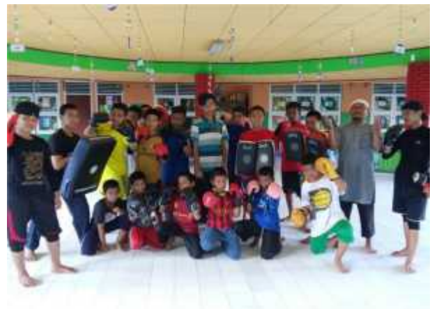
G. 22, Foto Ekstrakurikuler Bela Diri Santri Tahfiz IDC

Mudîr Pondok Pesantren Tahfizhul Qur'an Islamic Development Center (IDC) menjadikan program kerja bakti sebagai media untuk menumbuhkan sikap kepedulian santri pada lingkungan sekitar, menumbuhkan keakraban antara ustadz dan santrinya,