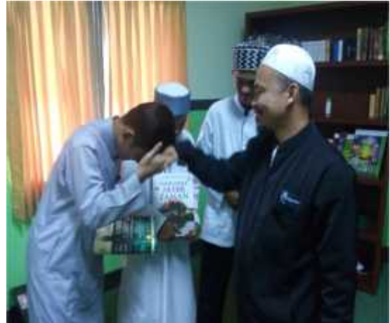
G. 23, Foto Mudir Memberikan Reward Kepada Santri yang Rajin & Berprestasi

Santri tahfizh IDC juga mendapat tugas membersihkan kamar mandi dan WC. Siswa melakukan pembersihan secara berkelompok yaitu per kamar. Hal ini disebabkan kamar mandi dan WC dibuat terpisah, tidak menyatu dengan kamar santri.