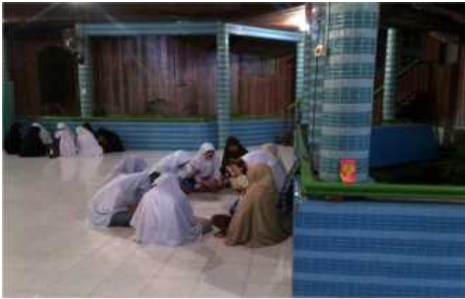
G. 16, Foto Halaqoh Santri Putri Ahlus Shuffah

kepada siswa biasanya terkait dengan motivasi dalam menuntut ilmu dan bagaimana siswa memahami makna dari ilmu yang dipelajari. 11