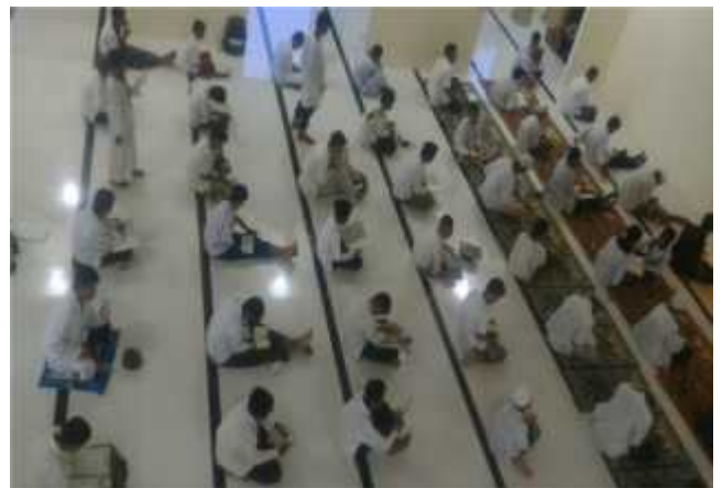
G. 12, Foto Kegiatan Santri Sedang Menyetorkan Hafalannya

Keberhasilan pondok pesantren Tahfizhul Qur'an Ahlus Suffah dalam mengembangkan program system pembelajaran sangat tergantung pada pondok pesantren yang ada, program yang dirancang oleh pimpinan pondok pesantren dan para ustadz dan