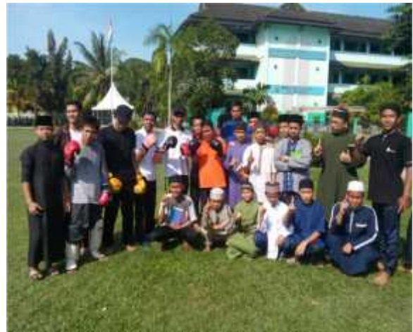
G. 20, Foto Santri Berada di Lokasi Pondok Pesantren Tahfizhul Qur`an IDC Balikpapan

Di satu sisi kondisi lingkungan ini sangat menguntungkan, karena lebih cepat dikenal dan diketahui keberadaannya oleh masyarakat. Akan tetapi disisi lain juga menjadi tantangan berat bagi mudîr selaku pemimpin Pondok Pesantren Tahfizhul Qur`an Islamic Development Center