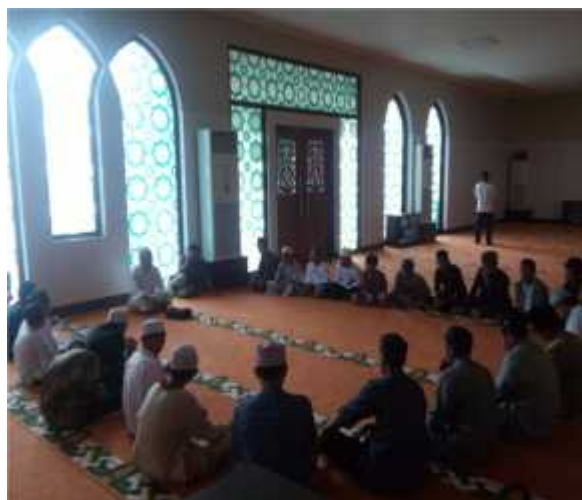
G. 21, Foto Santri Berhalaqoh Bersama Mudîr Pondok Pesantren Tahfizhul Qur'an IDC

Ketiga adalah kegiatan taklim. Selain di adakan taklim malam ba'da shalat maghrib yang sudah terjadwalkan, di Masjid Istiqomah sendiri sering mengadakan acara Tabligh Akbar, pelatihan dan seminar keagamaan. Kegiatan taklim berbentuk ceramah atau tausiyah agama satu arah dari pembicara kepada jamaah. Taklim disampaikan oleh para guru, ustadz-ustadz yang terjadwalkan, dan tokoh-tokoh agama yang ada di kota Balikpapan. Para santri Tahfizhul Qur'an IDC selalu diikuti sertakan dalam kegiatan taklim malam.