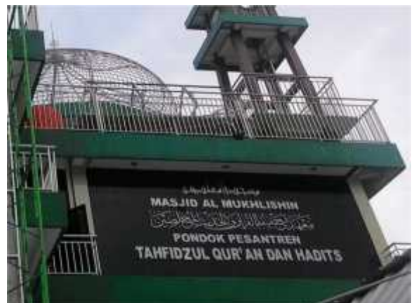
G. 27, Foto Papan Nama Pondok Pesantren Tahfizhul Qur'an dan Hadits Al-Mukhlisin Balikpapan