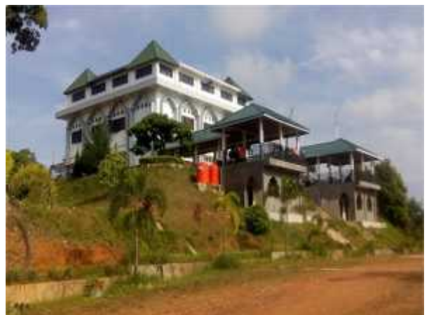
G.8, Foto Bangunan Pondok Pesantren Tahfizhul Qur'an Ahlus Shuffah Balikpapan

Namun, pada saat ini keberadaan pondok pesantren sudah berbeda dengan pandangan atau paradigma di masa lalu, sebab pondok pesantren sekarang ini bukan lagi merupakan lembaga yang tertutup, tetapi sudah menjadi lembaga yang terbuka bagi lingkungannya, bahkan pada saat ini sudah banyak pondok pesantren yang dikelola secara modern.