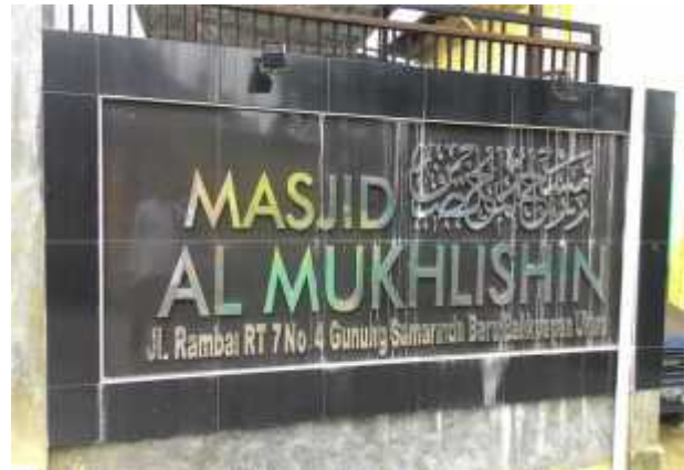
G. 28, Foto Papan Nama Masjid Al-Mukhlisin