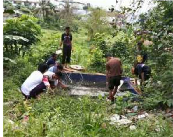
G. 31, Foto Pembinaan Santri Tahfizh Al-Mukhlisin di Lapangan Melalui Pembibitan & Pembesaran Ikan Lele

Sedangkan untuk kebersihan masjid dan ruang belajar serta pembibitan dan pembesaran ikan lele di lakukan secara rutin pada sore hari yang di kerjakan oleh santri dan didampingi oleh pengasuhnya. Pembibitan dan pembesaran ikan lele ini sangat