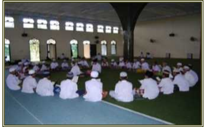
G. 17, Foto Halaqoh Santri Putra Ahlus Shuffah

Ketiga adalah kegiatan ta'lim (pengajian) malam Sabtu dan Ahad. Kegiatan ta'lim berbentuk ceramah satu arah dari pembicara kepada jamaah. Taklim disampaikan oleh para ustadz, mudîr dan pembina/pembimbing yang ada dipondok pesantren. Bahkan apabila ada tamu penting dari tokoh masyarakat yang datang ke pondok pesantren di perkenankan untuk mengisi mimbar. Para santri diikuti sertakan dalam kegiatan ta'lim bertujuan untuk menambah pengetahuan dan pemahaman tentang nilai-nilai keislaman, nilai kebenaran dan moral.