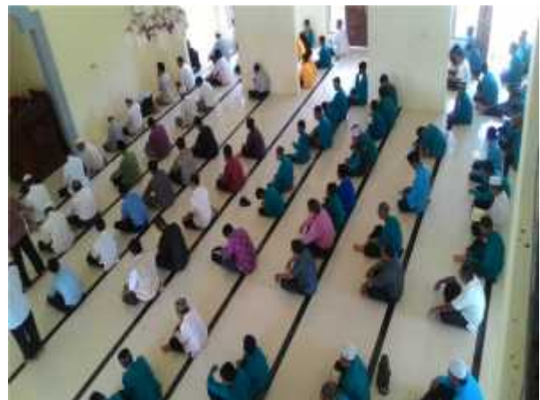
G. 15, Foto Santri Tahfizhul Qur'an Ahlus Shuffah Sedang Menunggu Waktu Sholat Di Masjid

Menurut AW Waka kesiswaan, untuk mengontrol kehadiran siswa dibentuk petugas piket yang terdiri dari dua orang santri masing-masing dari santri