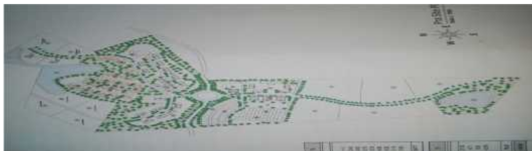
G. 10, Foto Denah Peta Gambaran Umum Penguasaan Tanah Pondok Pesantren Tahfizhul Qur'an Ahlus Shuffah Balikpapan Tahun 2013