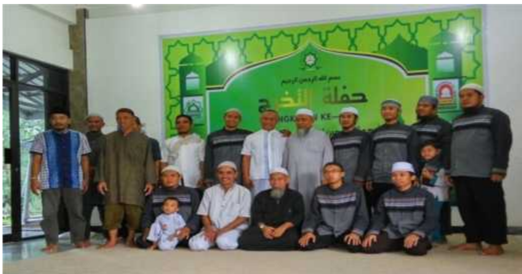
G. 35, Foto Pengurus Pondok Pesantren Tahfizhul Qur'an dan Hadits Al-Mukhlishin Balikpapan

Dengan demikian, peranan guru sebagai ujung tombak pendidikan amatlah penting. Karena guru menduduki posisi penting bagi terciptanya proses pembelajaran yang berkualitas. Sebuah pendidikan yang bermutu akan tercipta jika guru-guru tersebut profesional, salah satu kriteria profesional adalah sesuai dengan latar belakang pendidikannya.