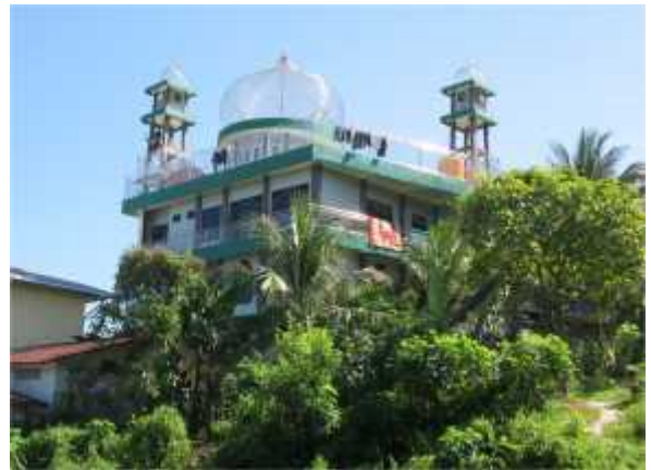
G. 26, Foto Area Pondok Pesantren Tahfizhul Qur'an dan Hadits Al-Mukhlisin Balikpapan

Untuk mewujudkan itu semua, Pondok pesantren Tahfizhul Qur'an dan Hadits Al- Mukhlisin Balikpapan ini menerapkan konsep pendidikan Islam terpadu, sedangkan proses kegiatan belajar mengajar sehari-hari dijalankan dengan pola kepengasuhan berdasarkan prinsip "24 jam mengasuh dengan hati dan keteladanan". Semua itu diterapkan dalam kegiatan yang terencana, terprogram, terarah, bervariasi dan didukung oleh tenaga yang kompeten serta dikelola secara profesional. 37