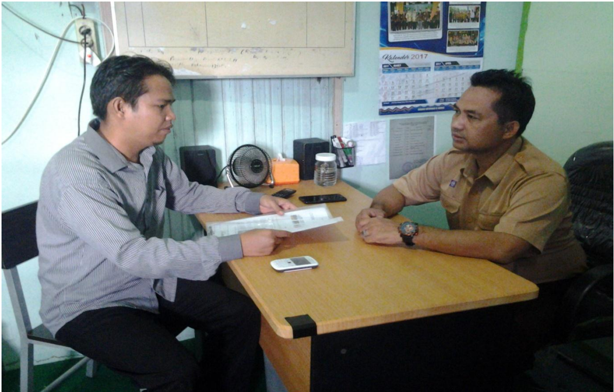
FOTO-FOTO DOKUMENTASI KEGIATAN DI MTSN SUNGAI TABUK