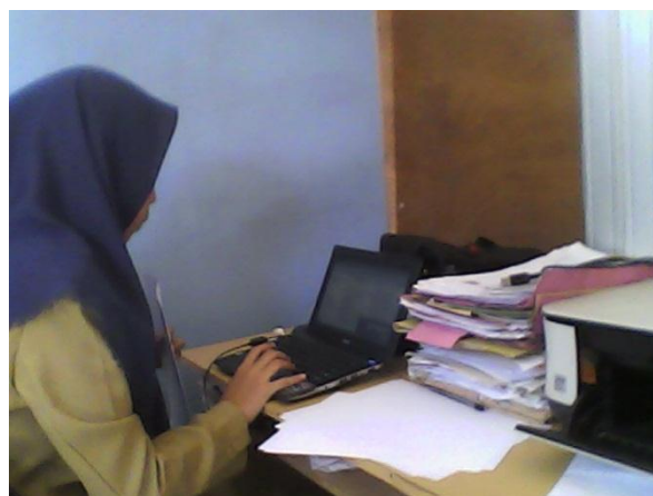
Wawancara Dengan Pegawai TU