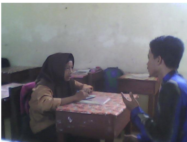
Wawancara Dengan Siswa Kelas VIII