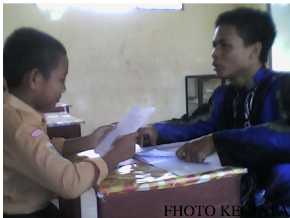
Wawancara Dengan Siswa Kelas VII