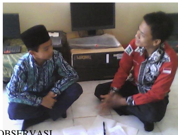
FOTO KEGIATAN OBSERVASI