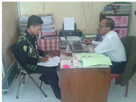
Wawancara Dengan Guru Quran Hadits