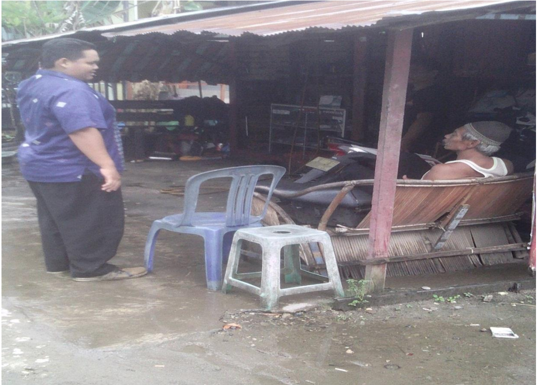
Berfto dengan masyarakat Bina Brata