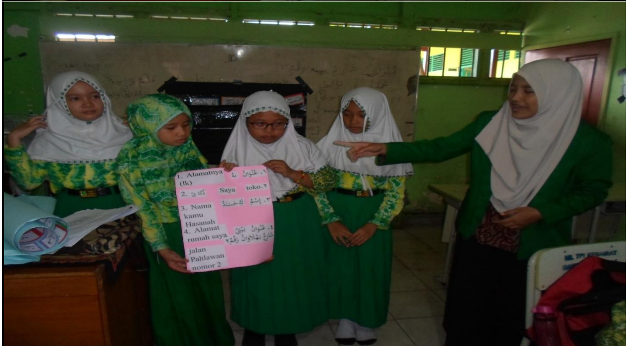
(Pertemuan 3) Kegiatan di kelas eksperimen (kelas IV D) saat siswa mempresentasikan soal evaluasi yang telah dikerjakan secara berkelompok (Kamis, 26 Januari 2017, 11.30-11.40 WITA)