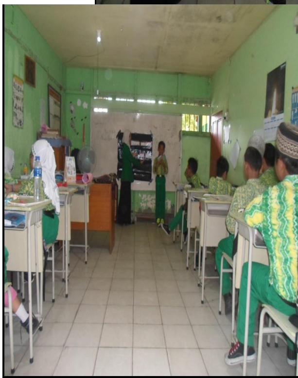
(Pertemuan 3) Kegiatan kelas eksperimen (kelas IV D) saat siswa maju ke depan menjawab pertanyaan guru tentang materi Tarkib dengan Menggunakan Media Strip Story (Kamis, 26 Januari 2017, 11.00-11.10 WITA)