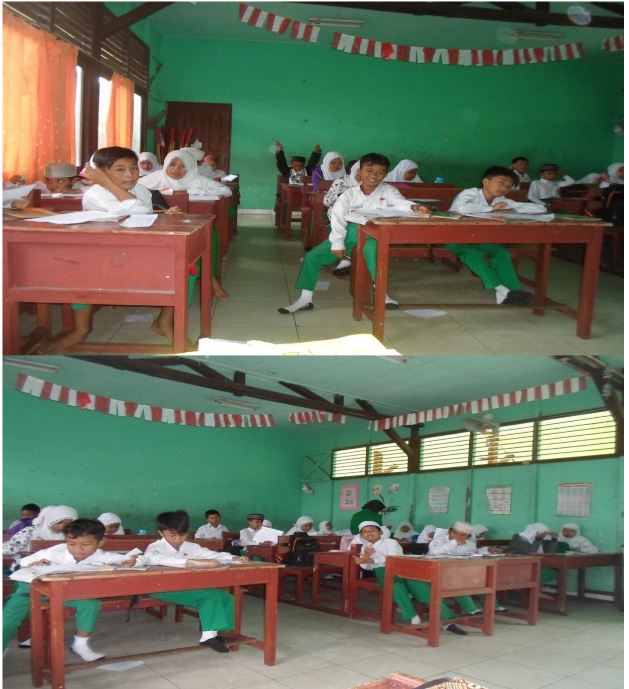
Siswa kelas IV A MI TPI Keramat mengerjakan soal posttest terkait materi tentang العُنْوَان yang sudah dipelajari (Senin, 23 Januari 2017, 09.15-09.45 WITA)