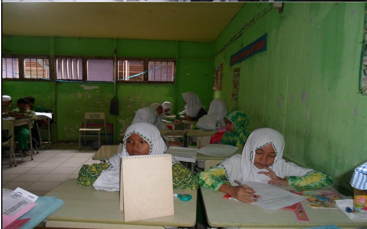
Siswa kelas IV D MI TPI Keramat mengerjakan soal posttest terkait tentang العُنْوَانُ yang sudah dipelajari (Kamis, 26 Januari 2017, 11.45-12.15 WITA)