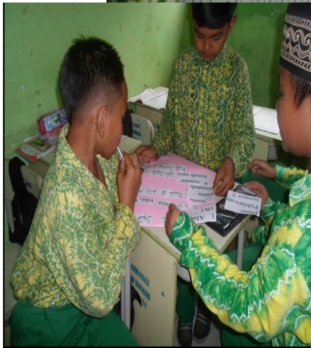
(Pertemuan 3) Kegiatan di kelas eksperimen (kelas IV D) saat siswa mengerjakan soal evaluasi secara berkelompok tentang materi Tarkib (Kamis, 26 Januari 2017, 11.10-11.30 WITA)