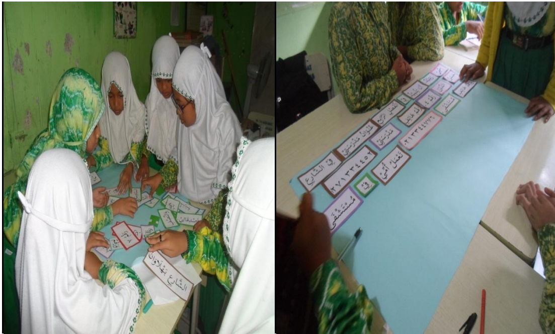
(Pertemuan 2) Kegiatan di kelas eksperimen (kelas IV D) saat siswa mengerjakan soal evaluasi secara berkelompok terkait materi Qira'ah tentang العُنُونُ dengan menggunakan media strip story (Kamis, 19 Januari 2017, 11.15-11.40 WITA)