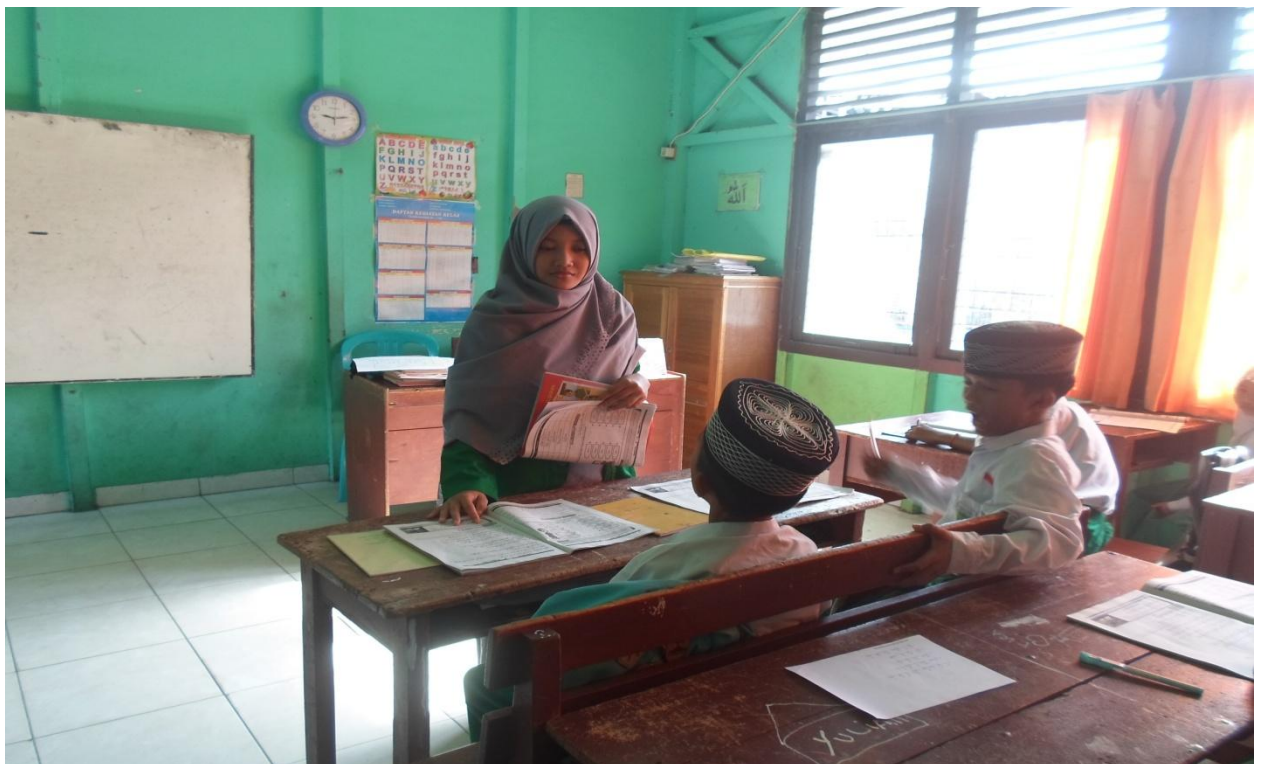
(Pertemuan 2) Kegiatan di kelas kontrol (kelas IV A) saat siswa membaca secara bergantian terkait materi Qira'ah tentang العُنُون (Senin, 16 Januari 2017, 09.00-09.15 WITA)