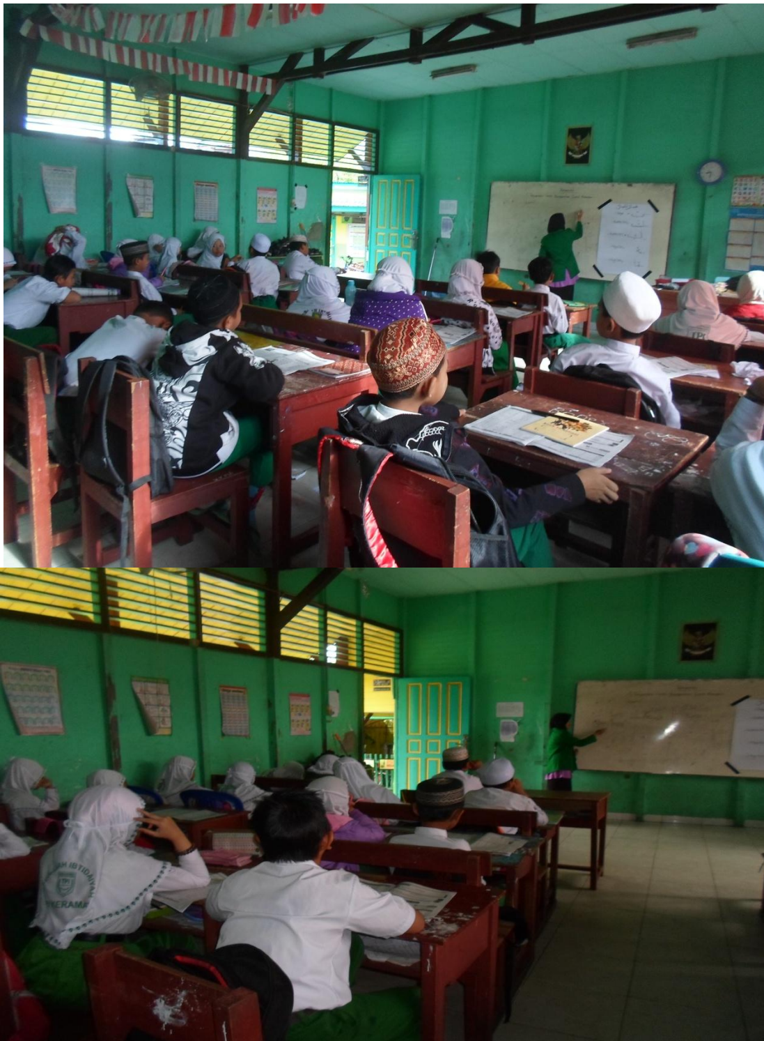
(Pertemuan 3) Kegiatan di kelas kontrol (kelas IV A) saat peneliti yang bertindak sebagai guru menjelaskan tentang materi Tarkib (Senin, 23 Januari 2017, 08.30-09.00 WITA)