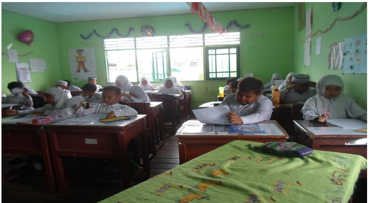
Siswa kelas IV B MI TPI Keramat mengerjakan soal pretest yang sudah di uji validitas dan reliabilitas (Selasa, 10 Januari 2017, 10.30-11.00 WITA)