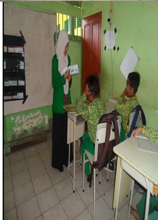
(Pertemuan 3) Kegiatan di kelas eksperimen (kelas IV D) saat peneliti yang bertindak sebagai guru menjelaskan guru tentang materi Tarkib dengan Menggunakan Media Strip Story (Kamis, 26 Januari 2017, 10.30-11.00 WITA)