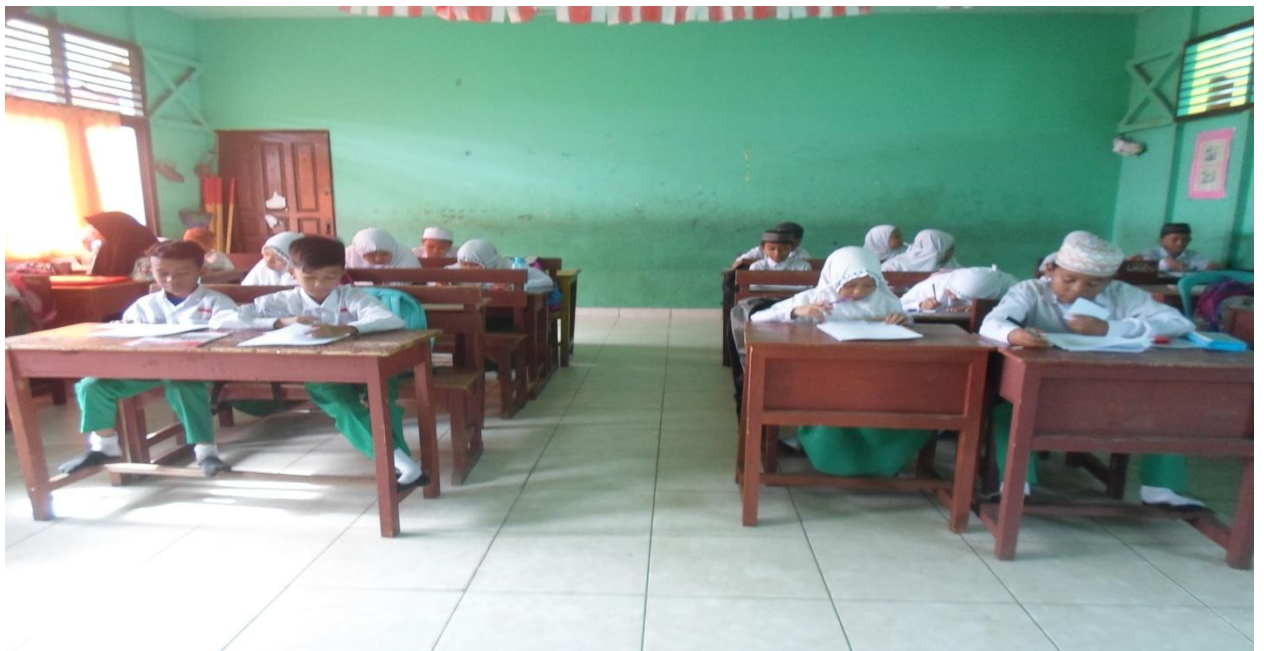
Siswa kelas IV A MI TPI Keramat mengerjakan soal pretest yang sudah di uji validitas dan reliabilitas (Senin, 9 Januari 2017, 08.30-09.00 WITA)