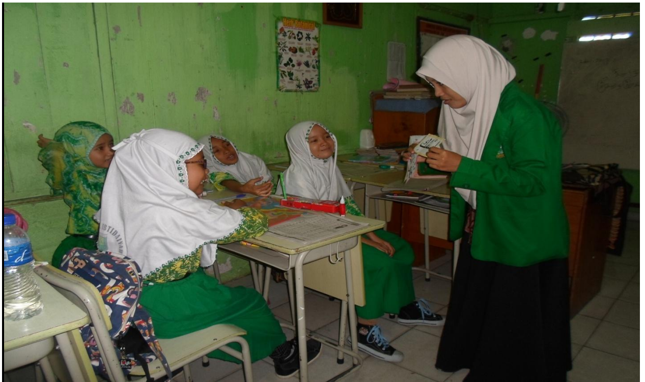
(Pertemuan 3) Kegiatan kelas eksperimen (kelas IV D) saat siswa menjawab pertanyaan guru tentang materi Tarkib secara lisan dengan Menggunakan Media Strip Story (Kamis, 26 Januari 2017, 11.00-11.10 WITA)