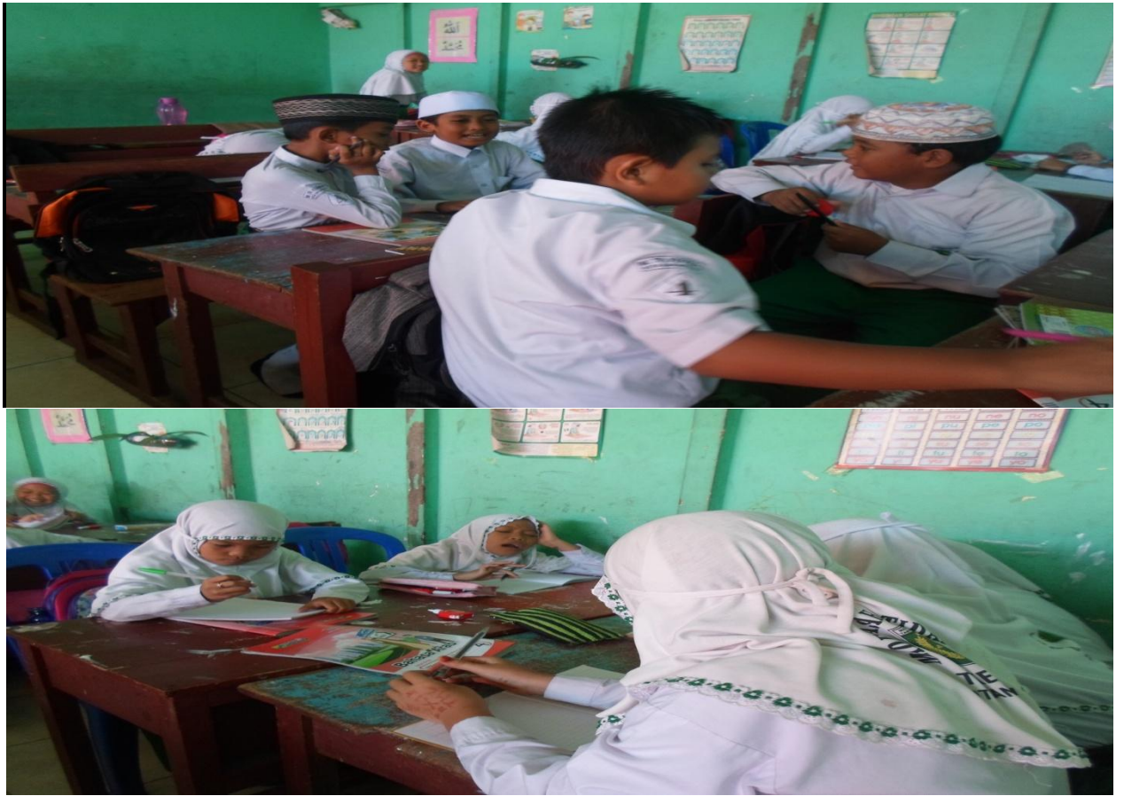
(Pertemuan 2) Kegiatan di kelas kontrol (kelas IV A) saat siswa mengerjakan soal evaluasi secara berkelompok terkait materi Qira'ah tentang العُنْوَانُ (Senin, 16 Januari 2017, 09.15-09.45 WITA)