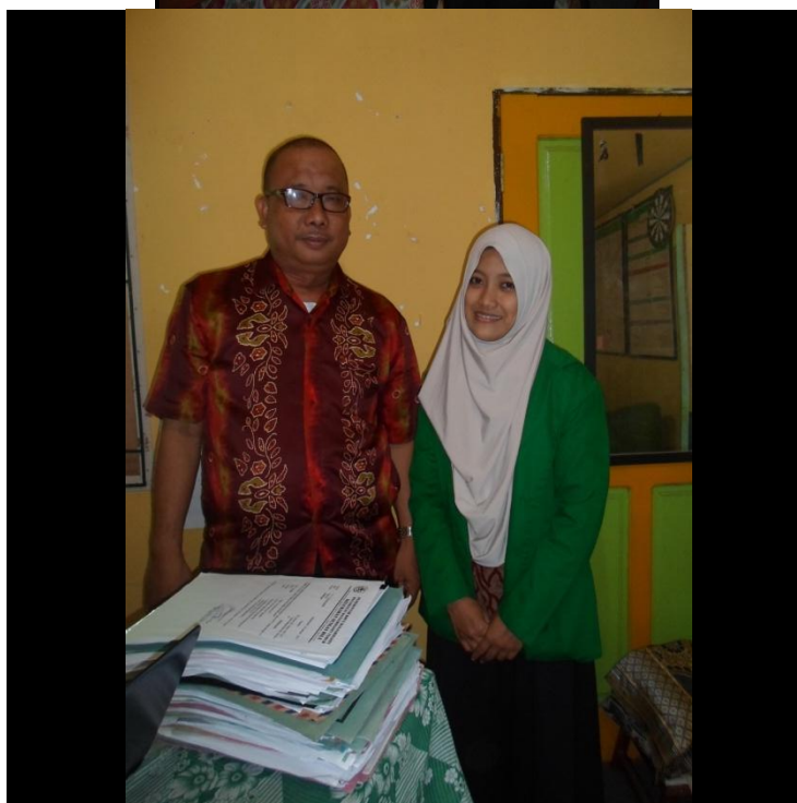
Foto Wawancara dengan Kepala Sekolah MI TPI Keramat