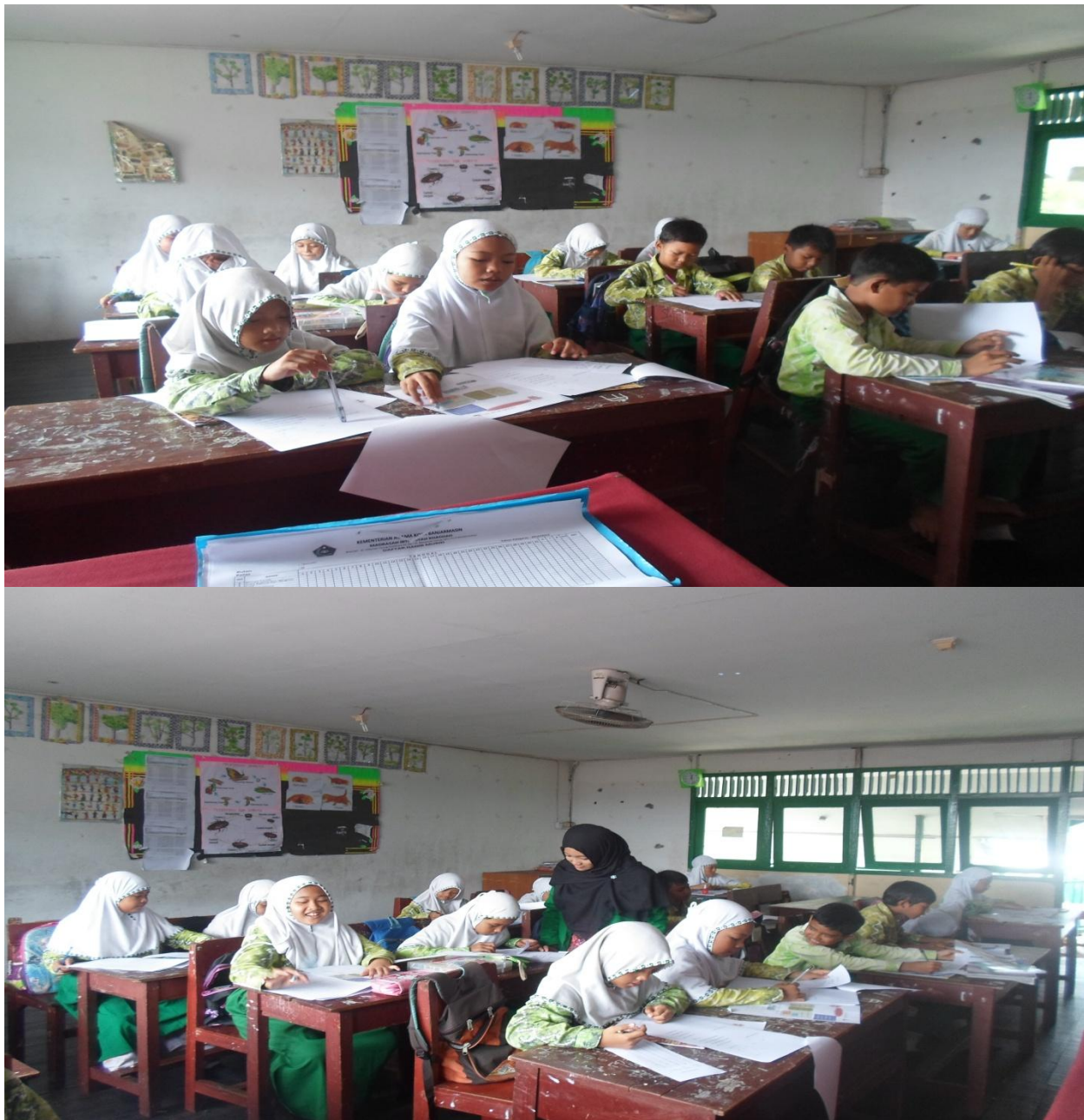
Siswa kelas IV MI Khadijah sedang mengerjakan soal sebelum uji validitas dan reliabilitas (Kamis, 5 Januari 2017, 12.00-13.00 WITA)