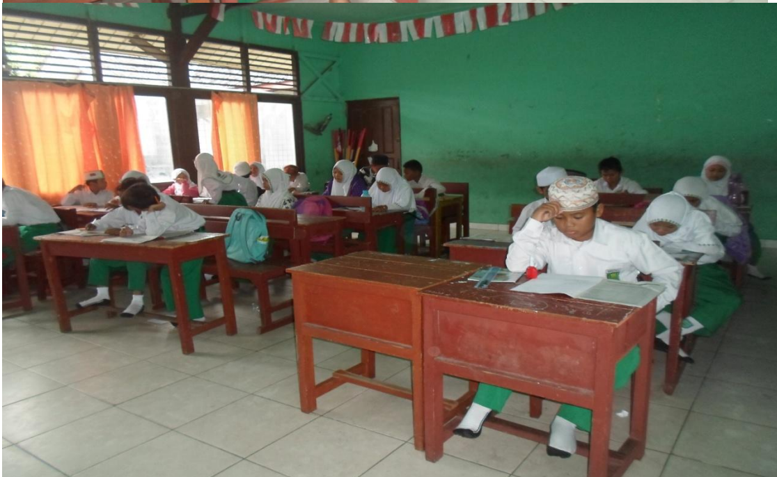
(Pertemuan 3) Kegiatan di kelas kontrol (kelas IV A) saat siswa mengerjakan soal evaluasi secara individu tentang materi Tarkib (Senin, 23 Januari 2017, 09.05-09.15 WITA)