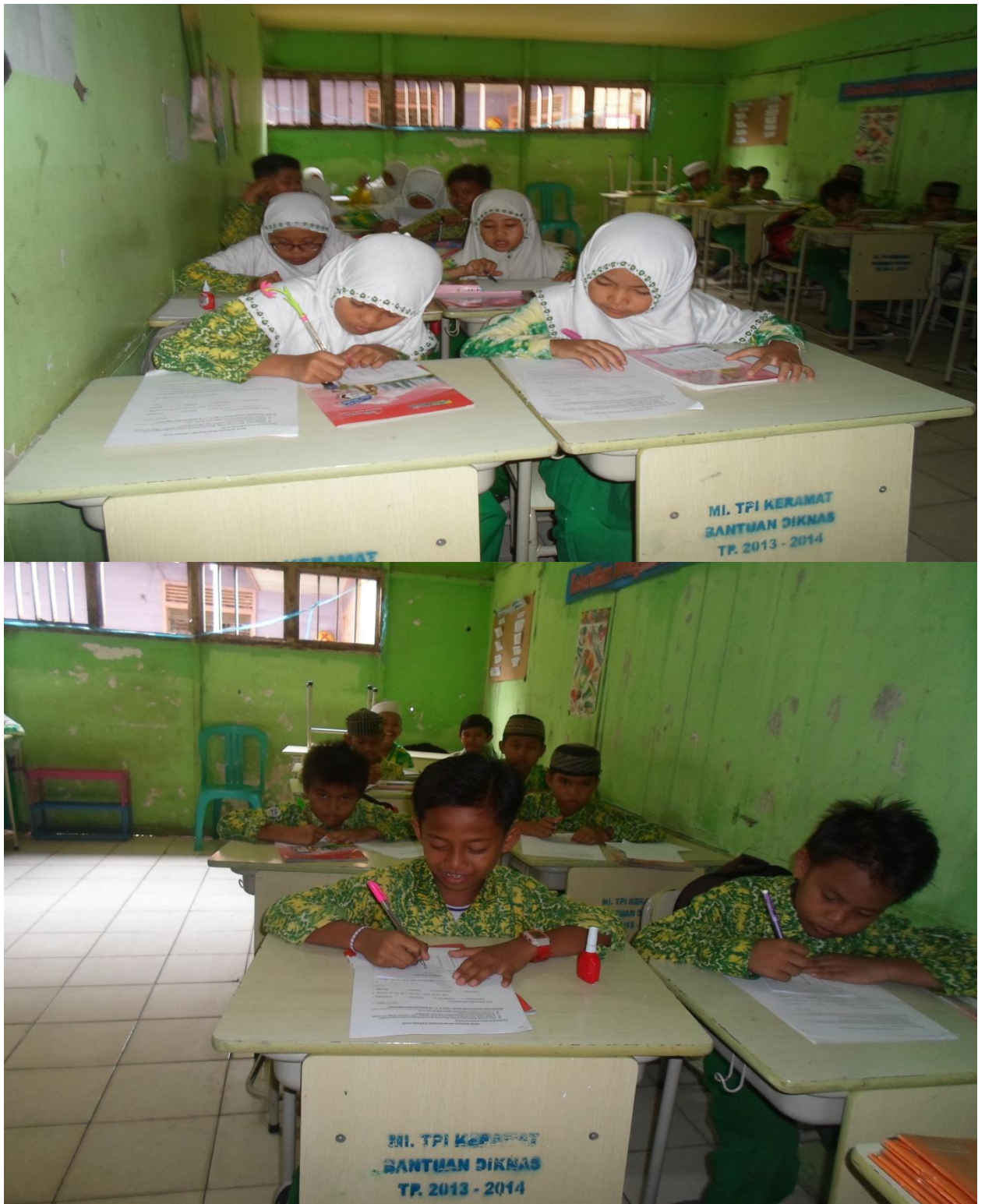
Siswa kelas IV D MI TPI Keramat mengerjakan soal pretest yang sudah di uji validitas dan reliabilitas (Kamis, 12 Januari 2017, 10.30-12.00 WITA)