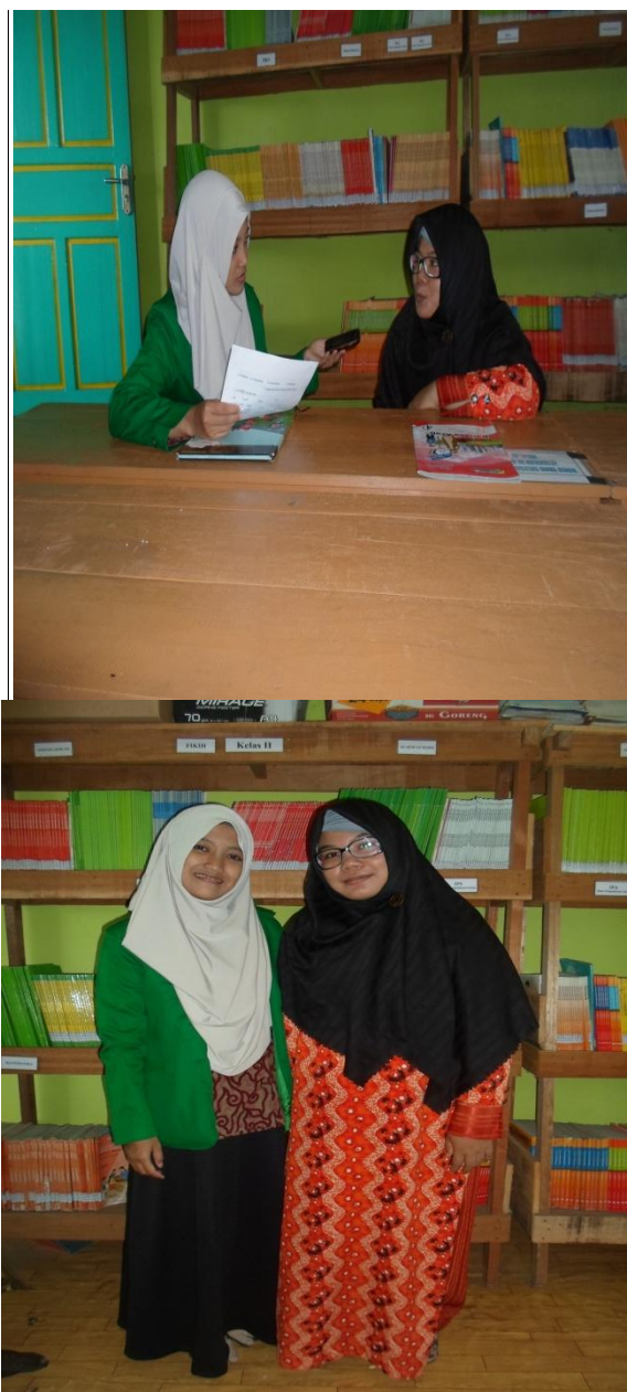
Foto Wawancara dengan Guru Mata Pelajaran Bahasa Arab MI TPI Keramat