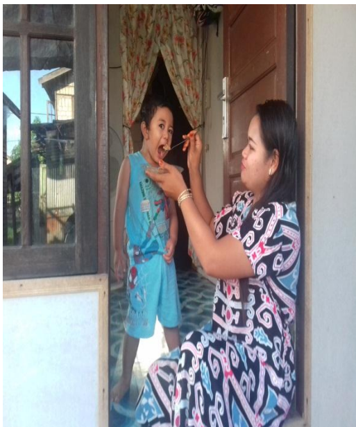
Ibu Tiara yang Bekerja Sebagai Pengasuh Memiliki Toko Anak.