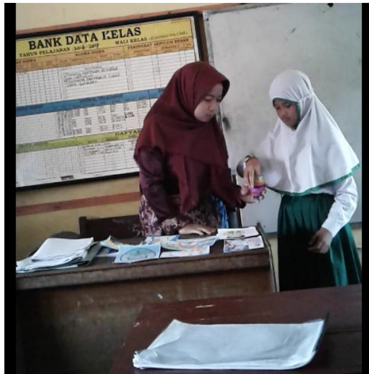
Saat “tamu misteri” mengambil mufradat yang telah disediakan guru