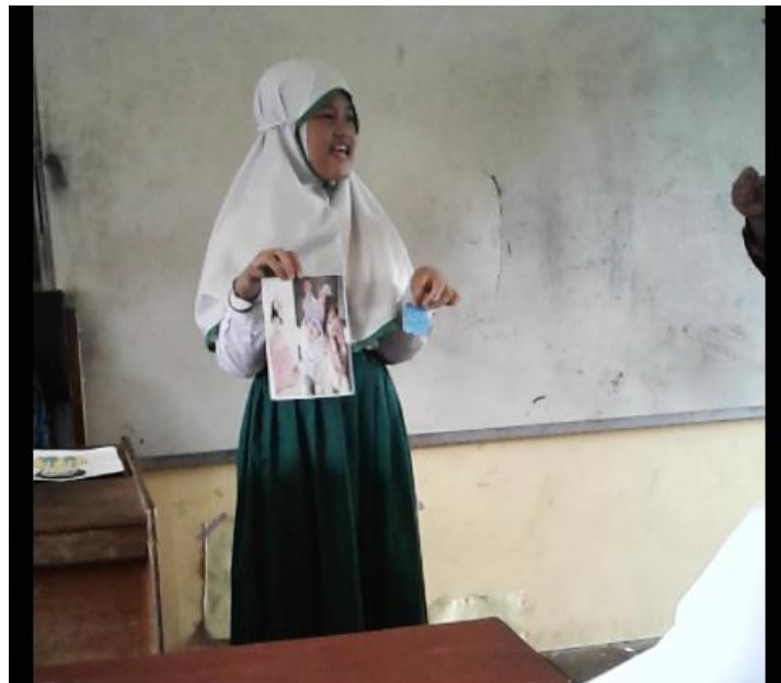
Saat siswa menjadi “tamu misteri” dan menyebutkan ciri-cirinya dari mufradat dengan menggunakan media gambar