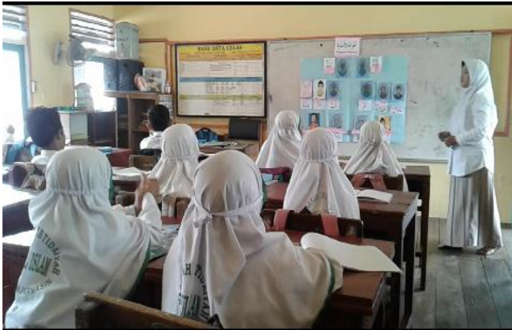
Ketika guru melatih pelafalan mufradat dengan menggunakan media gambar