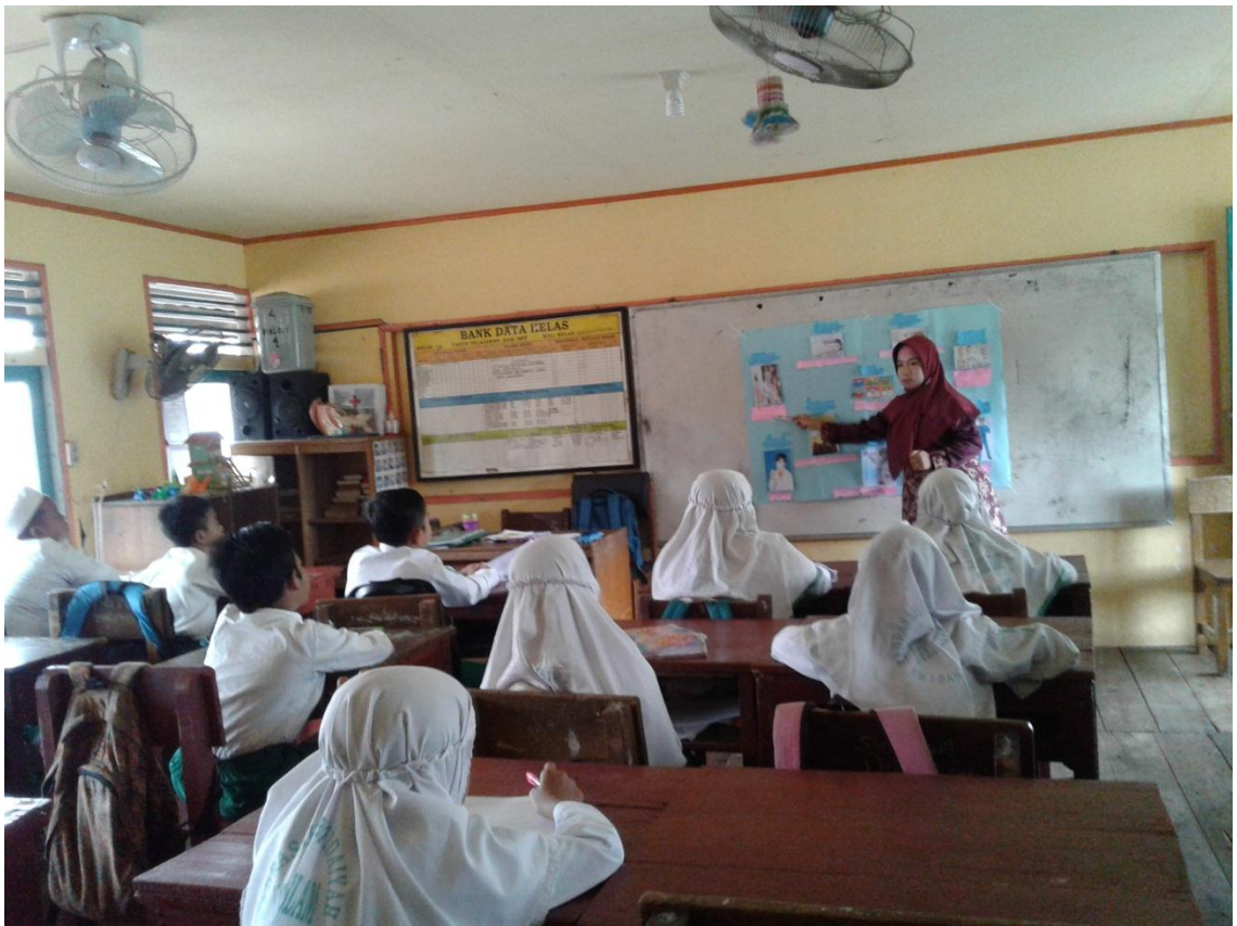
Ketika guru menunjuk media gambar, siswa yang melafalkan mufradat