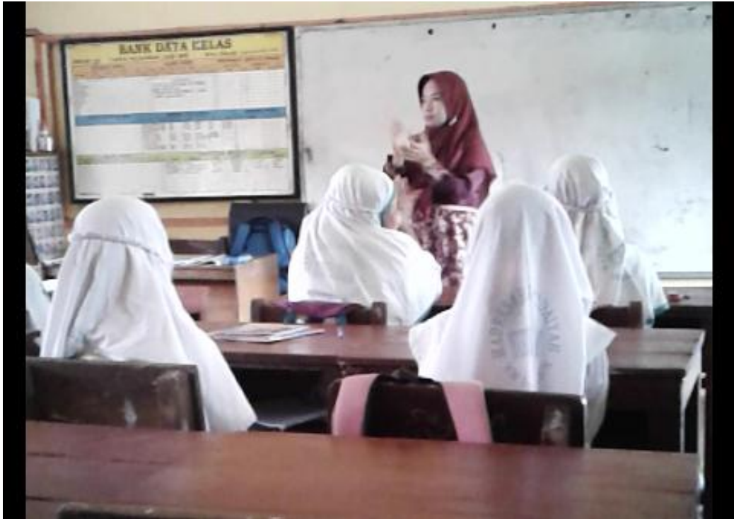
Saat guru memotivasi siswa dengan bernyanyi bersama “tebuk MI””