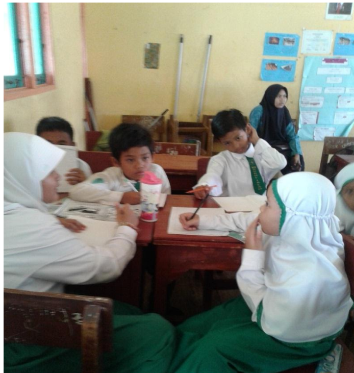
Ketika setiap kelompok menentukan siapa yang akan jadi “tamu misteri”