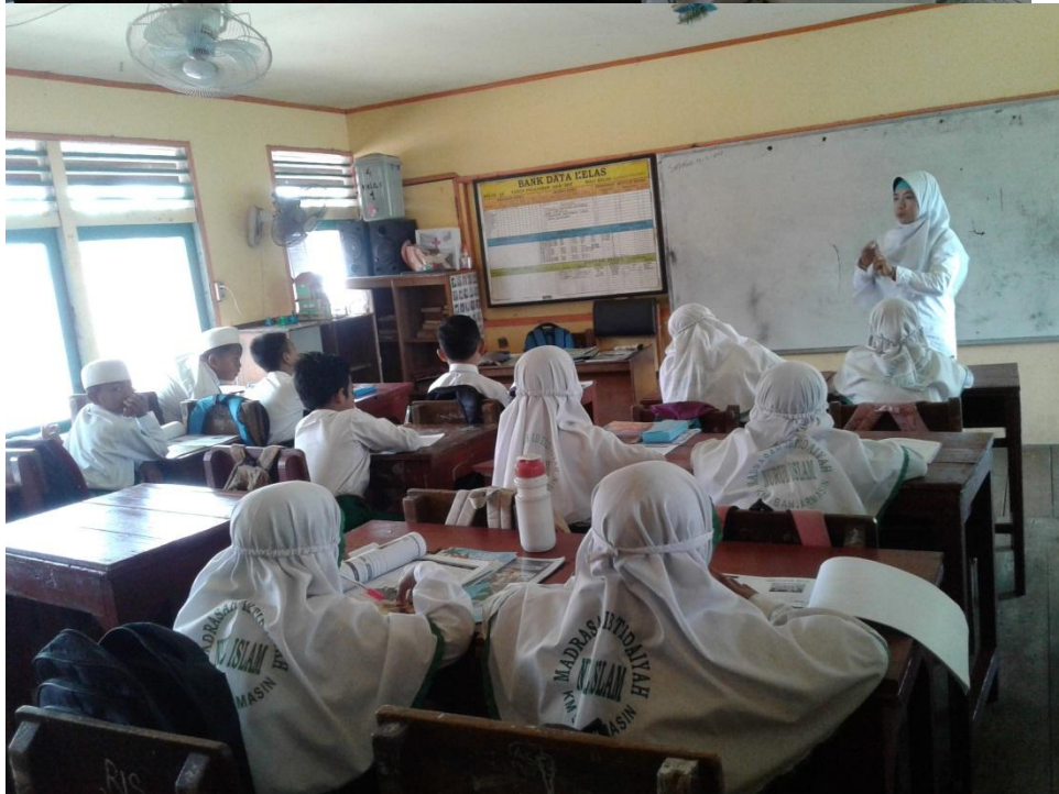
Guru Menyampaikan tujuan pembelajaran