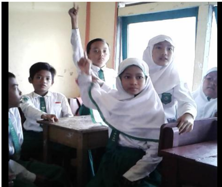
Saat kelompok lain mengangkat tangan berlomba-lomba menebak mufradat