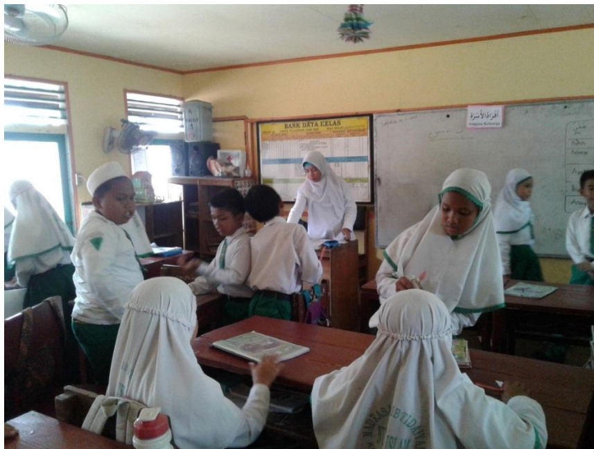
Guru membagi siswa beberapa kelompok