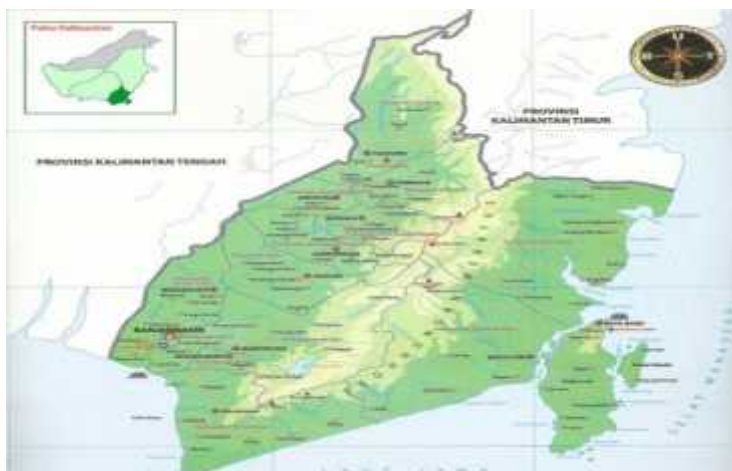
Gambar 1. Peta Kalimantan Selatan