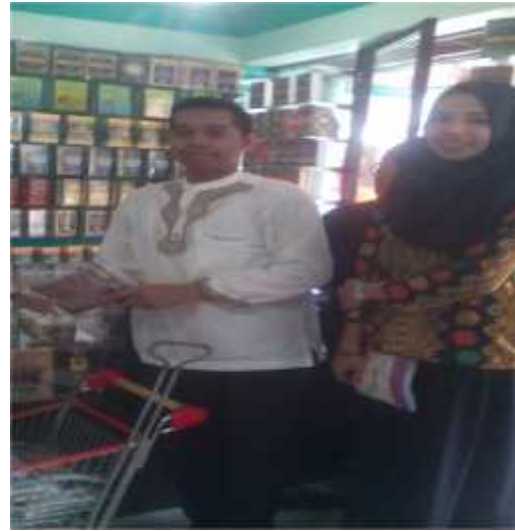
Wawancara dengan pedagang buku di pasar Sudimampir