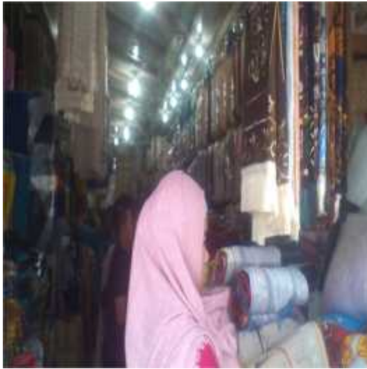
Pedagang karpet di pasar Sudimampir