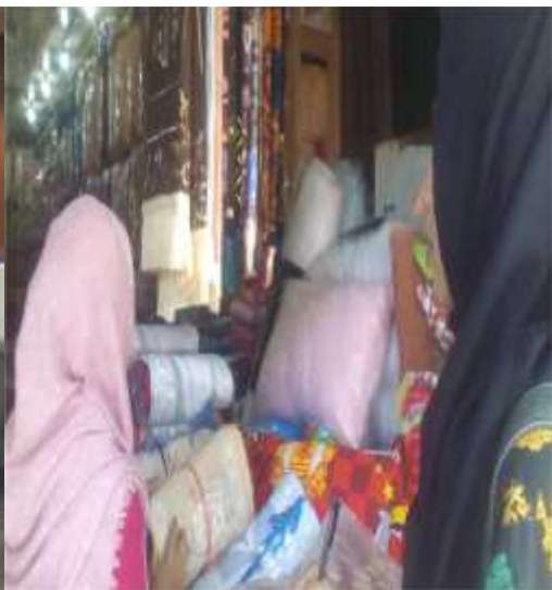
Wawancara dengan pedagang karpét di pasar Sudimampir