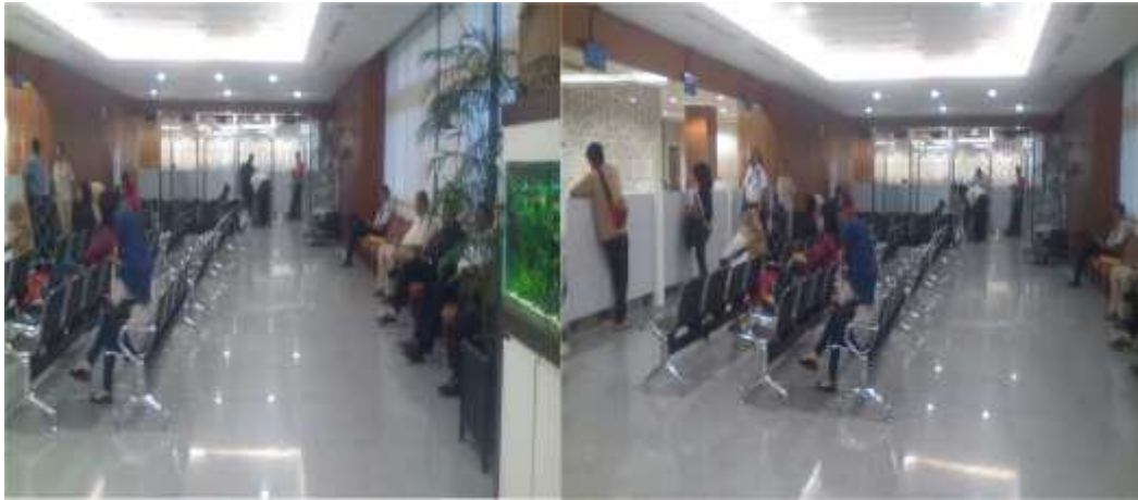
Loket penukaran di Kantor Perwakilan Bank Indonesia Provinsi Kalimantan Selatan