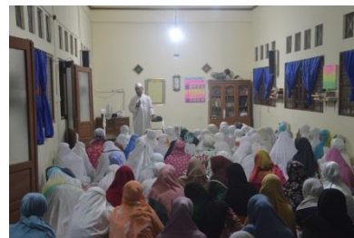
Pengajian dan ceramah malam Rabu