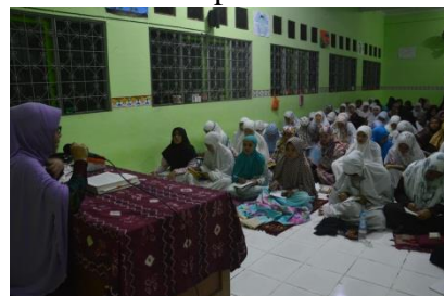
Pengajian dan ceramah malam Rabu