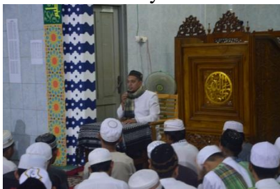
Pengajian dan ceramah malam Rabu