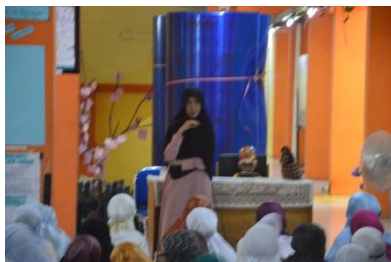
Pengajian dan ceramah malam Rabu