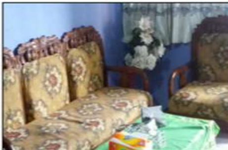
Meja Kursi Tamu