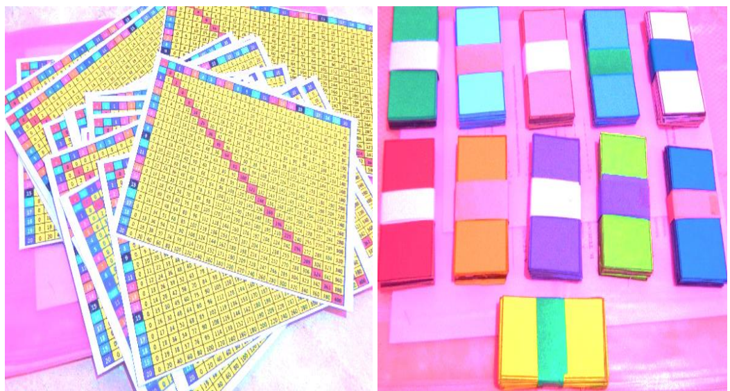
Gambar 4.3 Tabel Perkalian dan Kartu Pecahan