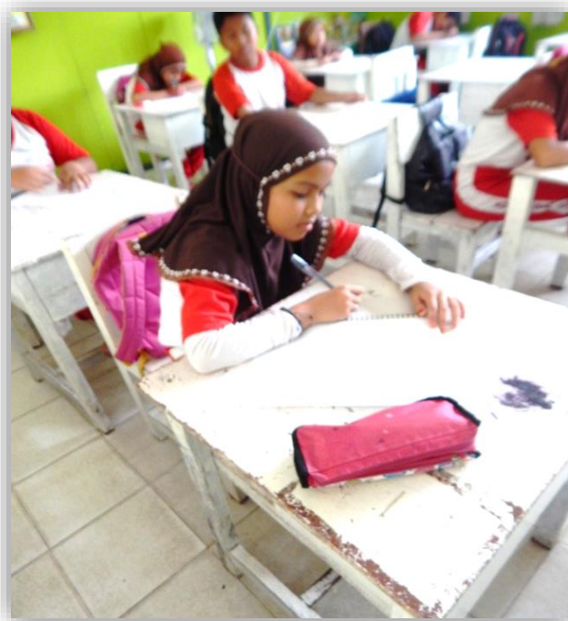
Gambar 4.2 Aktivitas berlangsungnya posttest kelas kontrol