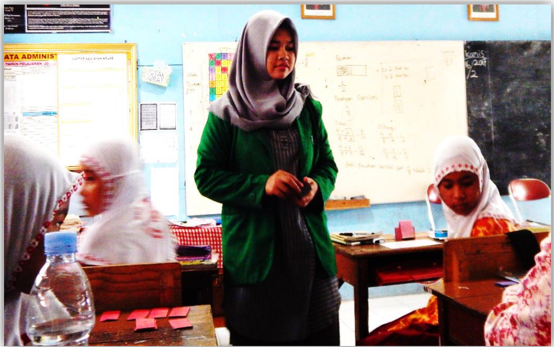
Gambar 4.5 Aktivitas posttest menggunakan tabel perkalian dan kartu pecahan