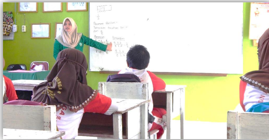
Gambar 4.1 Aktivitas Berlangsungnya Penyampaian Apersepsi