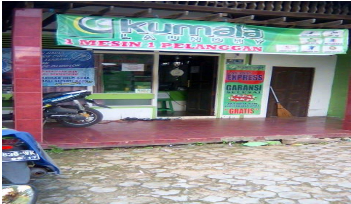
RIWAYAT HIDUP PENULIS