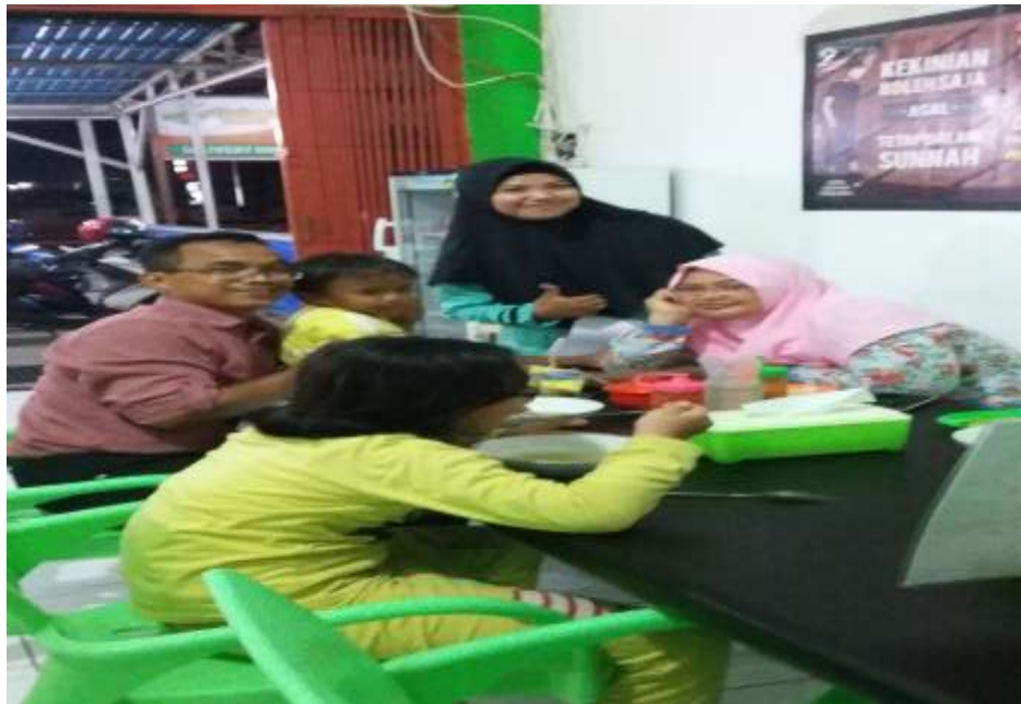
Foto bersama konsumen bakso syar'i khas Malang