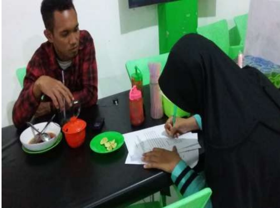
Foto bersama konsumen bakso syar'i khas Malang