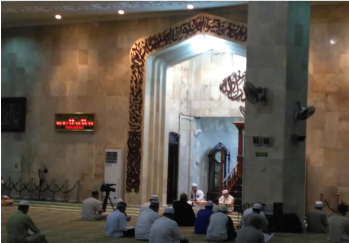
PROSES LIPUTAN PROGRAM SIARAN DAKWAH