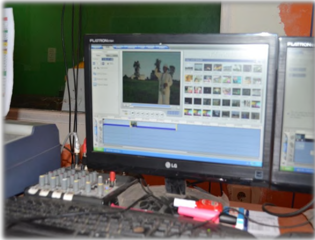
TEMPAT MENGONTROL PROGRAM SIARAN