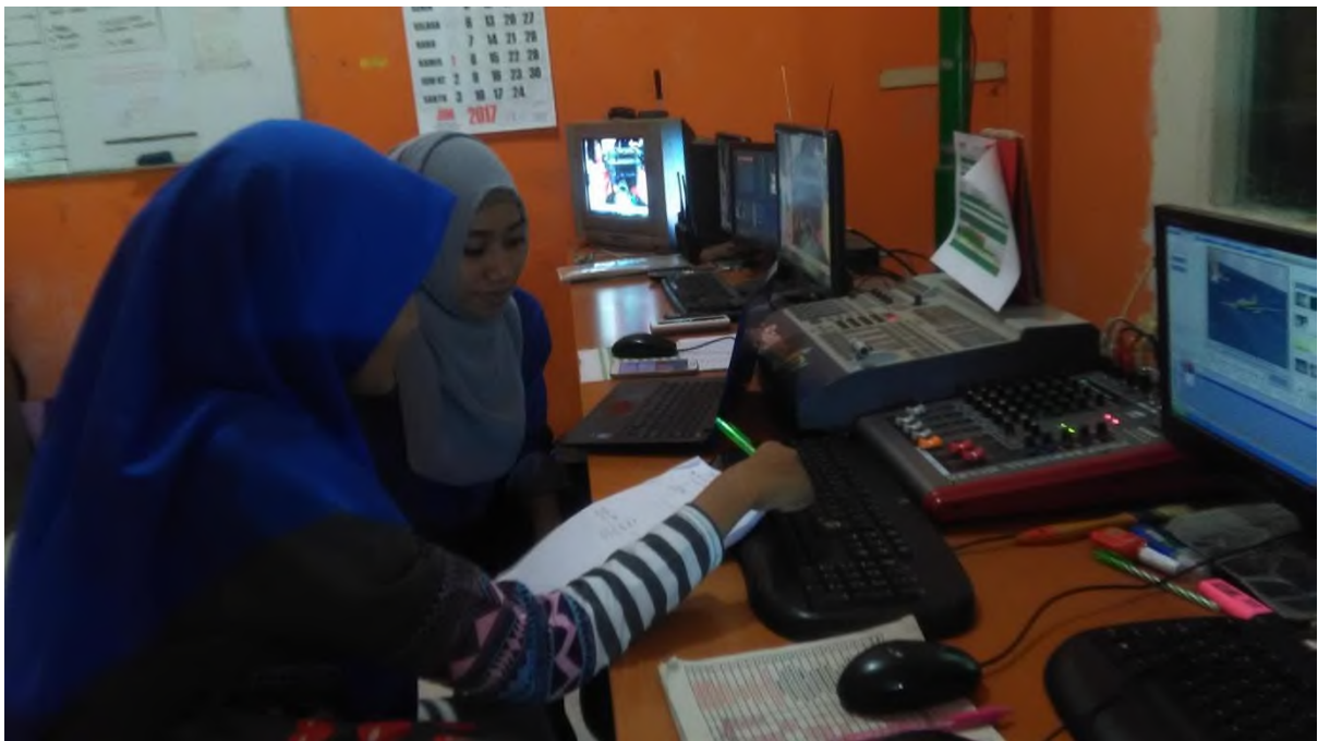
WAWANCARA DENGAN SALAH SATU KARYAWAN DI MASTER CONTROL BANJAR TV