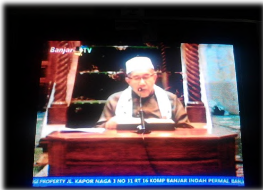
PROGRAM SIARAN YANG SUDAH TAYANG DI TELEVISI