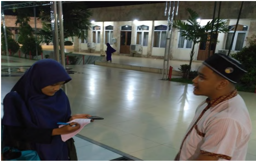
WAWANCARA DENGAN CAMERAMAN SAAT MELIPUT PENGAJIAN