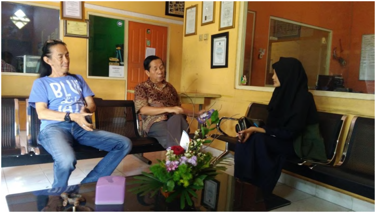
WAWANCARA DENGAN PIMPINAN DIVISI PRODUKSI DAN REDAKTUR NEWS BANJAR TV