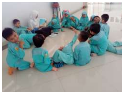
Pemberian materi keagamaan