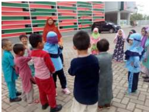
Kegiatan motoric di luar ruangan