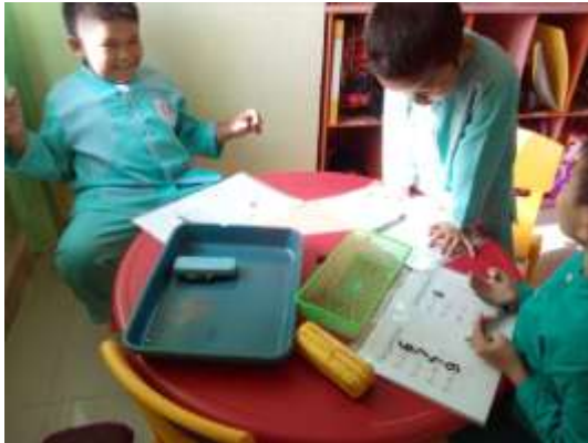
Menulis dan menghitung