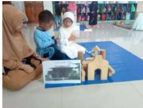
Menjelaskan secara verbal tentang bangunan balok