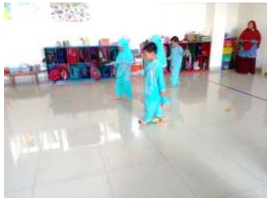
Kegiatan sentra olah tubuh