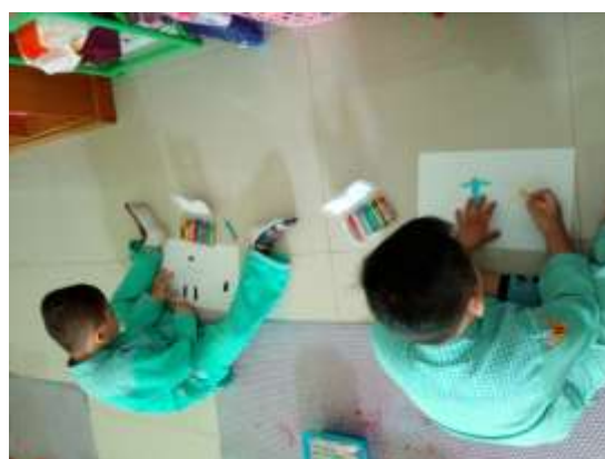
Menggambar dan mewarna