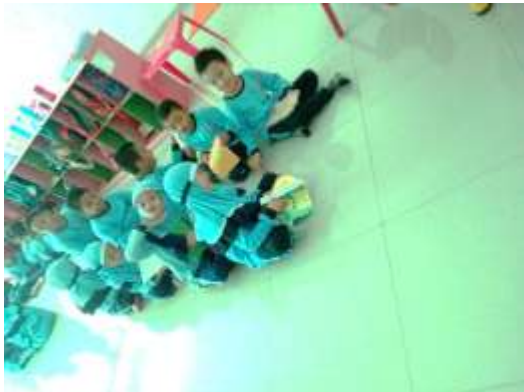
Antri saat menunggu mengaji