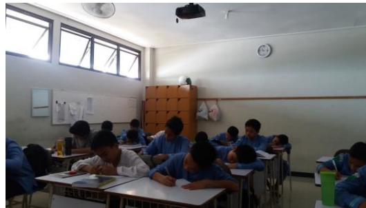
Gambar 4.6 Siswa Menyelesaikan Tugas

Setiap siswa dalam setiap kelompok mendapat nomor 1, 2, 3, dan 4 yang dipilih sesuai pilihan siswa. Nomor yang telah didapatkan itu diletakkan di kepala siswa masing-masing. Penugasan diberikan kepada siswa berdasarkan nomor terhadap tugas yang berangkai.