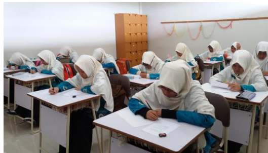
Gambar 4.4. Tes Akhir

Pada pertemuan keempat dilakukan tes akhir, tes akhir dilakukan untuk mengukur tingkat penguasaan materi terkait dengan materi yang diajarkan yaitu tentang persamaan linear satu variabel. Sedangkan jumlah butir soal yang diberikan sebanyak 7 soal yang mencakup keseluruhan indikator yang dicapai.