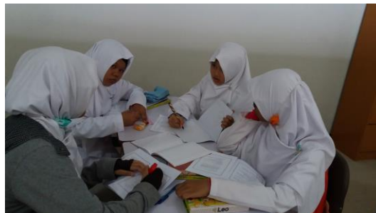
Gambar 4.2 Siswa Berdiskusi Menyelesaikan Soal Yang Diberikan.

Guru membagi kelas dalam beberapa kelompok. Pembagian kelompok dilakukan menurut nilai yang diperoleh dari UTS. Ketika pembagian kelompok, para siswa terlihat antusias dalam pembelajaran. Pembagian kelompok ini siswa dibagi menjadi 5 kelompok yang terdiri dari 3-4 anggota. Kemudian guru menjelaskan maksud pembelajaran dan tugas kelompok.