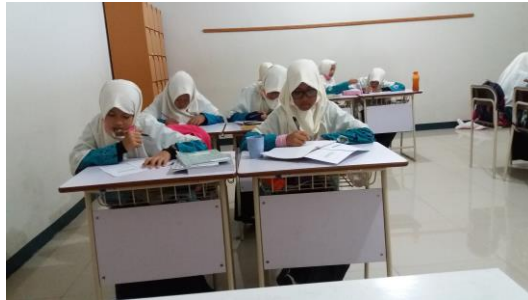
Gambar 4.1 Siswa Mengambil Lembar Soal