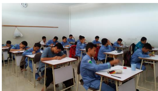
Gambar 4.7 Tes Akhir

Pada pertemuan keempat dilakukan tes akhir, tes akhir dilakukan untuk mengukur tingkat penguasaan materi terkait dengan materi yang diajarkan yaitu tentang persamaan linear satu variabel. Sedangkan jumlah butir soal yang diberikan sebanyak 7 soal.