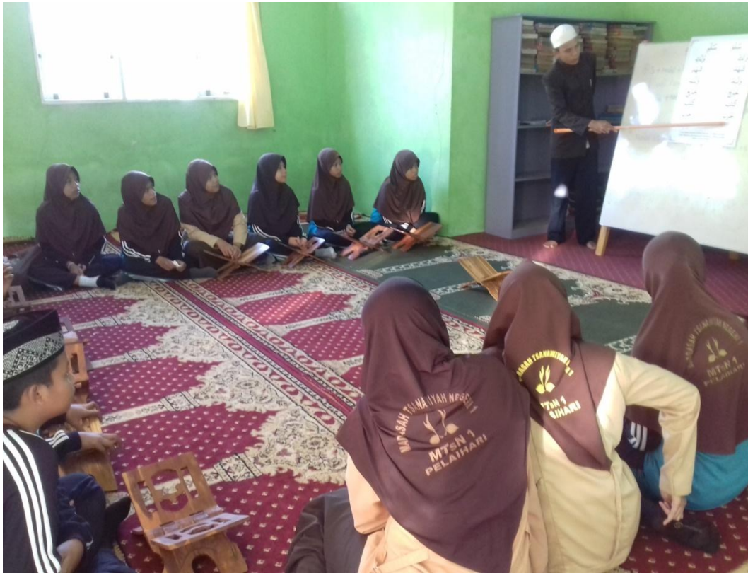
Kegiatan Malam Bina Iman dan Taqwa Full Day School MTsN 1 Pelaihari