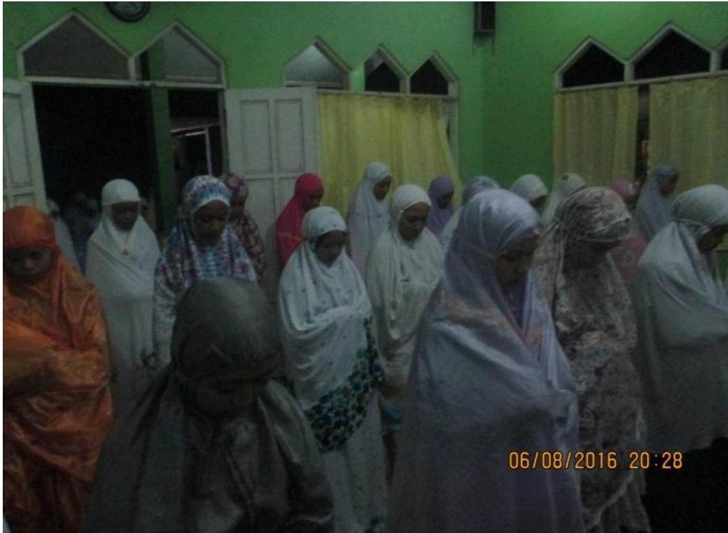
Kegiatan Muhadarah Full Day School MTsN 1 Pelaihari