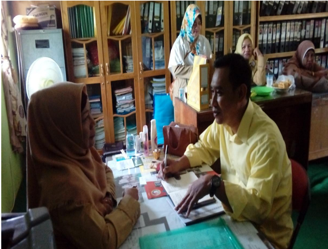
Wawancara dengan Staf Tata Usaha Full Day School MTsN 1 Pelaihari