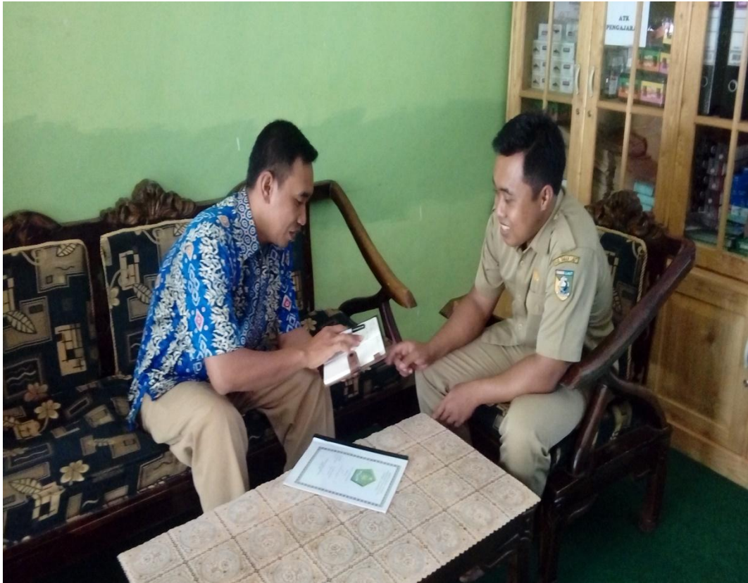
Wawancara dengan Wali Kelas Full Day School MTsN 1 Pelaihari