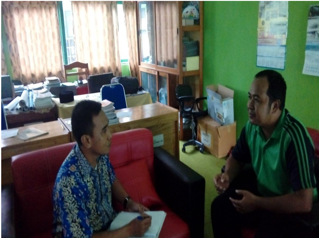
Wawancara dengan Dewan Guru Full Day School MTsN 1 Pelaihari