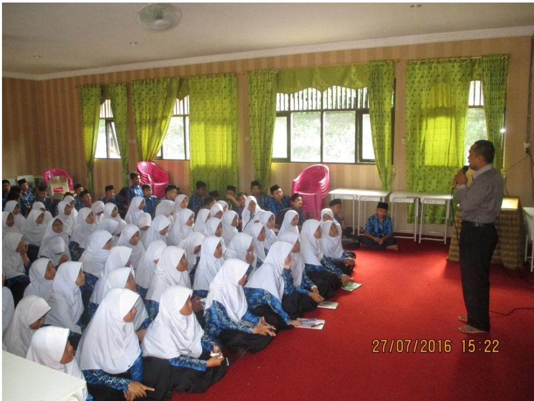
Kegiatan Metode Tilawati Full Day School MTsN 1 Pelaihari