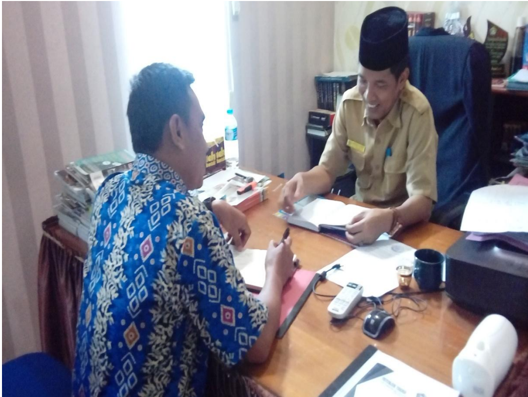
Wawancara dengan Wakamad Full Day School MTsN 1 Pelaihari