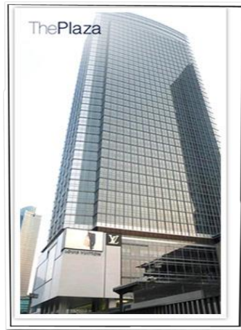
Gambar 4.2 PT. Enagic Indonesia