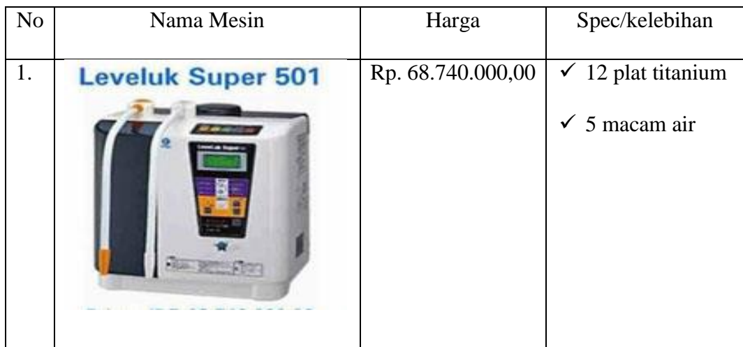
Tabel 4.1 Jenis dan harga mesin

Leveluk bukan hanya alat penyaring air biasa, tetapi merupakan alat yang dapat menghasilkan beberapa jenis air yang bermanfaat bagi kebutuhan kita sehari-hari, bahkan pemerintah Jepang sudah mengakui sebagai alat kesehatan ( Medical Device ). Leveluk tersedia dengan beberapa jenis dan setiap jenis memiliki kelebihan dan kekurangan masing. Berikut daftar mesin LEVELUK yang biasanya di jual oleh perusahaan :