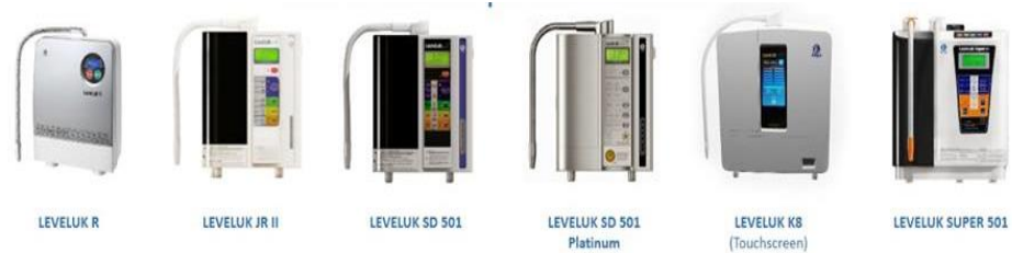
Gambar 4.1 Mesin Leveluk

Leveluk bukan hanya alat penyaring air biasa, tetapi merupakan alat yang dapat menghasilkan beberapa jenis air yang bermanfaat bagi kebutuhan kita sehari-hari, bahkan pemerintah Jepang sudah mengakui sebagai alat kesehatan ( Medical Device ). Leveluk tersedia dengan beberapa jenis dan setiap jenis memiliki kelebihan dan kekurangan masing. Berikut daftar mesin LEVELUK yang biasanya di jual oleh perusahaan :