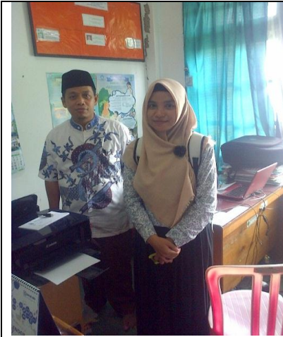
Pegawai di Kementrian Agama Kota Banjarbaru