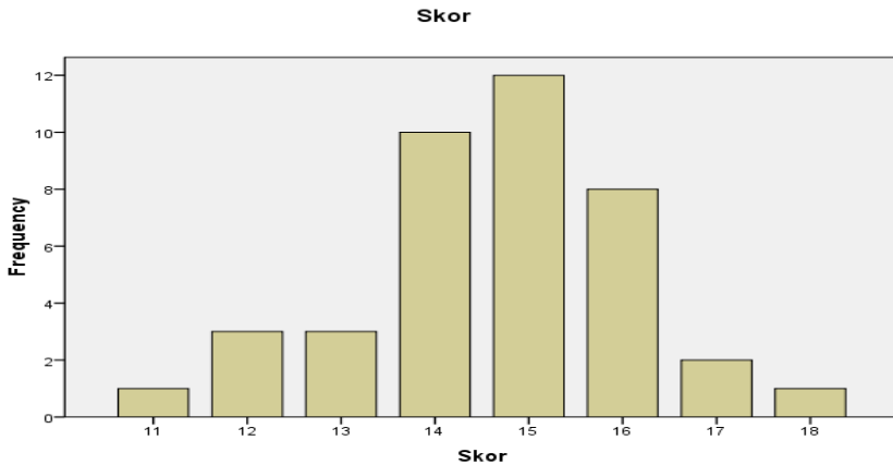
Grafik 6.1. Respon Ulama terhadap Pembangunan di Kalimantan Selatan

Dari Grafik 5.1. di atas dapat diketahui bahwa 10 orang responden mendapat skor 14, 12 orang responden mendapat skor 15, dan 8 orang responden mendapat skor 16. Dengan kata lain, banyak responden (30 orang) yang mendapat skor antara 14-16. Skor tersebut berada di atas skor rerata (12,88), yang termasuk dalam kategori merespon positif. Bagaimanapun, gambar itu memberi makna bahwa sebahagian besar atau mayoritas ulama mempunyai kesan positif ke atas pembangunan, termasuk terhadap pembangunan sosial di Kalimantan Selatan.