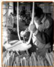
Sumber: Oxford Ensiklopedi, 5 Gambar 4.8 Industri kerajinan kayu