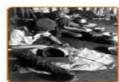
Gambar 4.4 Pabrik

Industri adalah kegiatan usaha bahan baku menjadi bahan jadi. Kerajinan adalah kegiatan membuat peralatan dari bahan seadanya. Industri lebih mengacu pada kegiatan usaha yang berskala besar (dalam jumlah besar). Kerajinan adalah usaha dalam jumlah kecil. Pengrajin adalah orang yang pekerjaannya membuat kerajinan. Barang kerajinan biasanya pengerjaannya secara perorangan (bukan perusahaan). Contoh industri, antara lain pembuatan sepatu, jaket, pakaian, tas, industri elektronik, dan otomotif (mesin mobil).. Contoh kerajinan, antara lain kerajinan perak (perhiasan), peralatan dapur/rumah tangga, kerajinan gerabah (tanah liat), dan kerajinan aksesoris, tas, tikar, dan sebagainya.