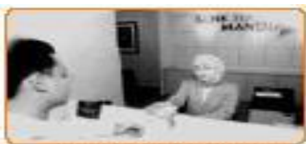
Gambar 4.5 Bank merupakan salah satu usaha dalam bidang jasa

Usaha bidang jasa merupakan kegiatan produksi yang tidak menghasilkan benda, melainkan memberikan pelayanan kepada masyarakat sesuai dengan kebutuhan. Contoh usaha jasa adalah perusahaan angkutan, perusahaan asuransi, dokter, tukang cukur, bank, bengkel, warung internet, dan rental komputer.