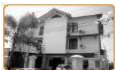
Gambar 4.6 Perseroan Terbatas

Perseroan terbatas (PT) adalah suatu persekutuan untuk menjalankan usaha yang modalnya diperoleh dari penjualan saham yang nilai nominalnya sama besar. Orang yang membeli saham disebut pesero. Setiap pesero bertanggung jawab pada saham yang ditanamkan. Pemilik Perseroan Terbatas adalah pemegang saham.