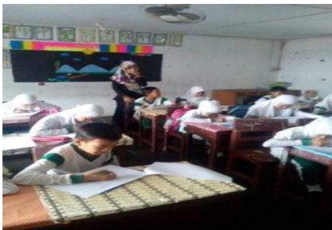
LAMPIRAN 42. Foto Kegiatan Riset di Kelas Eksperimen I dan II