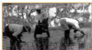
Sumber: Indonesian Heritage 2 Gambar 4.2 Contoh usaha di bidang pertanian

Hasil usaha pertanian adalah usaha yang menghasilkan bahan pangan. Diantaranya padi, jagung, kacang, kedelai, sagu, umbi-umbian, buah-buahan, dan sayur-sayuran. Tanaman ini mempunyai umur pendek (dapat dipanen tiga sampai enam bulan).