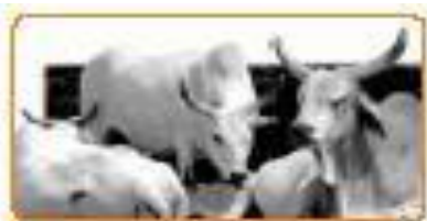
Sumber: Ensiklopedi Umum, 6 Gambar 4.3 Peternakan merupakan salah satu usaha perekonomian