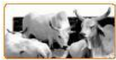
Gambar 4.3 Peternakan merupakan salah satu usaha perekonomian