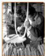
Gambar 4.8 Industri kerajinan kayu