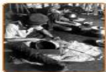
Gambar 4.4 Pabrik

industri elektronik, dan otomotif (mesin mobil).. Contoh kerajinan, antara lain kerajinan perak (perhiasan), peralatan dapur/rumah tangga, kerajinan gerabah (tanah liat), dan kerajinan aksesoris, tas, tikar, dan sebagainya.