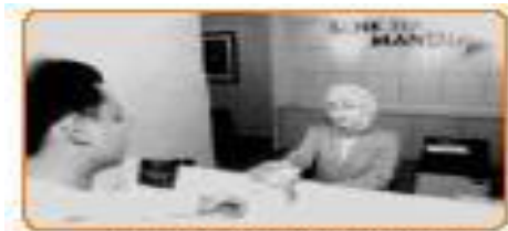
Gambar 4.5 Bank merupakan salah satu usaha dalam bidang jasa