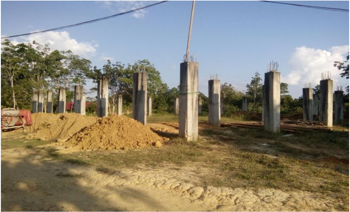
Photo: Proses pembangunan masjid di Pondok pesantren Nailul Authar yang masih belum selesai.