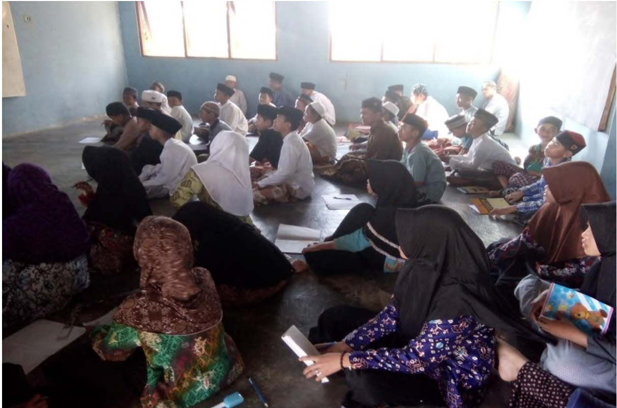
Photo: Satriwan dan Santriwati sedang mengikuti proses belajar mengajar di Pondok Pesantren Nailul Authar.