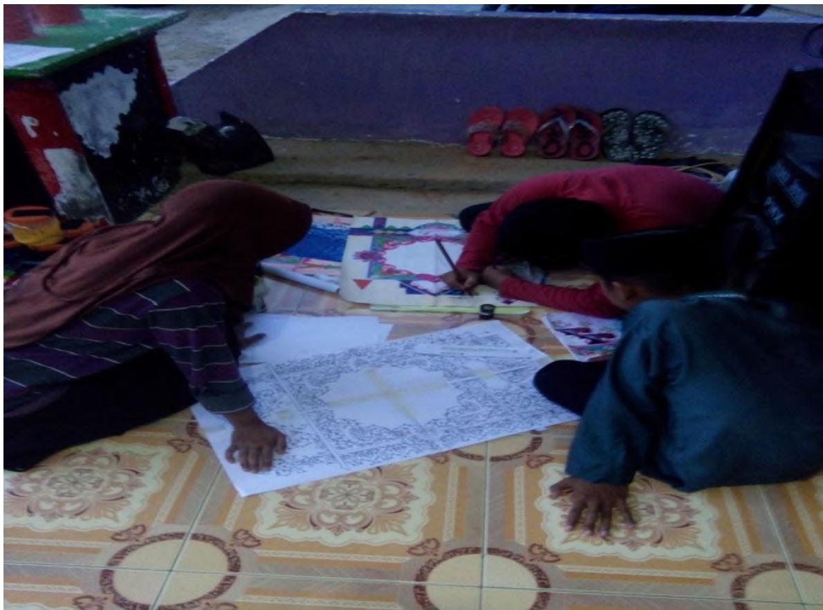
Photo: latihan pembuatan kaligrafi bersama mualim persiapan FASI tingkat Provinsi di Palankaraya.