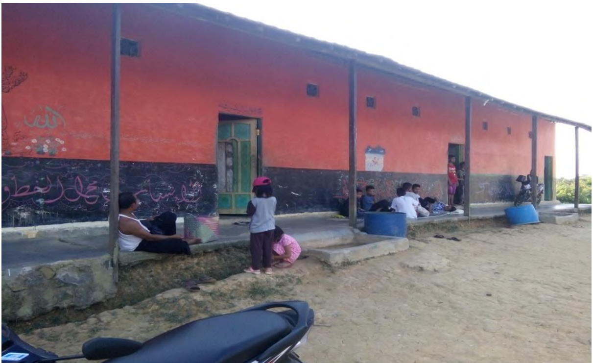
Photo: Asrama putra Pondok Pesantren Nailul Authar