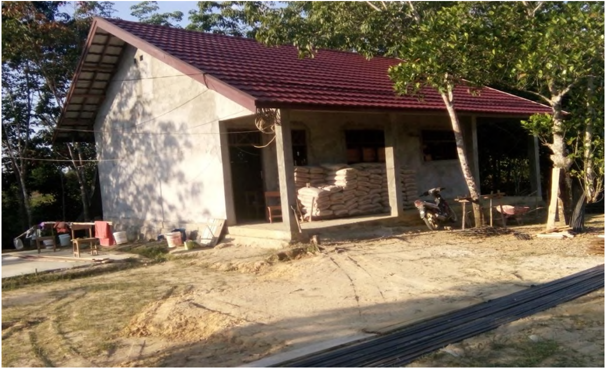
Gudang penyimpanan material bangunan masjid.