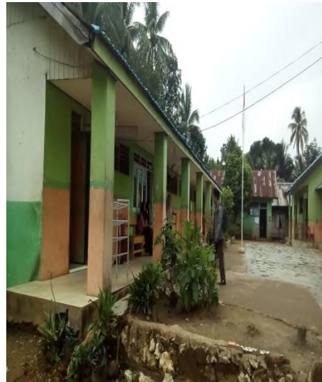
Bangunan MTsN 12 Tabalong