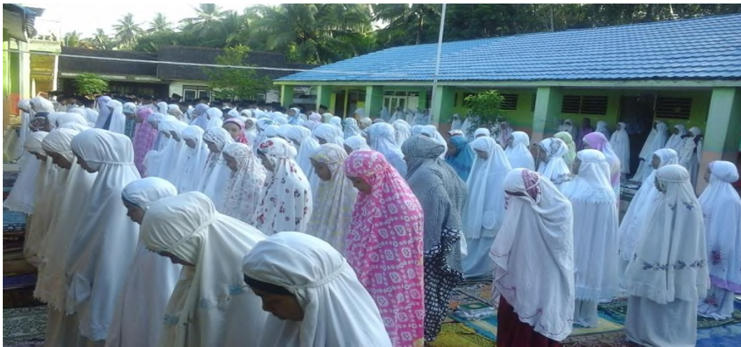
Shalat Dhuha Bersama Siswa MTsN 12 Tabalong