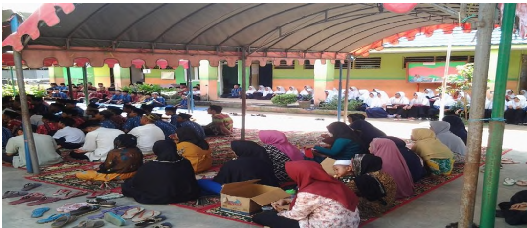
Acara Maulid Nabi sekaligus rapat dengan orangtua siswa