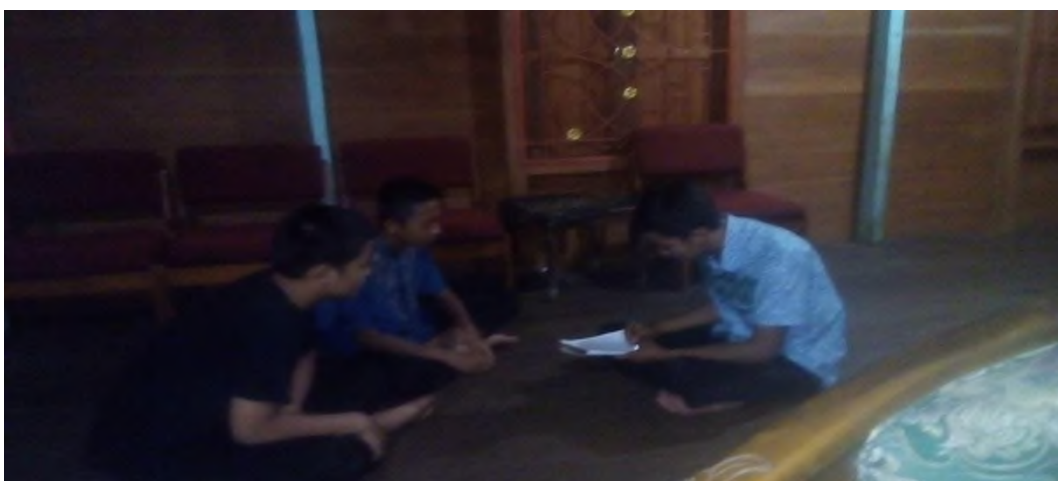
Wawancara dengan siswa MTsN 12 Tabalong