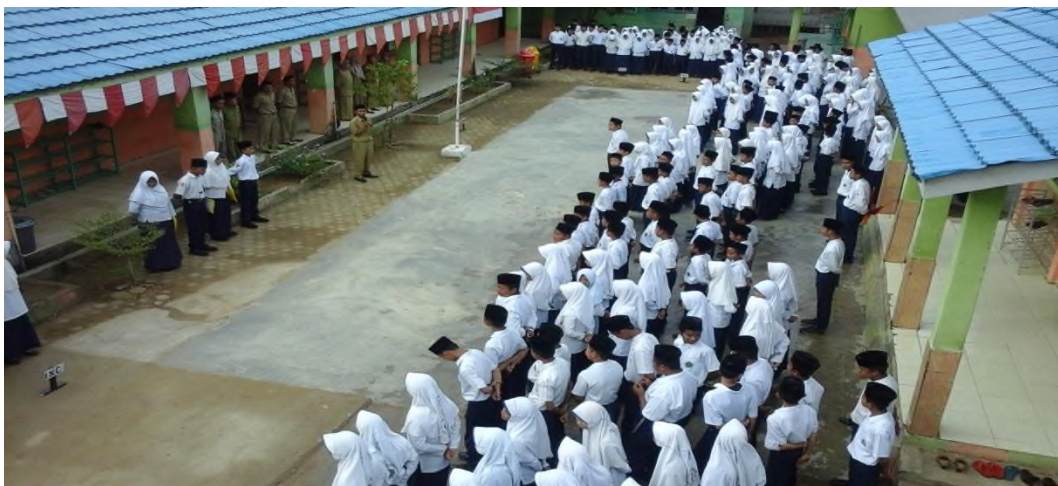
Apel Pagi Senin, Pembina Sedang Memberikan Amanat