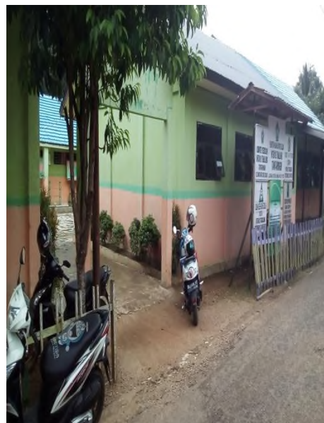
Bangunan MTsN 12 Tabalong