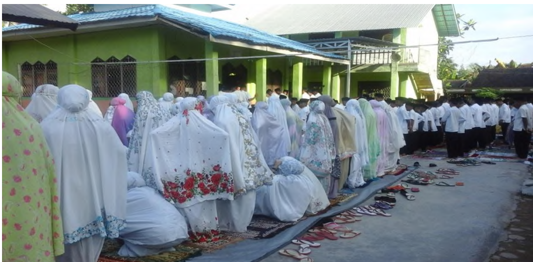
Shalat Dhuha Bersama Siswa MTsN 12 Tabalong