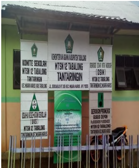
Bangunan MTsN 12 Tabalong