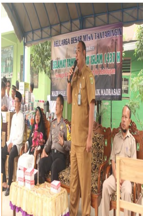
Peringatan Tahun Baru Islam di MTsN 12 Tabalong dengan mengundang Penceramah, Kepolisian, dan Camat.