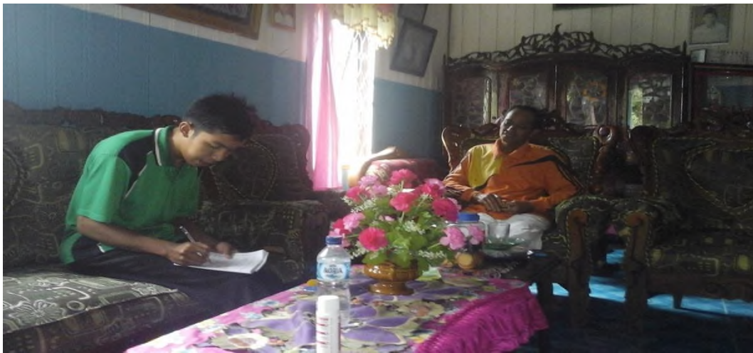
Wawancara dengan orangtua siswa