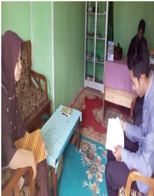
Wawancara dengan guru mapel Akidah Akhlak