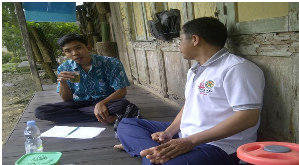
Wawancara dengan orangtua siswa