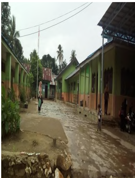
Bangunan MTsN 12 Tabalong