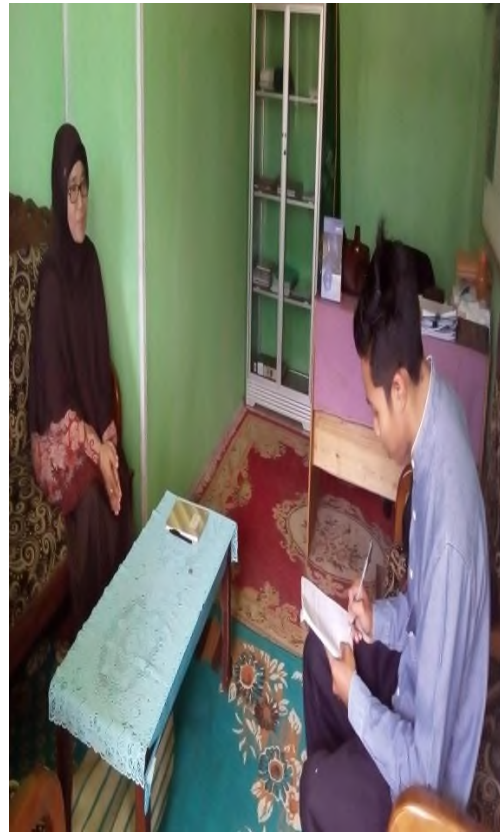
Wawancara dengan Kepala Sekolah MTsN 12 Tabalong