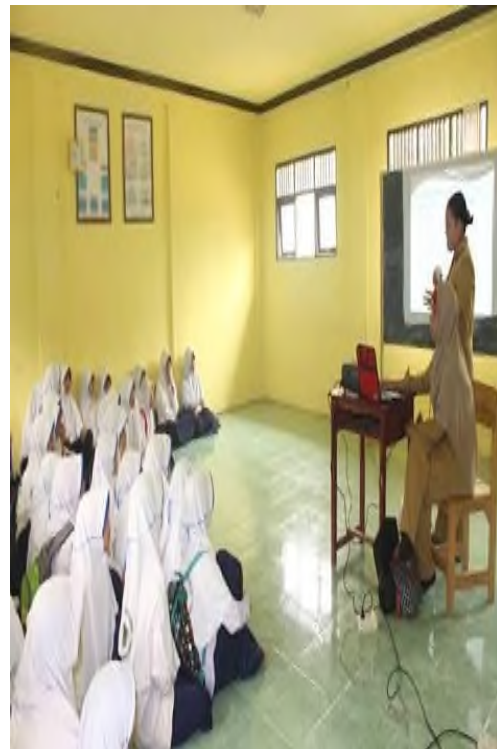
Penyuluhan oleh Puskesmas tentang Narkoba