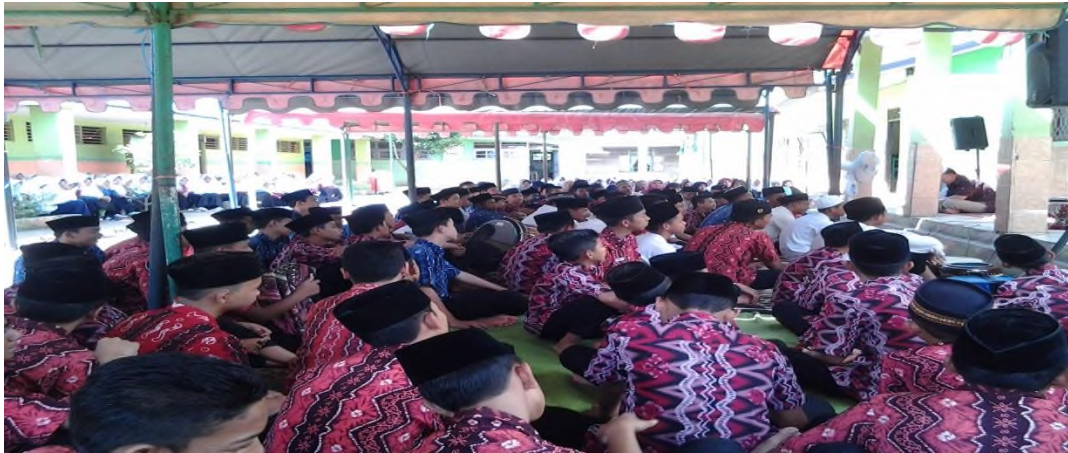
Acara Maulid Nabi