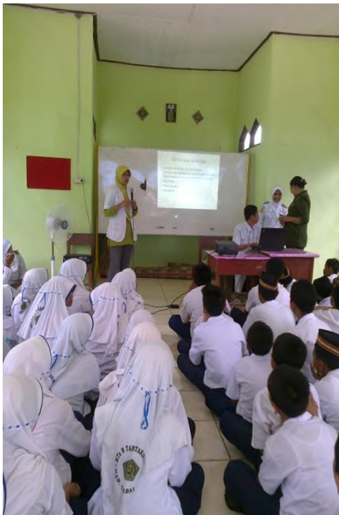
Penyuluhan oleh Puskesmas tentang Narkoba