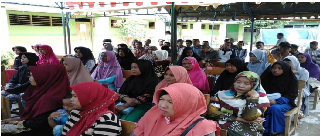
Acara Maulid Nabi sekaligus rapat dengan orangtua siswa