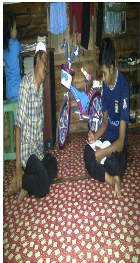
Wawancara dengan orangtua siswa