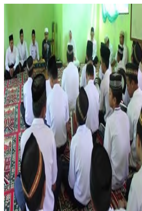
Acara Maulid Nabi