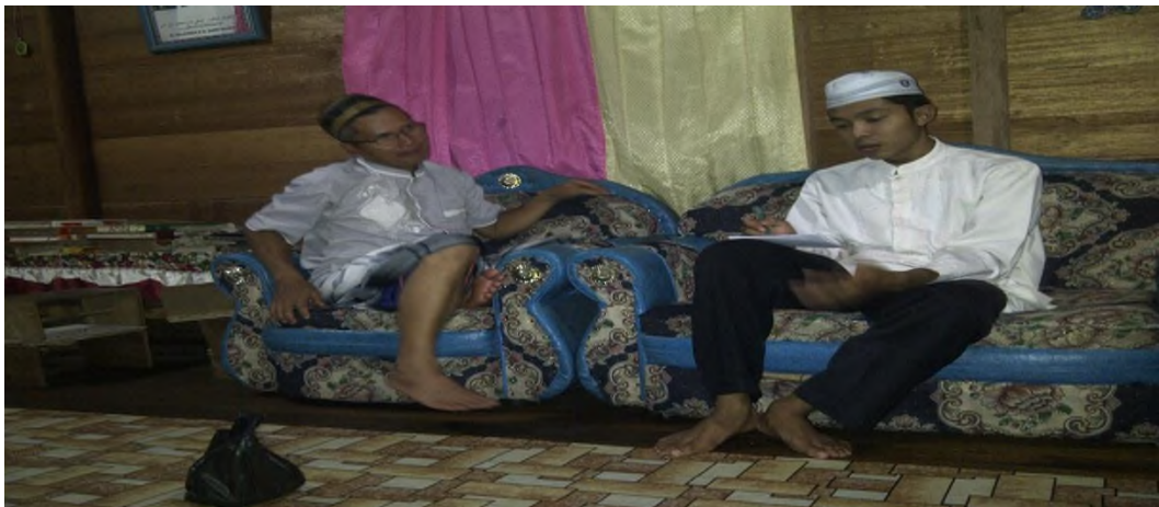
Wawancara dengan orangtua siswa