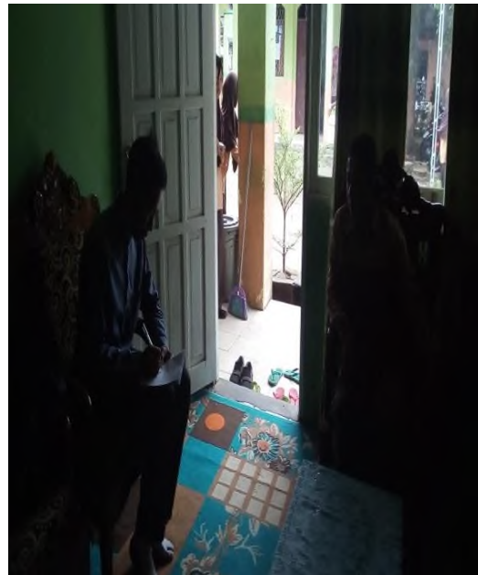
Wawancara dengan Wakamad Kesiswaan