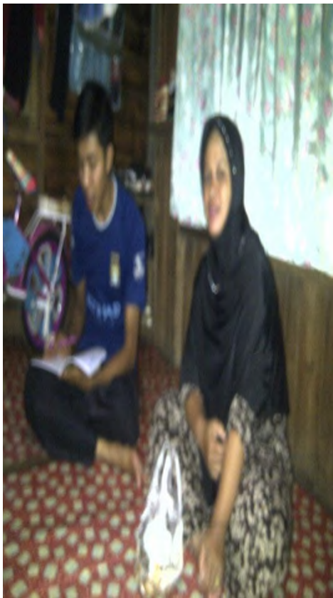
Wawancara dengan orangtua siswa