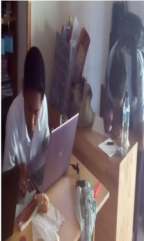
Meminta Profil Sekolah di Tata Usaha