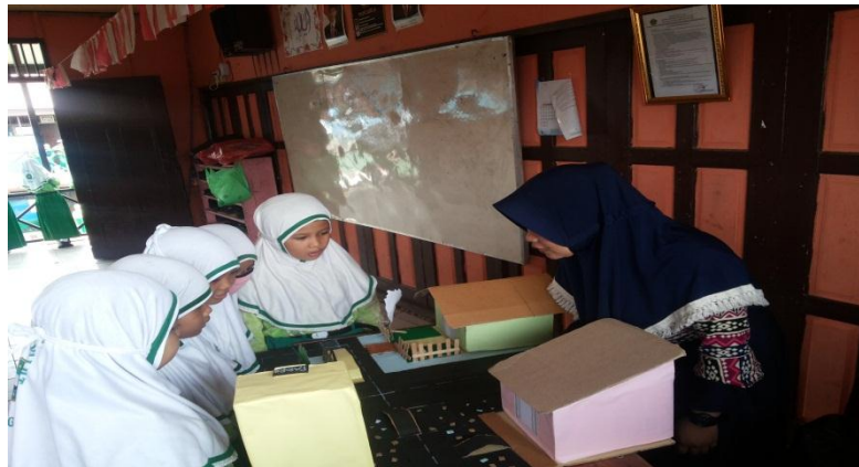
Gambar 4.1. Aktivitas peserta didik saat pembelajaran dengan menggunakan media miniatur rumah-rumahan 3D

Saat pembagian kelompok berlangsung suasana kelas terlihat cukup ribut. Banyak peserta didik menginginkan kelompok itu dibentuk dan dipilih berdasarkan kemauan mereka sendiri. Namun, setelah diberi penjelasan akhirnya mereka dapat menerimanya.