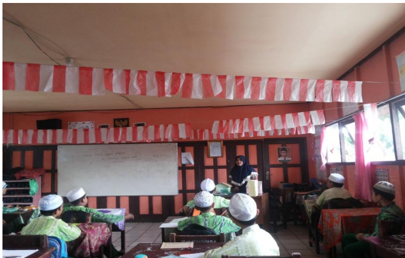
Gambar 4.2. Aktivitas peserta didik dan guru saat pembelajaran dengan menggunakan media media miniatur rumah-rumahan 3D

Pada pembelajaran di kelas eksperimen ini guru mengajar dengan menggunakan media miniatur rumah-rumahan 3D yang sudah dibuat sedemikian rupa untuk meningkatkan minat peserta didik dalam belajar IPA. Secara umum kegiatan pembelajaran dikelas eksperimen Menggunakan strategi pembelajaran aktif. Materi tersebut di bagi menjadi 2 untuk 2 kali pertemuan.