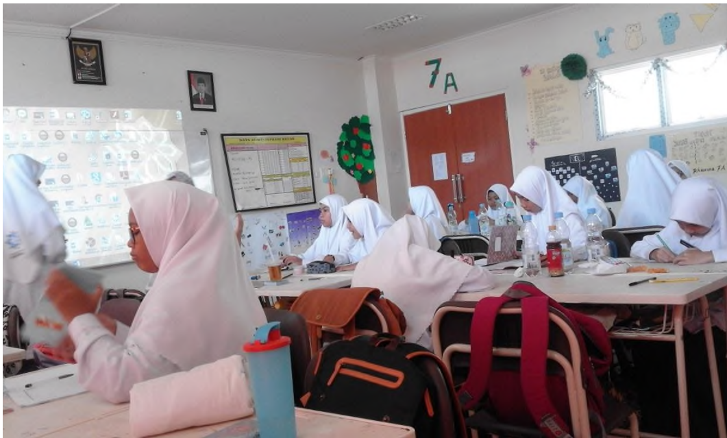
Kegiatan Layanan Klasikal BK