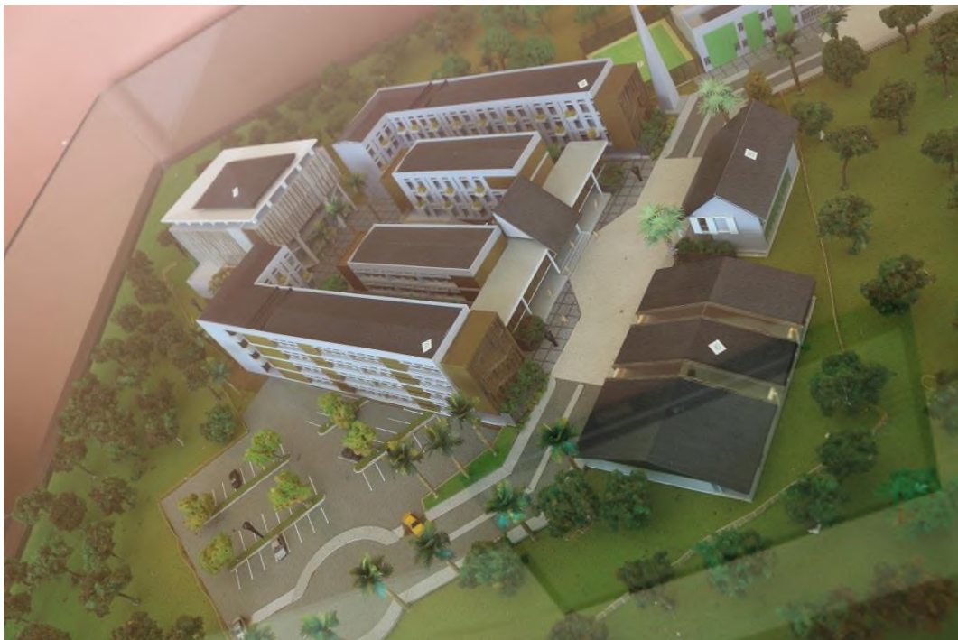
Maket denah Yayasan SIT Ukhuwah Banjarmasin