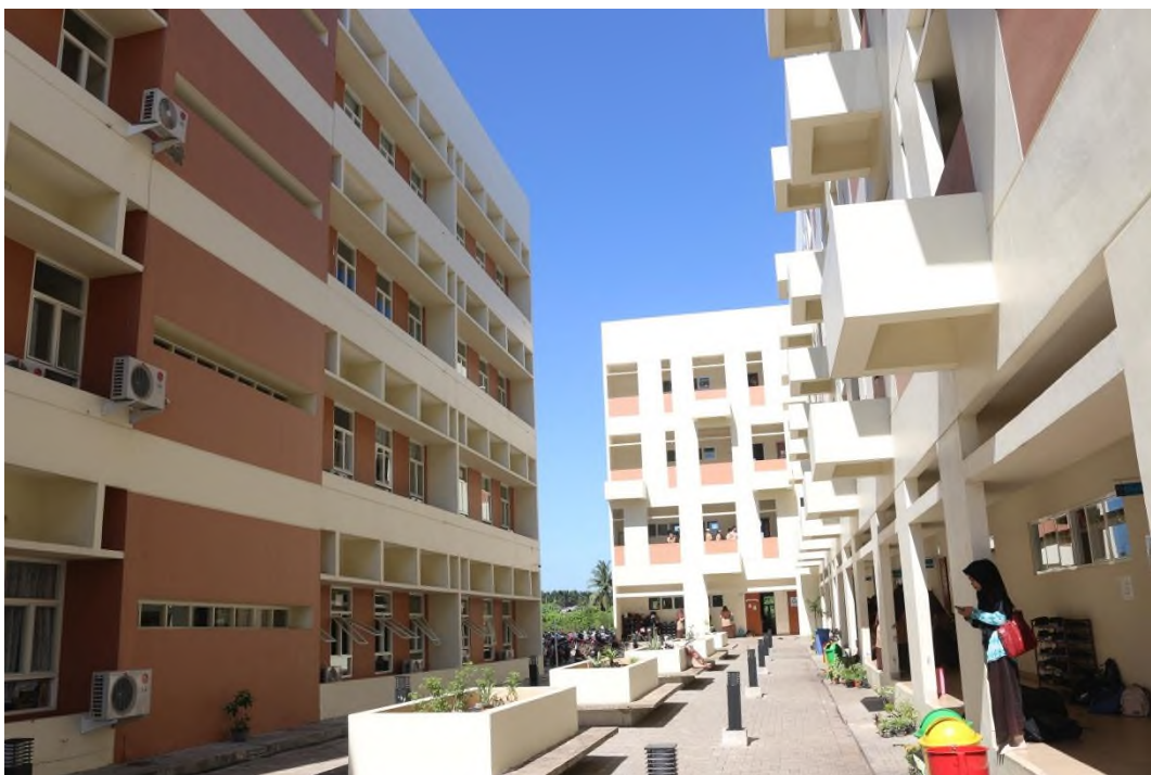
SMP Islam Terpadu Ukhuwah Banjarmasin