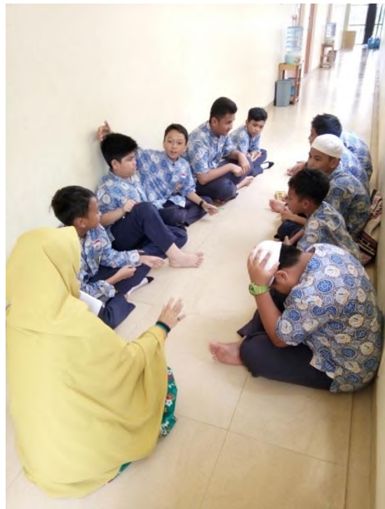
Kegiatan Penyebaran Skala Motivasi Belajar