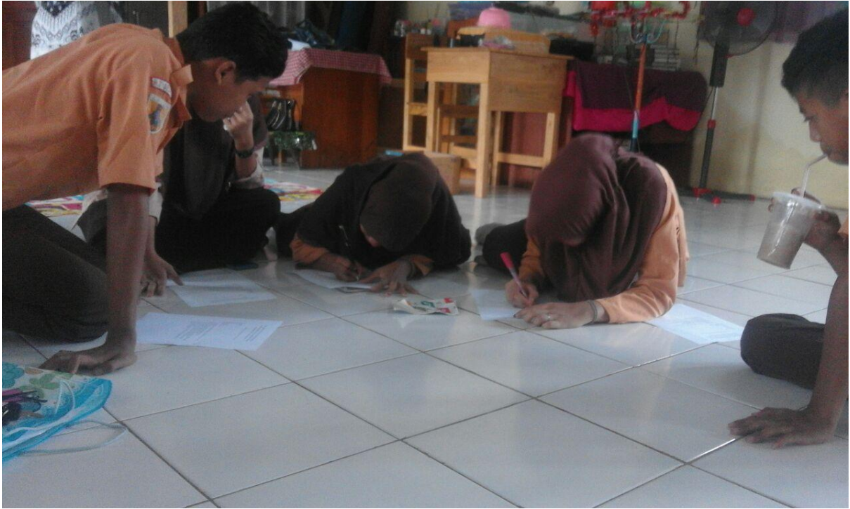
Fotobersamapelajar SMPN 4 Kandangan