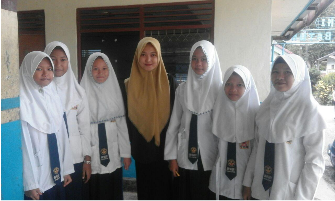
Fotobersamapelajar SMPN 1 Padang Batung