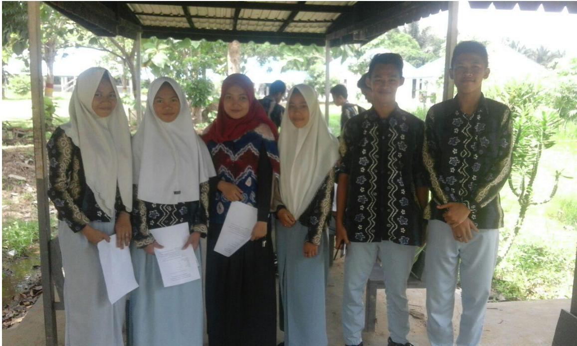
Fotobersamapelajar SMAN 1 Simpur