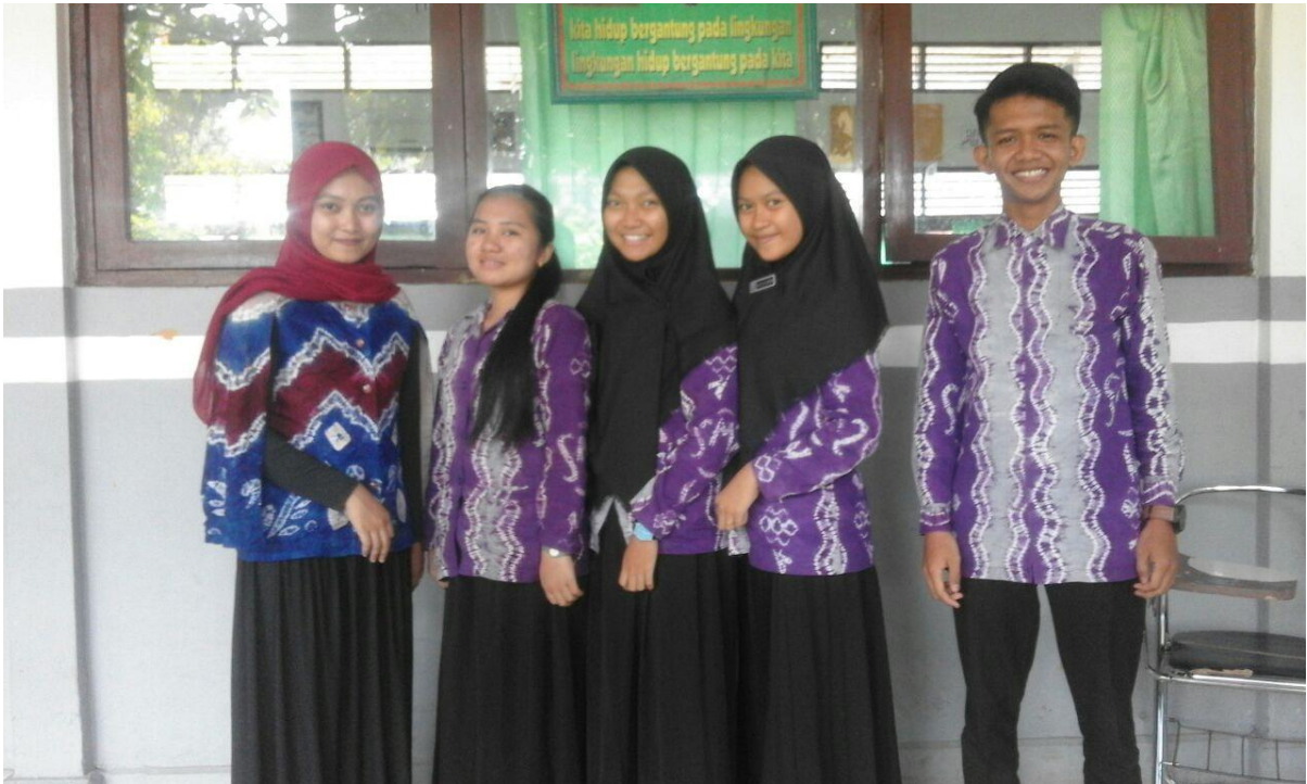
Fotobersamapelajar SMAN 2 Kandangan