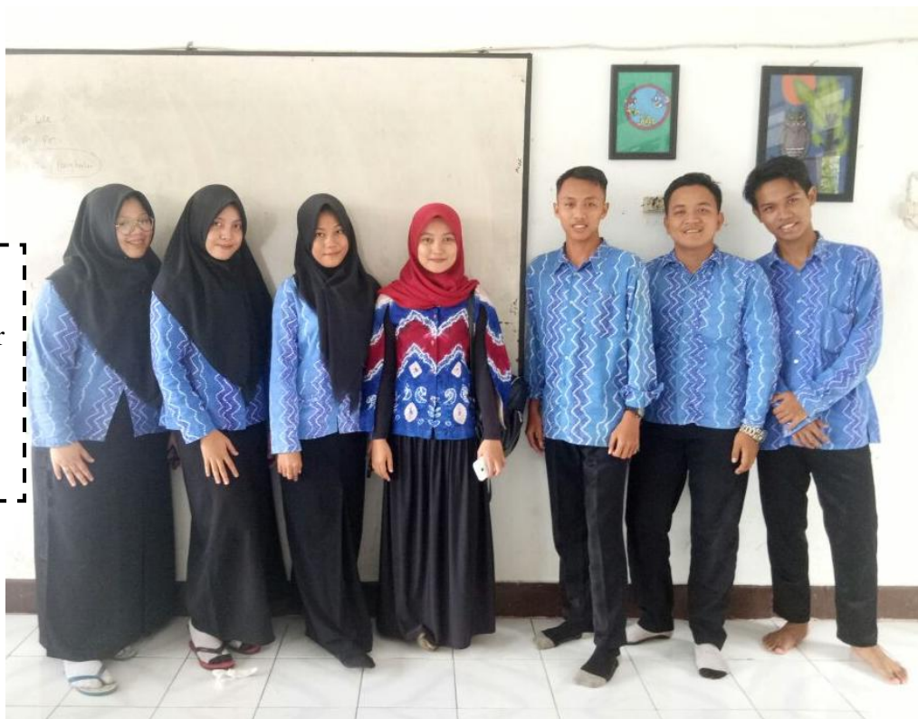
Foto pelajar ber- sama pelajar S MAN 1 Kandangan