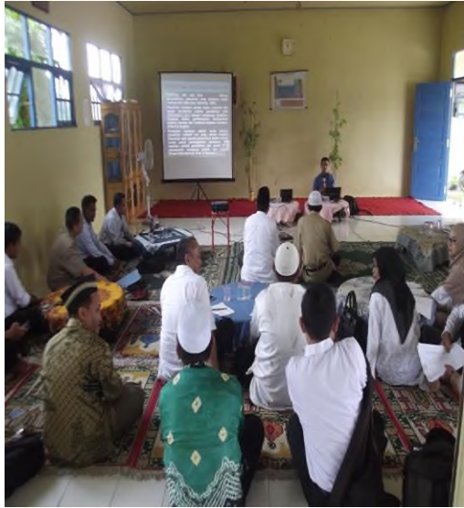
Kegiatan Workshop PTK