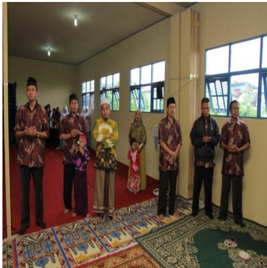
Guru-Guru MA Al-Istiqamah