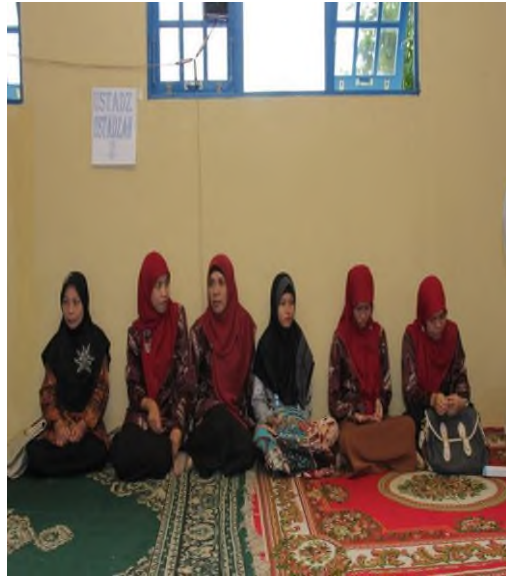
Guru-Guru MA Al-Istiqamah