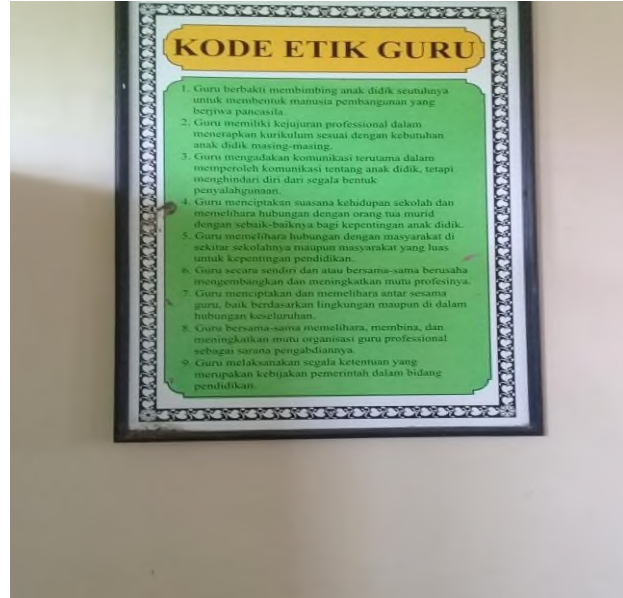
Kode Etik Guru