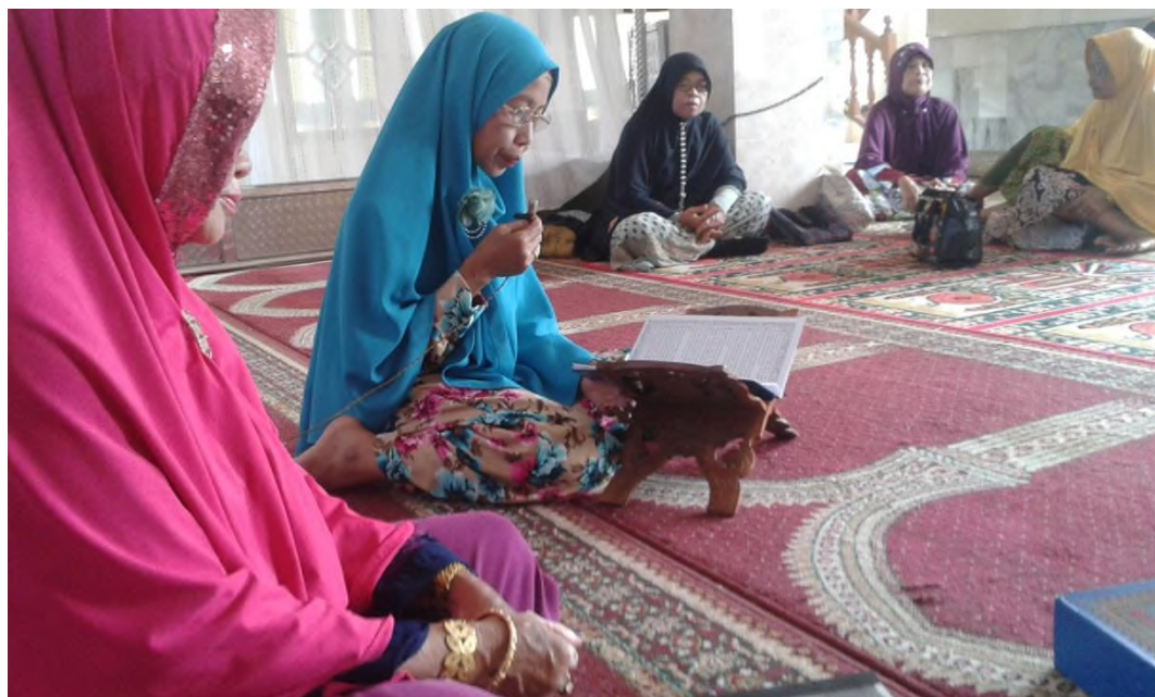
Wawancara dengan Anggota Muhammadiyah sekaligus ikut pengajian