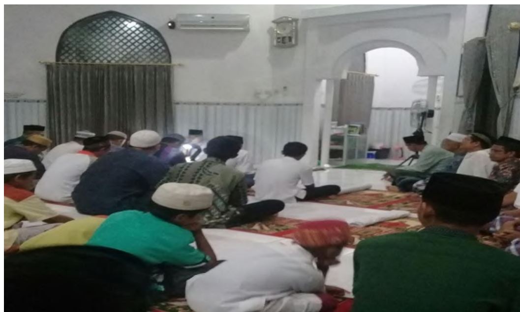
Dakwah keliling di tingkat Ranting Cabang Muhammadiyah Alabio 1 di Mushalla Al Huda