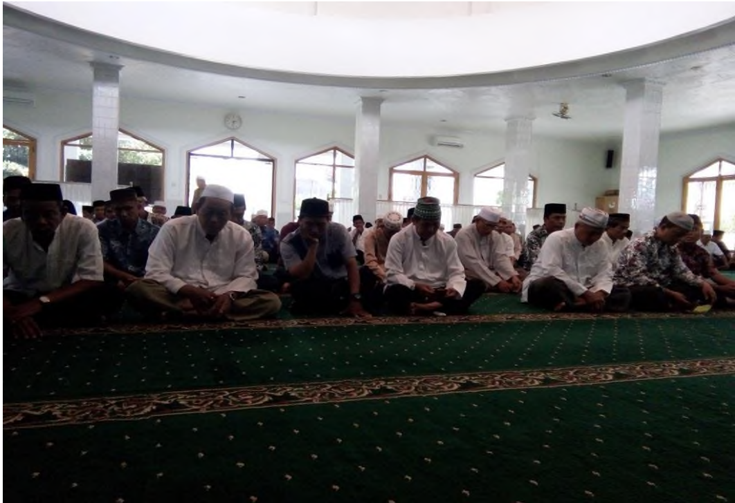
Dakwah keliling tingkat cabang di Mesjid Al-Amin Cabang Muhammadiyah Alabio 1