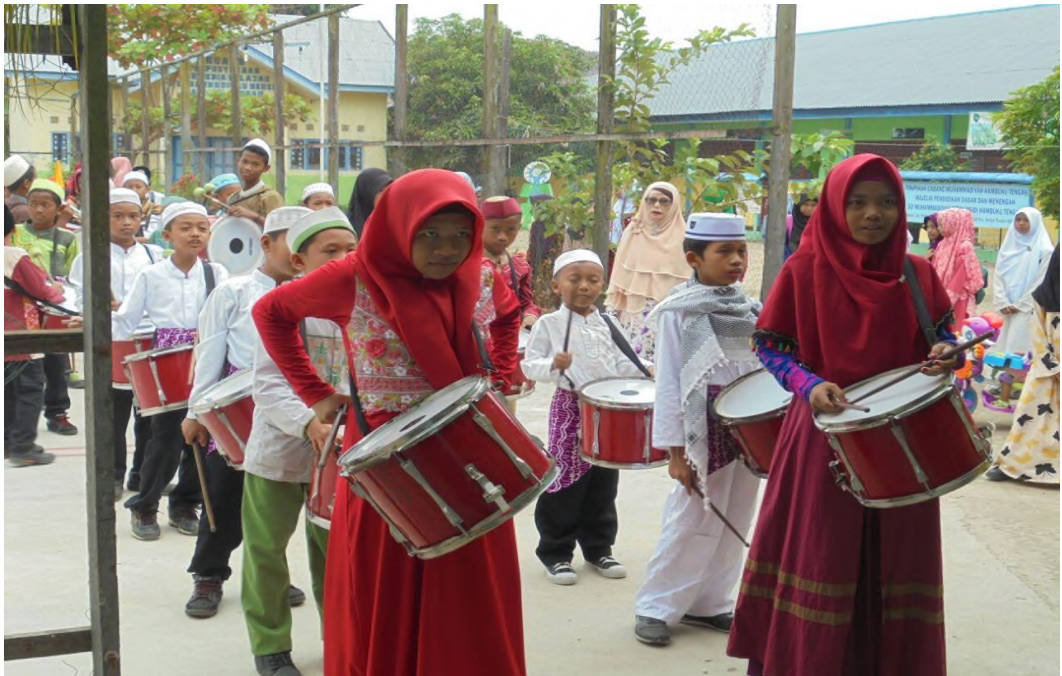
Latihan Drumb Band