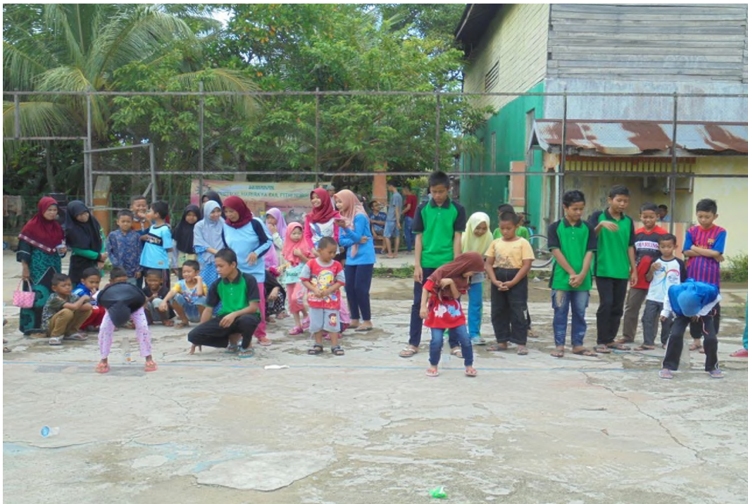
Lomba 17 Agustus oleh Cabang Muhammadiyah Hambuku Tengah