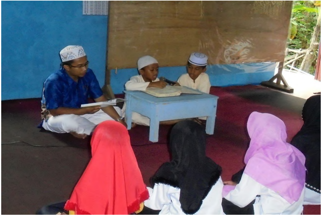
TPA Nurul Iman