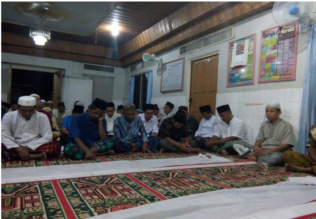
Dakwah Keliling di tingkat Ranting Cabang Muhammadiyah Alabio 1