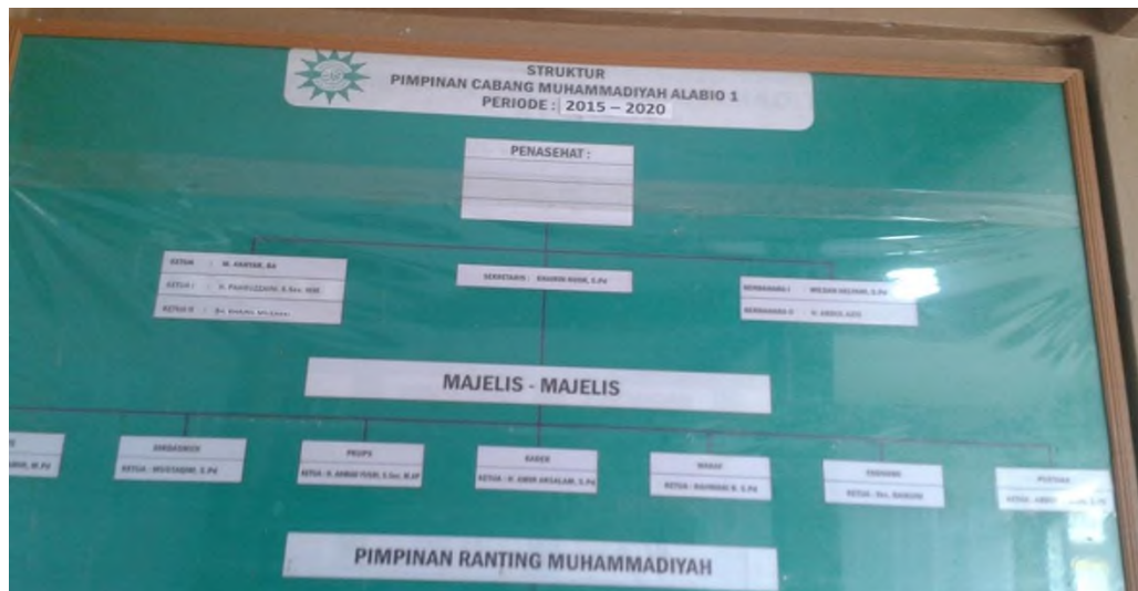
Struktur Kepengurusan cabang Muhammadiyah Alabio 1