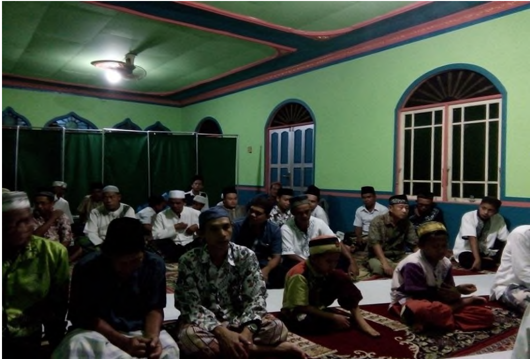
Dakwah Keliling di tingkat ranting Cabang Muhammadiyah Alabio 1 di Mushalla Al Akhyar