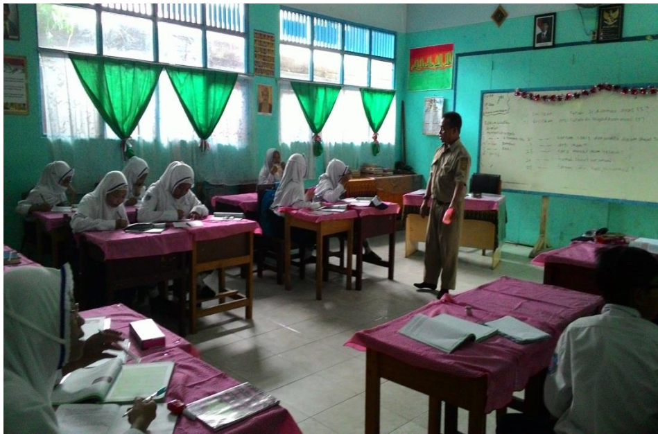
2. Guru Pendamping Khusus bersama Siswa Inklusi saat pembelajaran Pendidikan Agama Islam