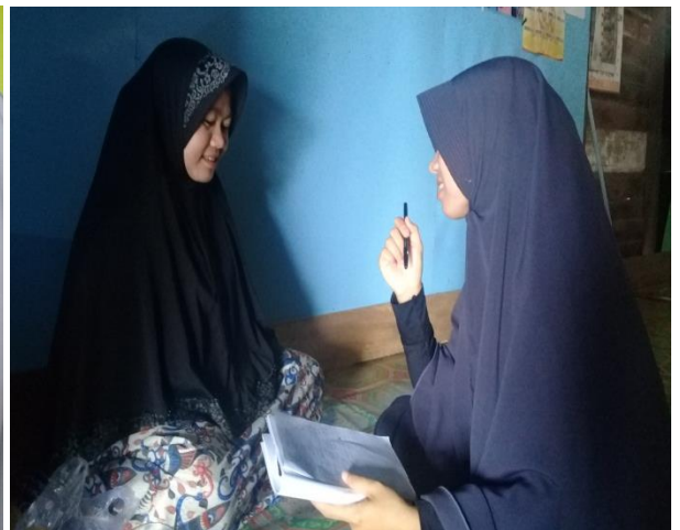
Wawancara Dengan Guru