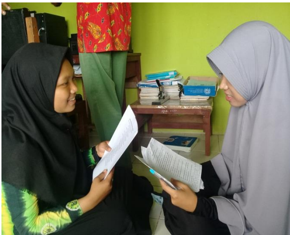
Wawancara Dengan Siswa Kelas X PAI