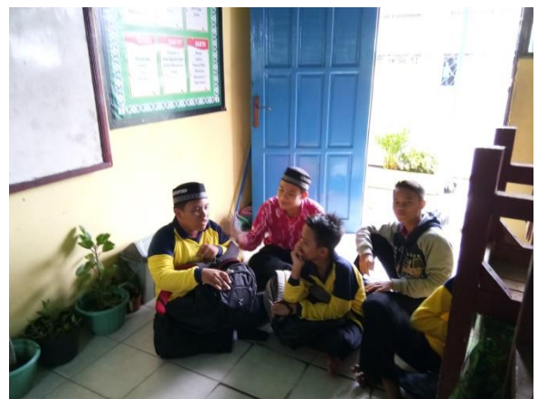
Wawancara dengan pengurus OSIS