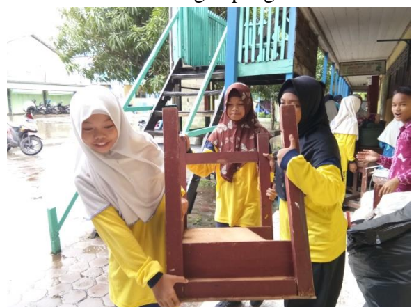
Baksos seluruh pengurus OSIS