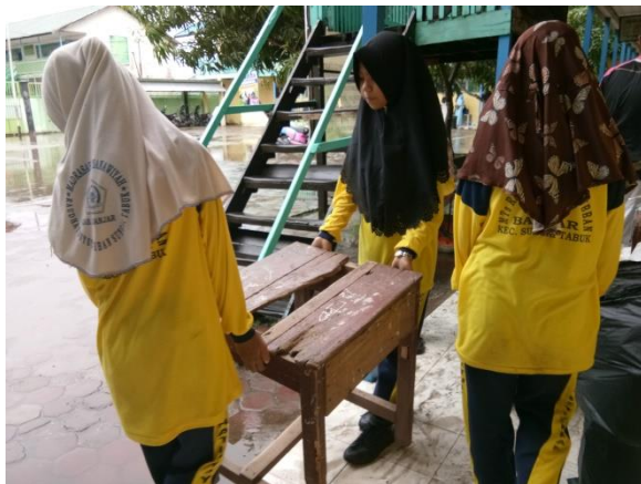
Baksos seluruh pengurus OSIS