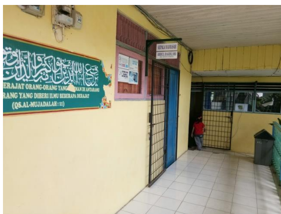
Kantor kepala sekolah