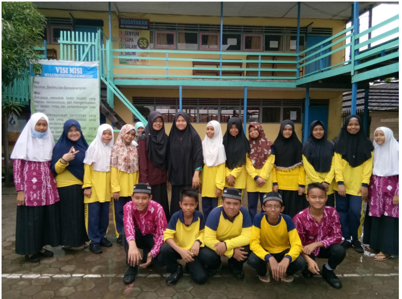
Bersama Seluruh Pengurus OSIS MTs Raudhatussuyuban Sungal Lulut Kabupaten Banjar