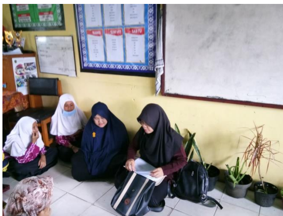
Wawancara dengan pengurus OSIS