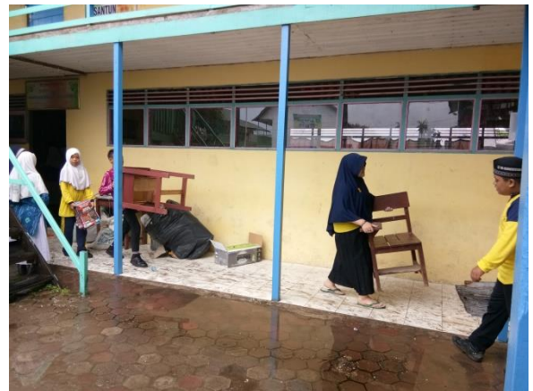
Baksos seluruh pengurus OSIS