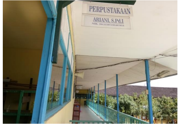
Perpustakaan MTs Raudhatussuyubban