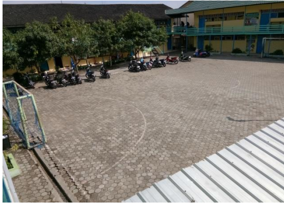
Lapangan MTs Raudhatussuyubban