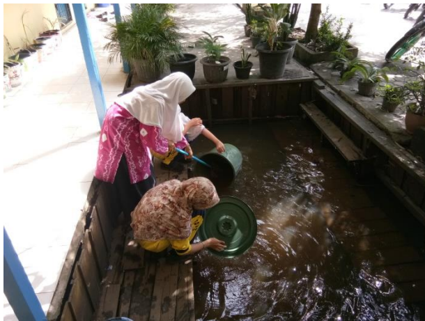
Baksos seluruh pengurus OSIS