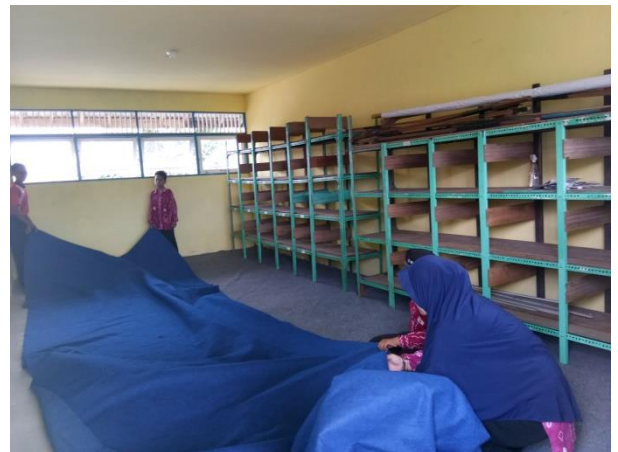
Baksos seluruh pengurus OSIS