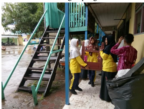
Baksos seluruh pengurus OSIS