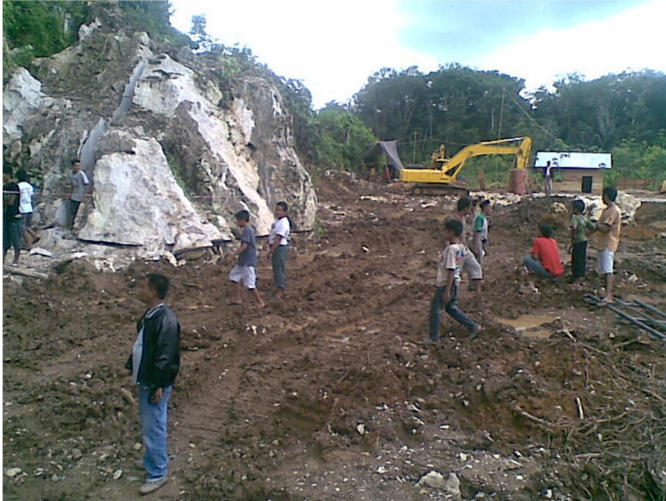
Lokasi Tambang Batu Gunung di Kecamatan Jaro