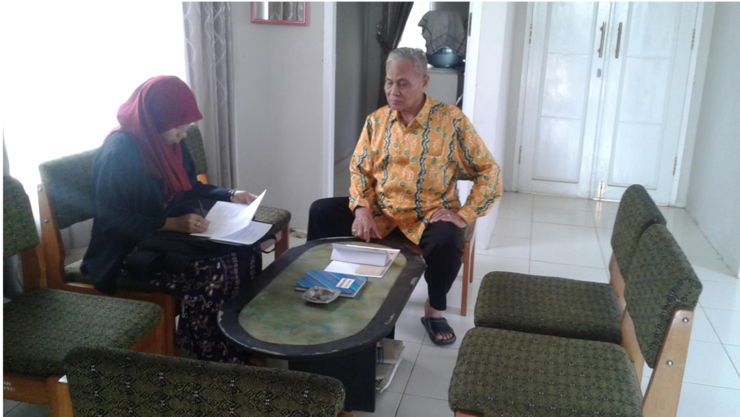
Kegiatan Wawancara 1 dengan Ketua Umum MUI Kabupaten Tabalong