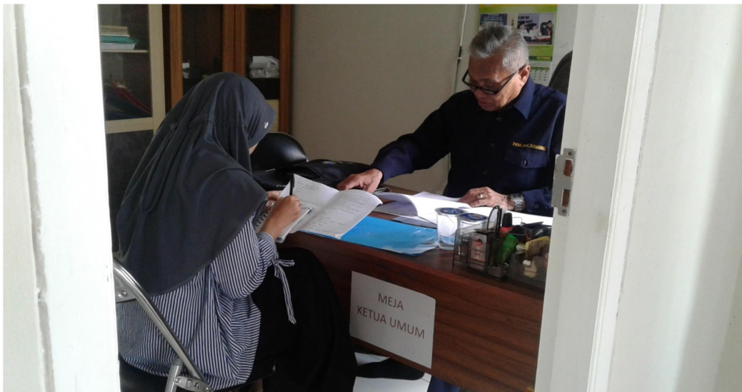
Kegiatan Wawancara 2 dengan Ketua Umum MUI Kabupaten Tabalong