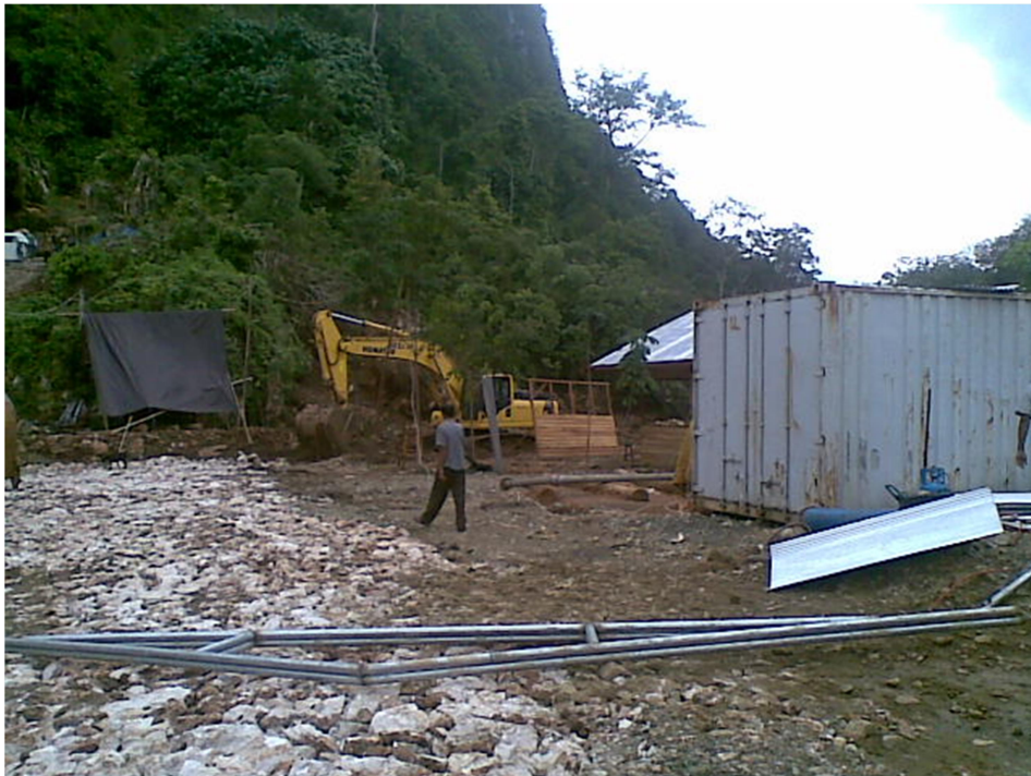
Tambang Batu Gunung