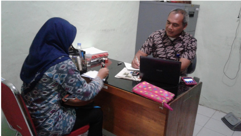
Kegiatan Wawancara 1 Pihak Dinas Lingkungan Hidup Kabupaten Tabalong