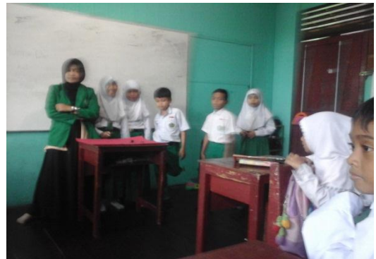
Proses Pembelajaran model TGT dengan menggunakan media monopoli