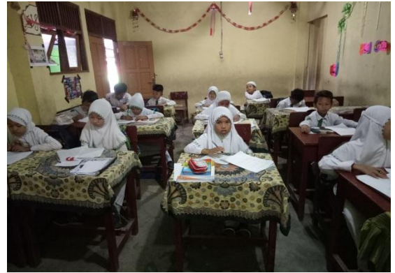
Uji Coba Validitas Soal di MIN 4 Kota Banjarmasin