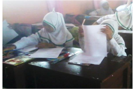
Posttest kelas kontrol