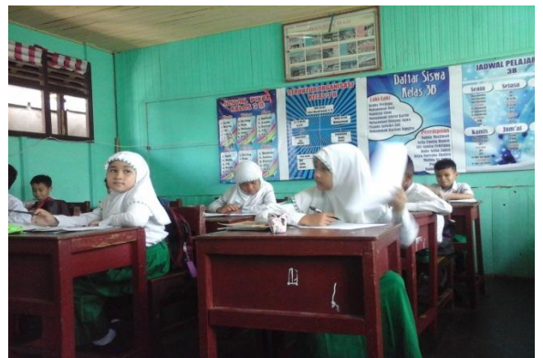
Pretest Kelas Eksperimen