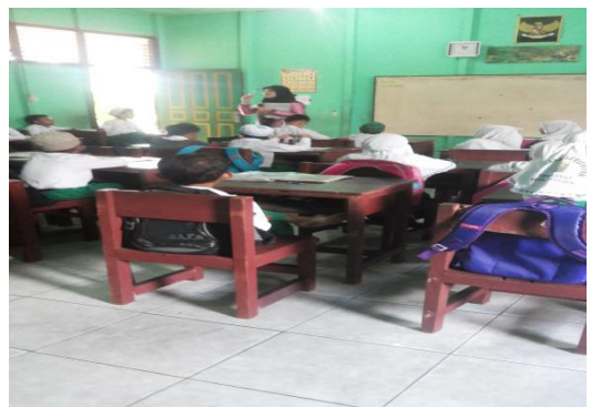
Proses Pembelajaran di kelas kontrol dengan model snow balling