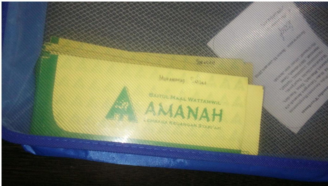
Rekening tabungan BMT Al-Amanah