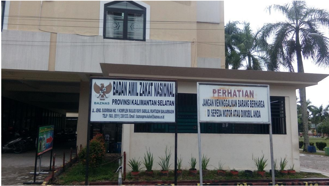
Kantor BAZNAS Provinsi Kalimantan Selatan