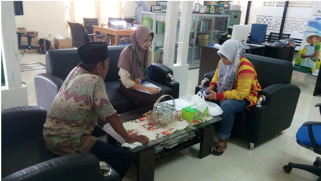
Menerima Bantuan Biaya Pendidikan