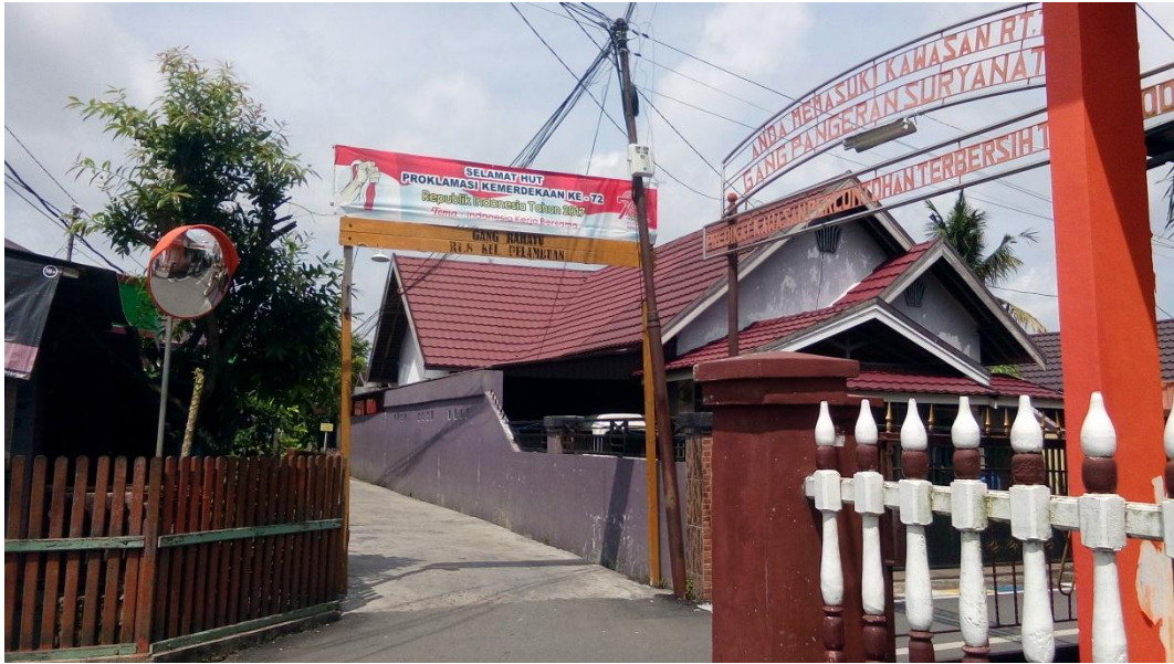
Jalan Sutoyo S, Gang Rahayu, Kel. Pelambuan