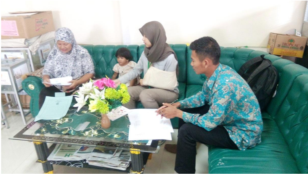
Menerima berkas permohonan bantuan modal usaha